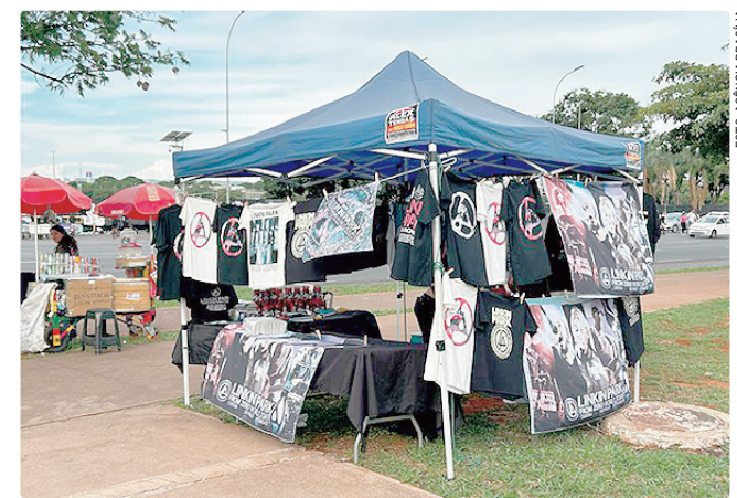
Inscrição para participação nos eventos será na segunda-feira (11)

A divulgação do resultado do chamamento com os nomes dos vendedores ambulantes contemplados será divulgada no dia 12 de maio, no período da tarde, no site da Secretaria de Governo (Segov-DF). As licenças do Festival Meskla serão entregues no dia 15 e do Porão do Rock no dia 21 de maio, no Anexo do Palácio do Buriti, das 9h às 16h, onde serão repassadas orientações.