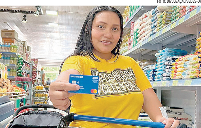
O Cartão Prato Cheio teve 3.018 novas famílias contempladas em maio

O Cartão Prato Cheio teve 3.018 novas famílias contempladas em maio. Destas, 1.209 entraram no programa pela primeira vez e devem buscar seus cartões nas agências do Banco Regional de Brasília (BRB). As famílias que retornam ao programa devem utilizar o cartão que já possuem. Para pagamento do DF