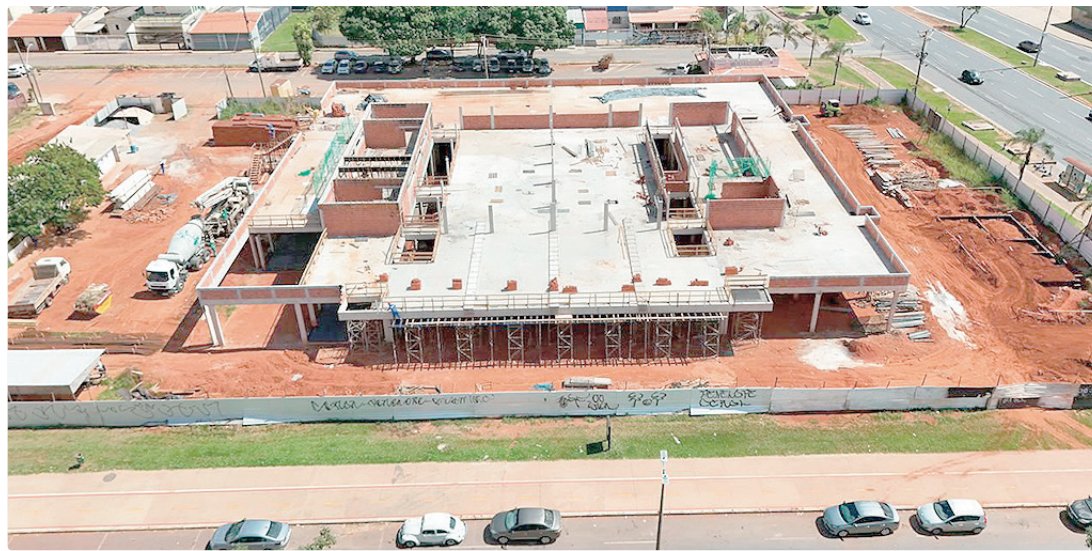
As novas UPAs terão área de 2.632 m², 65 leitos, consultórios médicos, salas de estabilização e laboratórios

Cada nova unidade será de porte 3, o maior na classificação do Ministério da Saúde, com área de 2.632 m² e 65 leitos — 33 para adultos e 32