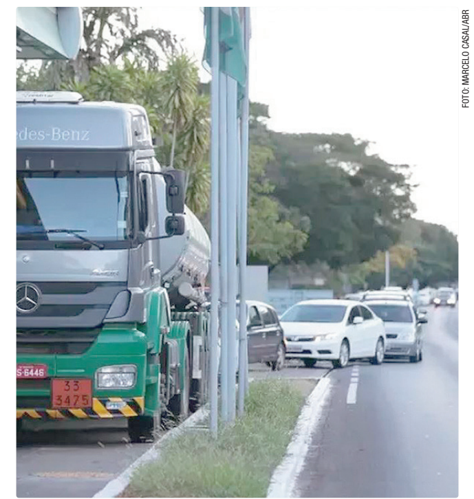
Em dois meses, GDF poderá abrir mão de até R$ 11,6 milhões

O programa prevê redução de até R$ 1,20 por litro de diesel importado, dividido igualmente entre a União e os entes federativos que aderirem à proposta. Serão R$ 0,60 pagos pelas unidades da Federação (de forma voluntária) e R$ 0,60 pela União. A participação do DF ocorrerá por meio de retenções no Fundo de Participação dos Estados e do Distrito Federal (FPE).