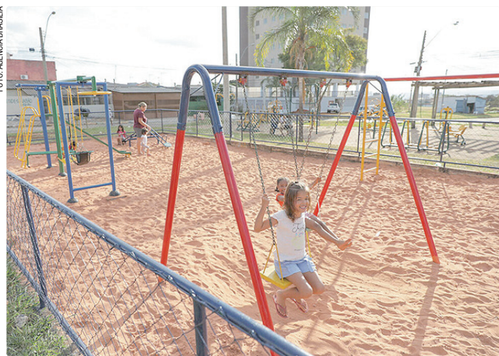
Foram verificados brinquedos e feitas roçagem, limpeza e troca de areia

na reforma do parquinho da QNN 39, em Ceilândia Norte. As ações incluíram manutenção de brinquedos, capina, roçagem, limpeza geral e troca de areia, medida essencial para garantir mais higiene e segurança às crianças que utilizam os espaços diariamente na região.