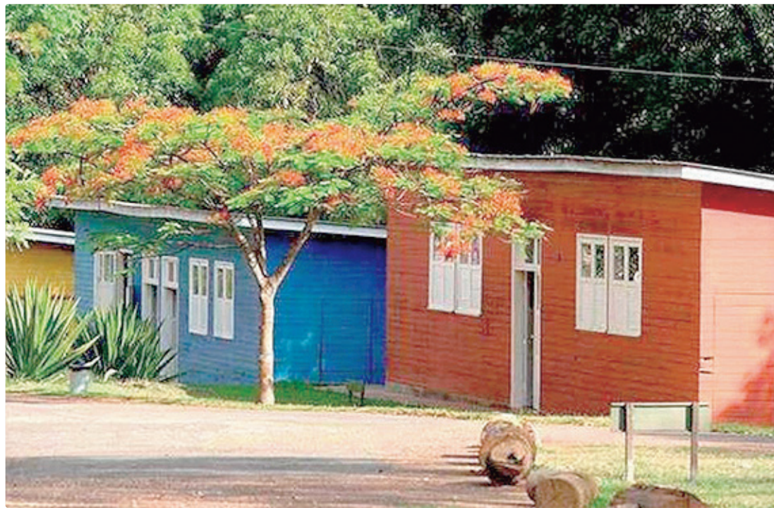
Museu criado em 1990 fica no Núcleo Bandeirante e terá programação gratuita de aniversário neste sábado (9)

Além da feira de artesanato, o público poderá participar de uma conversa sobre memórias da construção de Brasília e acompanhar apresentações do projeto Café, Som e Viola, fomentado pelo Fundo de Apoio à Cultura (FAC). O momento cultural busca resga-