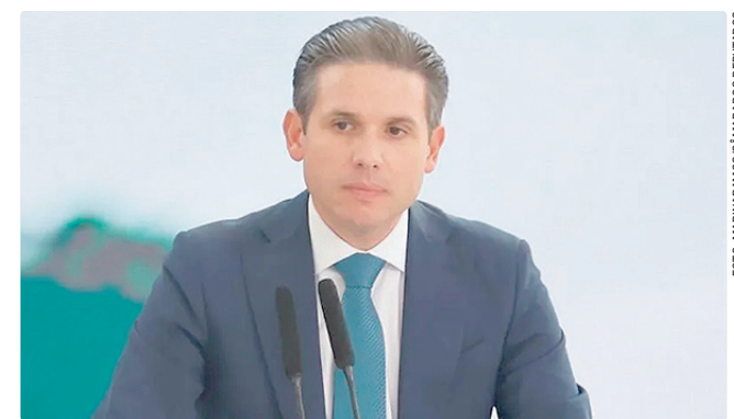
Hugo Motta defendeu que setores venham “à mesa” para negociar

Nesta quinta, a pedido de Hugo Motta, integrantes da comissão especial da PEC 6x1 participam de audiência sobre a proposta na Assembleia Legislativa do Estado da Paraíba. O debate também tem a participação do ministro do Trabalho e Emprego, Luiz Marinho.