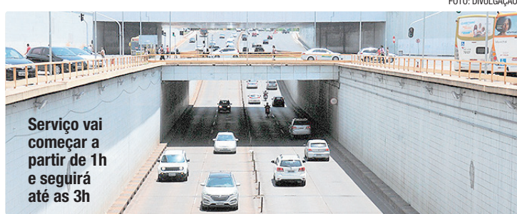
Serviço vai começar a partir de 1h e seguirá até as 3h

O Buraco do Tatu será interditado na madrugada desta sexta-feira (8) para aferição dos equipamentos medidores de velocidade (radares). O Departamento de Estradas de Rodagem do Distrito Federal (DER-DF) começará o serviço à 1h, com previsão de término para as 3h. A via