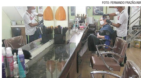
Estudo do Sebrae conclui que políticas sociais estimulam autonomia

A conclusão é que os benefícios sociais são um estímulo para que as pessoas busquem autonomia financeira, diz o presidente