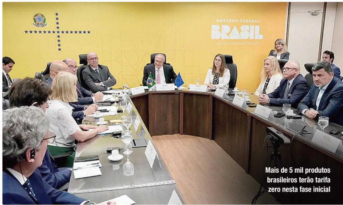
Mais de 5 mil produtos brasileiros terão tarifa zero nesta fase inicial

“Esperamos que a decisão do Tribunal de Justiça e, depois, a aprovação ou ratificação que se seguirá no Parlamento Europeu sejam positivas. Estou crendo que sim”, afirmou o deputado