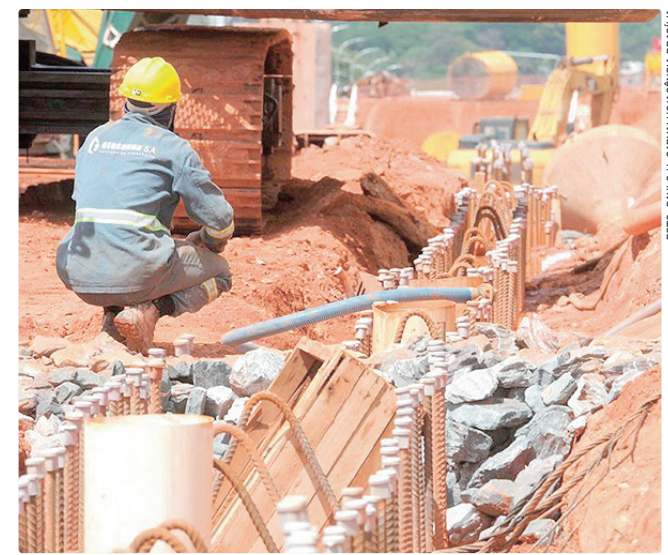
O posto com maior remuneração é o de mestre de obras: R$ 3.718

Outros cargos destacam-se pela quantidade de oportunidades abertas, com 30 cada. Entre eles, o de operador de caixa. Os interessados precisam ter iniciado o ensino médio, mas não há exigência de experiência. O salário é de R$ 1.621. Para participar dos processos seletivos,