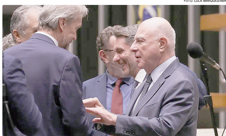
Projeto de lei prevê a criação de um comitê ou conselho para analisar o setor

jeito será vinculado ao Conselho Especial de Minerais Críticos e Estratégicos (CMCE), órgão de assessoramento presidencial sobre a formulação de políticas e diretrizes voltadas ao desenvol-