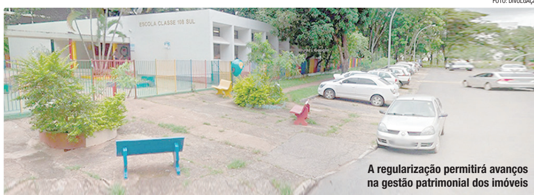
A regularização permitirá avanços na gestão patrimonial dos imóveis

Ao todo, foram regularizadas áreas que somam 9.587,45 m², destinadas às escolas classe da 103 Sul, 108 Sul, 405 Sul e 315 Sul, além do Jardim de Infância da 108 Sul. Os projetos urbanísticos, solicitados pela antiga Fundação Educacional do