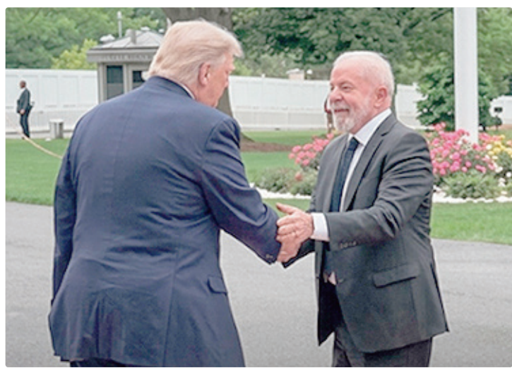
Encontro entre Trump e Lula é classificado como reunião de trabalho

A comitiva também inclui o diretor-geral da Polícia Federal,