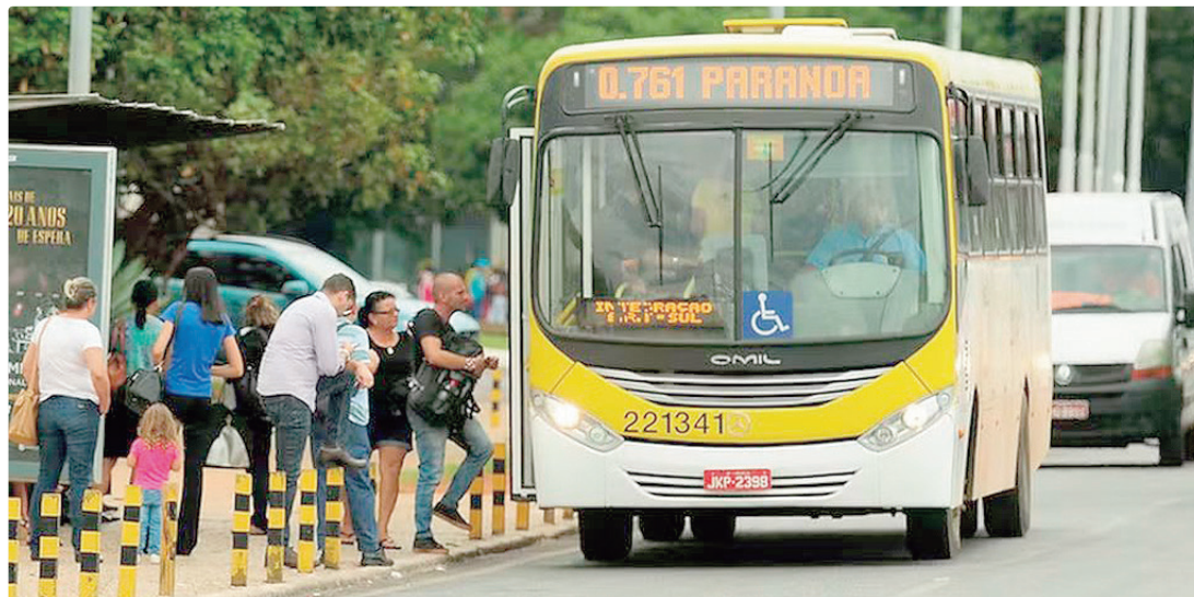
Nos últimos dez anos (de 2016 para cá), roubos em transporte coletivo no DF caíram 96%, aponta a SSP-DF

Ainda de acordo com o secretário, a queda é resultado de um conjunto de medidas.