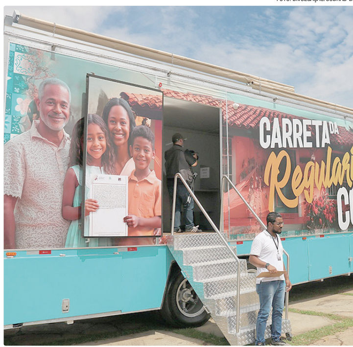
Moradores vão saber sobre dúvidas, acompanhar processos e documentos

A iniciativa faz parte do trabalho itinerante realizado em parceria com a Codhab-DF, com execução do Instituto Nacional de Empoderamento Social e Qualificação (Inesq), e tem como objetivo facilitar o acesso da população aos serviços de regularização fundiária, levando os atendimentos dire-