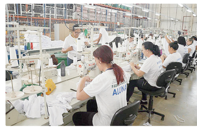
Caso ocorram desistência, novos candidatos serão convocados

Somente terão a matrícula efetivada os candidatos que atenderem aos critérios previstos no Edital de Chamamento Público nº 17/2026, respeitando o limite de vagas disponíveis. Caso ocorram desistências ou permaneçam vagas em aberto após esta etapa, novos candidatos da lista de espera poderão ser convocados conforme a ordem de classificação do processo seletivo.