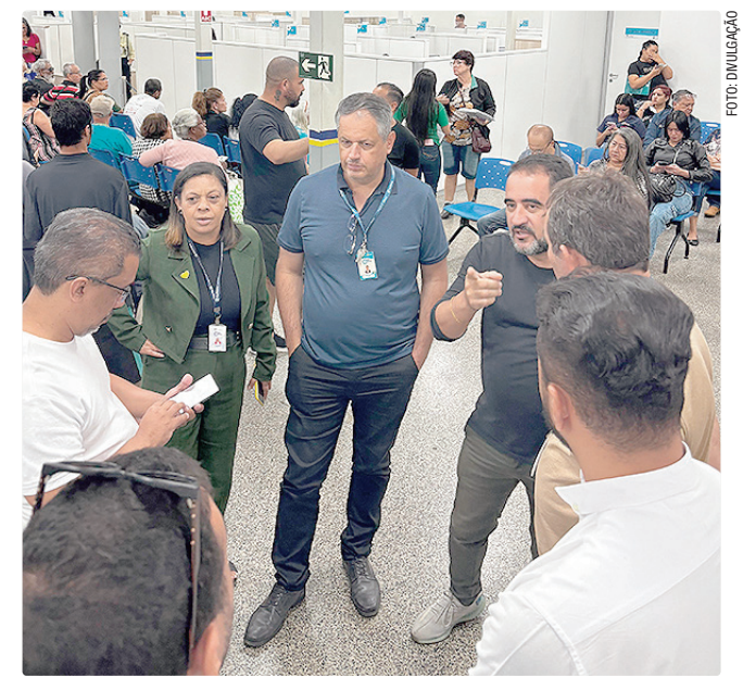
Equipes percorreram os ambientes internos e externos das feiras