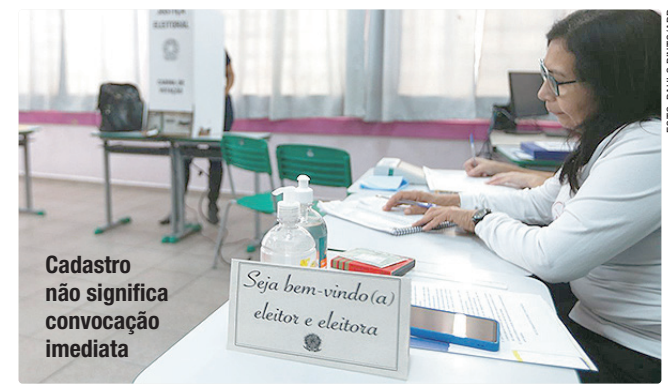
Cadastro não significa convocação imediata

No dia da eleição, a ausência não justificada do mesário pode gerar penalidade. Em caso de impedimento para o trabalho, o convocado deve apresentar uma justificativa, como um atestado médico, que será analisado. Se a justificativa não for aceita, a penalidade poderá ser uma suspensão.