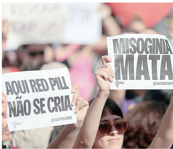
Pesquisadores coletaram mais de 289 mil publicações sobre o tema no X

Caso seja aprovado pela Câmara sem alterações, o texto passará a incluir a “condição de mulher” na Lei do Racismo (Lei 7.716/1989), prevendo pena de dois a cinco anos de prisão, além de multa, para práticas