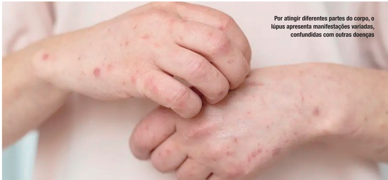
Por atingir diferentes partes do corpo, o lúpus apresenta manifestações variadas, confundidas com outras doenças