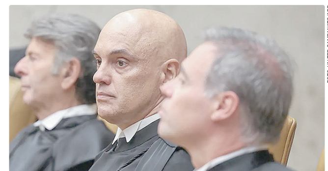
Moraes é relator de ações contra a legislação que tramitam na Corte

Na sexta-feira, Moraes concedeu o prazo de cinco dias para que a Presidência da República e o Congresso Nacional se manifestem sobre a Lei da Dosimetria.