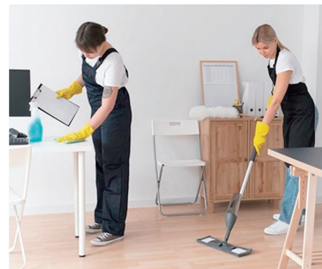
Maior salário é para chefe de serviço de limpeza: R$ 3.542,51

Empregadores e empreendedores que desejem ofertar vagas ou utilizar o espaço das agências do trabalhador para as entrevistas podem se cadastrar pessoalmente nas unidades ou pelo e-mail gcv@se. Pode ser utilizado, ainda, o Canal do Empregador, no site da Secretaria de Desenvolvimento Econômico, Trabalho e Renda (Sedet).