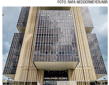
Projeções foram divulgadas nesta segunda-feira, pelo Banco Central

Os economistas do mercado financeiro elevaram novamente sua estimativa para a inflação em 2026. Desta vez, de 4,89% para 4,91%. Esta é nona semana seguida de aumento. As expectativas fazem parte do “Boletim Focus”, divulgado nesta segunda-feira (11) pelo Banco Central (BC), com base em pesquisa realizada na última semana com mais de 100 instituições financeiras. A explicação é que a guerra no Oriente Médio fez disparar o preço do petróleo — que opera, nesta segunda,