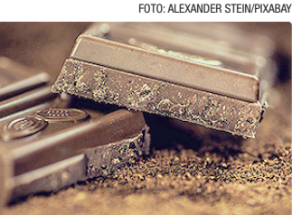
Chocolate ao leite deve conter, no mínimo, 25% de sólidos de cacau

Um dos principais avanços previstos é a obrigatoriedade de informar nos rótulos o percentual total de cacau do produto.