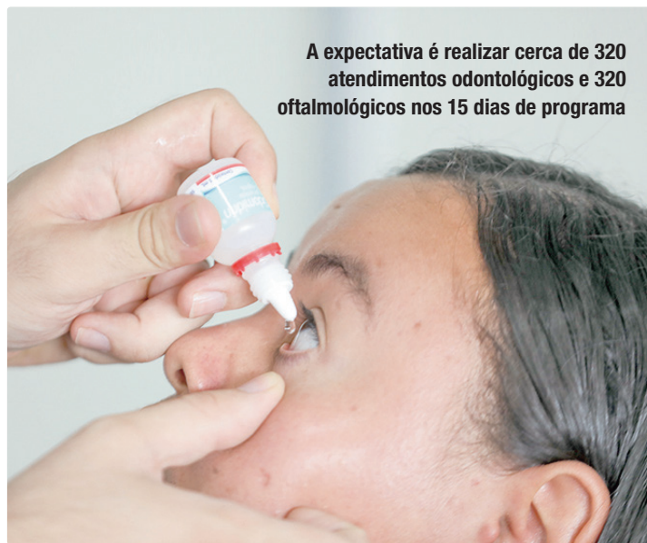
A expectativa é realizar cerca de 320 atendimentos odontológicos e 320 oftalmológicos nos 15 dias de programa

É possível fazer a inscrição prévia pelo site, informando os dados do responsável e da criança ou adolescente, além de escolher o dia e o turno da consulta. Também há opção de agendamento presencial no local da ação, mediante apresentação de documento com foto. Mais informações estão disponíveis no site do projeto () ou no perfil Olhar Cidadão no Instagram @olharcidadao.df.