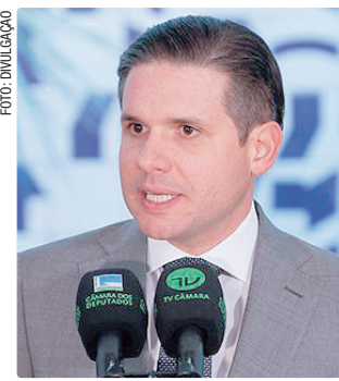
Motta diz que o Congresso vai defender a aplicabilidade da lei

No último sábado (9), suspendeu a aplicação da nova lei citando duas ações que questionam a constitucionalidade da lei e que devem ser julgadas pelo plenário da Suprema Corte. Na prática, com a decisão do ministro, os condenados pelos atos golpistas de 8 de janeiro de 2023 terão que aguardar o plenário do STF decidir se a lei respeita as regras da Constituição Federal para perdirem e obterem os benefícios da redução da pena.