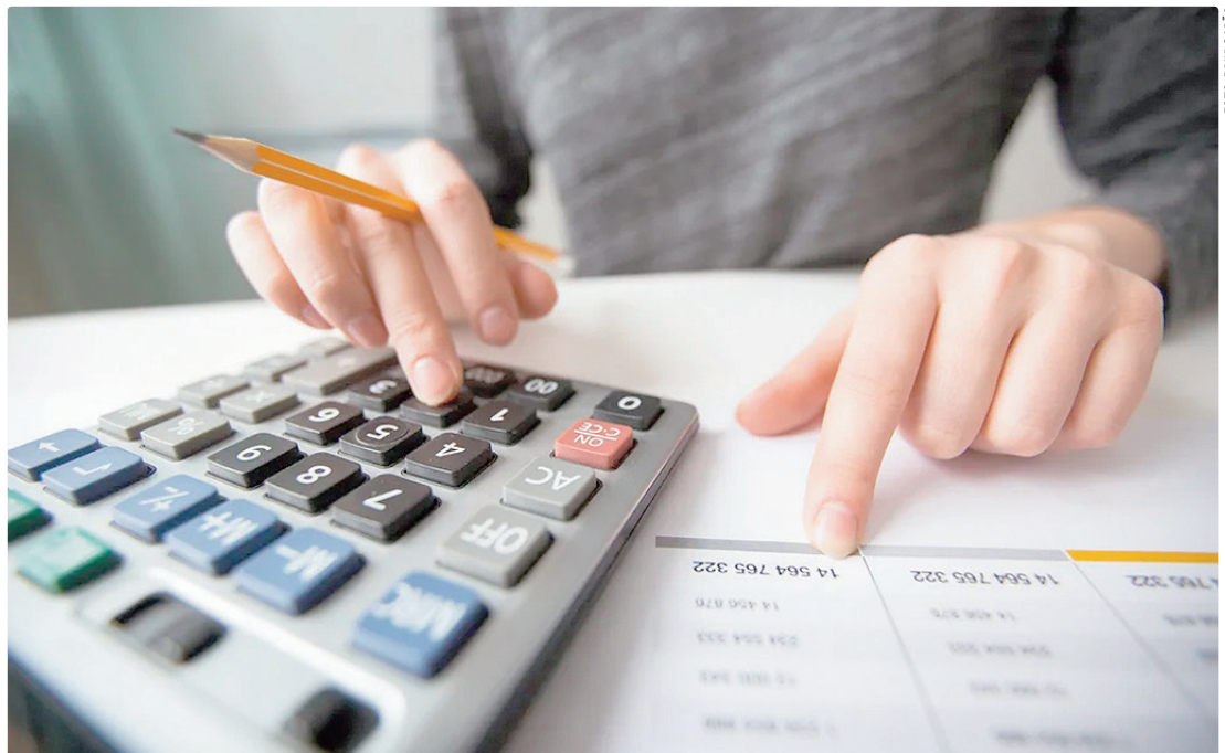
O Tesouro Reserva é um lançamento do Tesouro Nacional, da B3 e do BB; aplicação prevê rendimento indexado à Selic

Ao contrário do Tesouro Selic, o Tesouro Reserva não terá marcação a mercado, o que