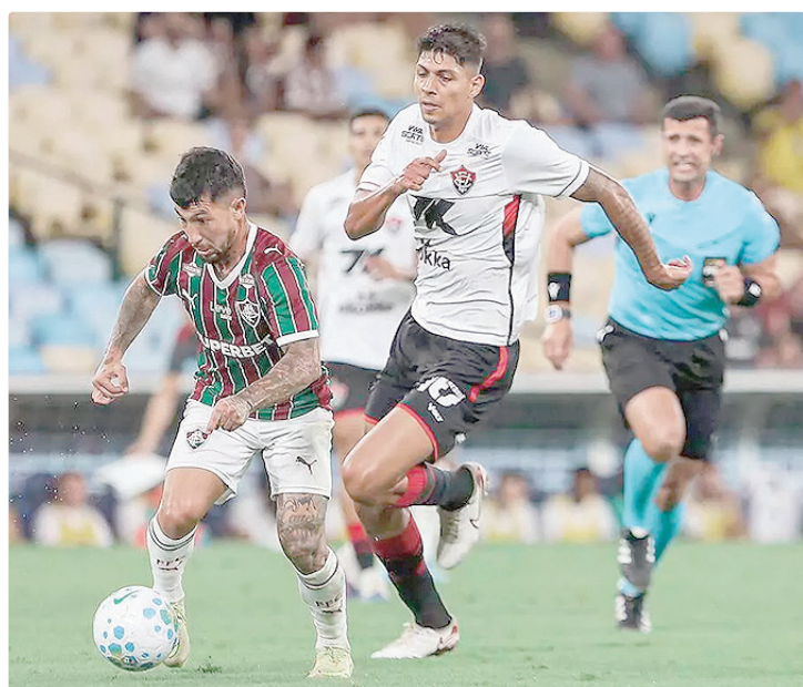
No duelo de ida, em Ponta Grossa, as equipes ficaram no empate sem gols

O Operário-PR vem de derrota para o CRB, por 3 a 0, pela 8ª rodada da Série B, fora de casa, e deixou o G6 da competição. O time ocupa a oitava colocação da tabela da Segunda Divisão, com 12