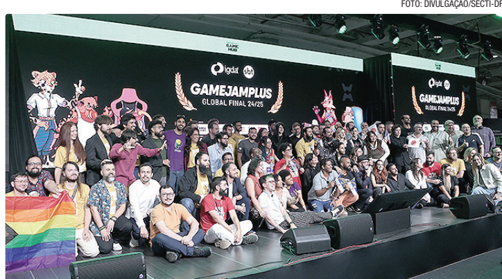
Encontro ocorre até quinta (14), no Centro de Convenções Ulysses Guimarães

Quem participa do Innova Summit vive uma verdadeira troca de experiências. O evento se tornou um espaço onde profissionais, estudantes, empreendedores, investido-