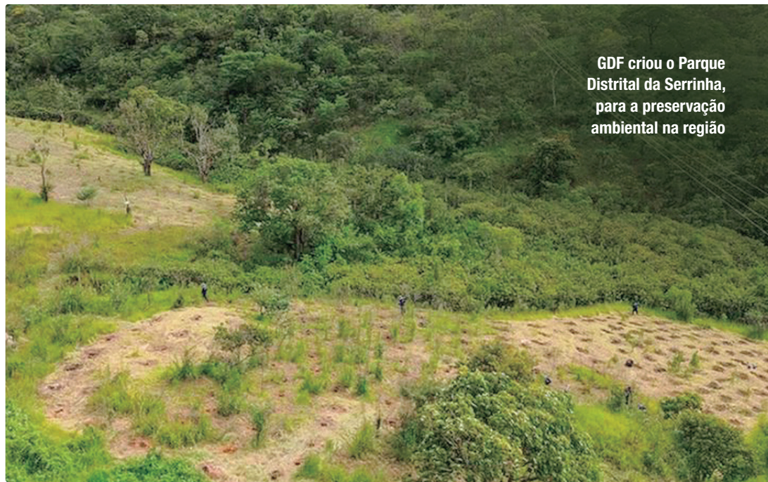
GDF criou o Parque Distrital da Serrinha, para a preservação ambiental na região

Segundo a justificativa encaminhada pelo Executivo à Câmara Legislativa do Distrito Federal (CLDF), foi identificado que os dois imóveis possuem restrições relacionadas à destinação e questões ambientais. A Serrinha do Paranoá, por exemplo, passou recen-