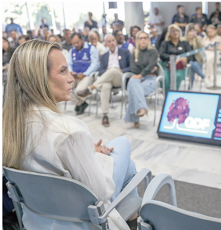
Celina anunciou a extensão da plataforma para toda a rede pública do DF

A plataforma utiliza o sistema Sismedex e acompanha todo o fluxo do paciente, desde a solicitação do medicamento até a entrega final. Integrada ao Cartão Nacional de Saúde,