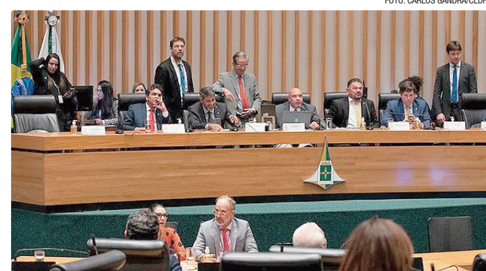
Denúncia anônima de servidores da CLDF levou à abertura do processo

A denúncia apresentada cita monitoramento de “conteúdo trafegado pelos usuários da rede corporativa”. O relato teria sido feito por servidores da CLDF. Segundo a denúncia, no fim de março foi ativada uma funcionalidade suspeita conhecida como Deep Inspection, que pode ampliar a capacidade de segurança interna, mas também possibilita a inspe-