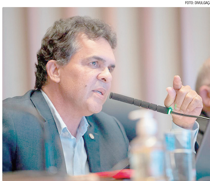
Vice-presidente da CLDF, Vale reforça a defesa dos direitos dos feirantes

Como encaminhamento imediato, o deputado anunciou uma série de reuniões estratégicas: na próxima quinta-feira (14), às 10h, haverá um encontro na Vice-Presidência da CLDF com a Procuradoria da Casa e representantes das feiras. Na sequência, também estão previstas reuniões com o Procurador do Ministério Público do DF e Territórios, com a Secretaria de Governo