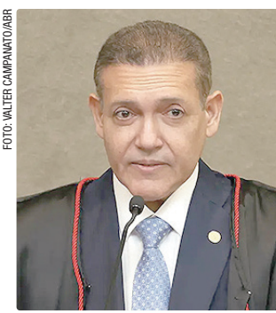
Nunes Marques tomou posse como presidente do TSE na terça

Nunes Marques também defendeu o sistema eletrônico de votação e disse que o mecanismo é um “patrimônio da democracia”. “O sistema eletrônico de votação brasileiro constitui patrimônio institucional da nossa democracia. No tocante à apuração, recepção e divulgação dos votos, o nosso sistema é o mais avançado do mundo”, completou.