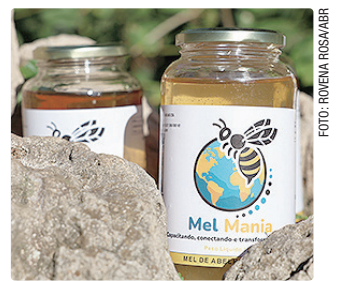
Argumento de uso de antibióticos não se sustenta no caso do mel