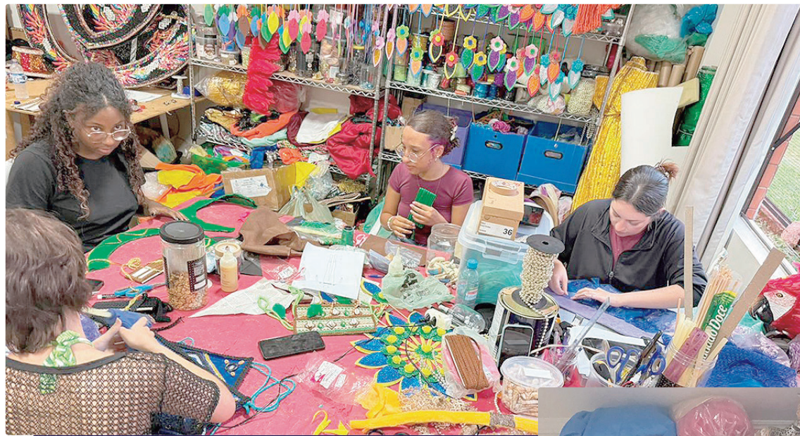
Alunos vão ajudar na produção da decoração do 37º Forrocilore do Seu Antônio, que será realizado nos dias 12, 13 e 14 de junho

Além da formação artística, os participantes irão colaborar diretamente na produção da decoração do “37º Forrocilore do Seu Antônio”, tradicional festa junina promovida pela ADHAS, que será realizada nos dias 12, 13 e 14