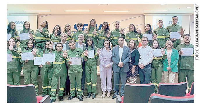
Formatura da 21ª turma reforça o investimento nas mulheres

Desde 2021, a escola de eletricistas já formou 460 profissionais no Distrito Federal. Desse total, 383 foram contratados, o equivalente a um índice de aproveitamento de 83%. O programa vem se consolidando como referência na formação técnica e na ampliação da presença feminina no setor elétrico.