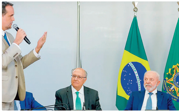
Medida mantém só os 20% do ICMS sobre compras internacionais até US$ 50

Em nota, o Instituto para Desenvolvimento do Varejo (IDV) informou que a revogação amplia a desigualdade tributária