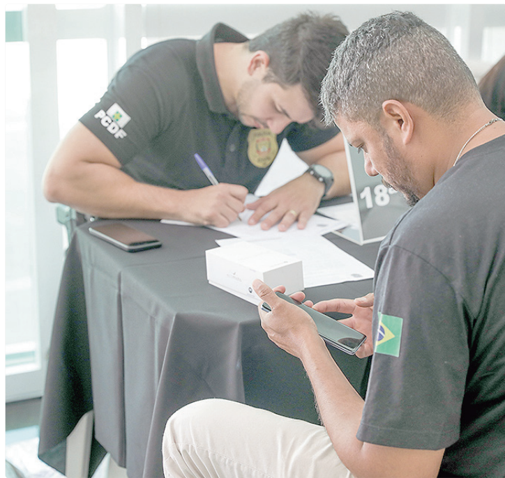
IMEI do aparelho é fundamental para que a PCDF alcance o autor do crime

A chefe do Executivo também citou o impacto da perda