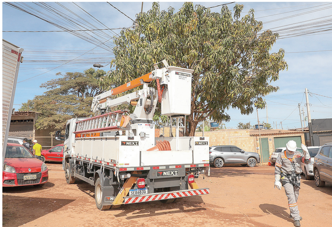
Serviços incluem a pavimentação de 5,5 km e a instalação de iluminação pública com lâmpadas de LED

Antes, a área contava apenas com pavimentação provisória e sofria com a ausência de um sistema adequado de