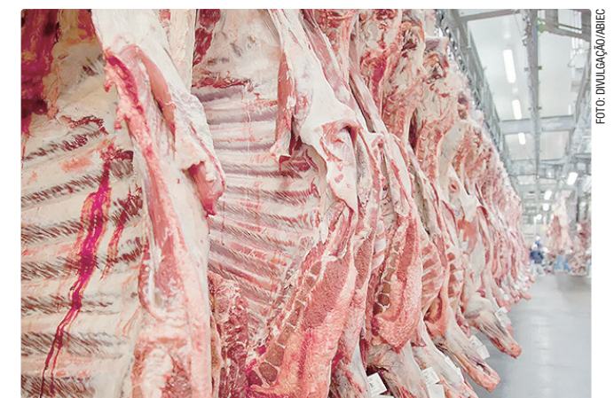
Decisão se baseia em uso de antimicrobianos pela pecuária brasileira

Segundo o texto, a decisão foi tomada após votação realizada no Comitê Permanente para Plantas, Animais, Alimentos e Ração da Comissão Europeia, responsável por atualizar a lista de países aptos a exportar produtos de origem animal para a União Europeia. O governo ressaltou que, apesar da decisão, as exportações brasileiras seguem ocorrendo normalmente no momento e que a medida europeia só deve entrar em vigor em 3 de setembro de 2026.