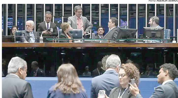
Renovação automática será para inscritos no cadastro dos bons condutores

O RNPC oferece benefícios aos motoristas que não cometeram infrações de trânsito sujeitas à pontuação nos últimos 12 meses. Entre os benefícios estão descontos em