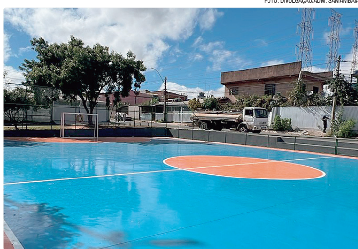
A reforma devolve à população um ambiente mais moderno e seguro

tados estão a reconstrução do piso da quadra, aplicação de pintura em poliuretano, que garante mais resistência e maior durabilidade, e instalação de um novo alambrado, que proporciona mais segurança