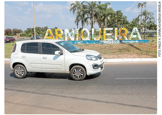
Estrutura oferecerá serviços 24 horas e registro de solicitações