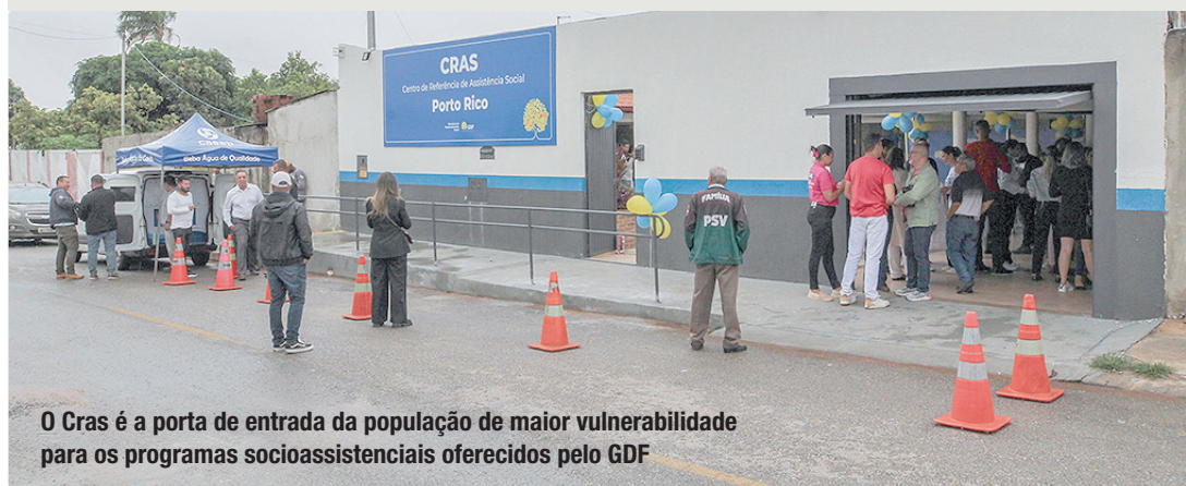
O Cras é a porta de entrada da população de maior vulnerabilidade para os programas socioassistenciais oferecidos pelo GDF