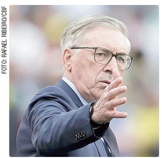
Ancelotti fará a convocação oficial no dia 18 de maio, no RJ

Um dia após a partida, a seleção embarcará para os Estados Unidos. Antes da estreia na Copa, o Brasil disputará um último amistoso contra o Egito em 6 de junho (sábado) em Cleveland. O primeiro jogo da seleção no Mundial será contra o Marrocos, em 13 de junho (sábado), às 19h, em Nova Jersey. A Amarelhinha está no Grupo C que tem ainda Escócia e Haiti.