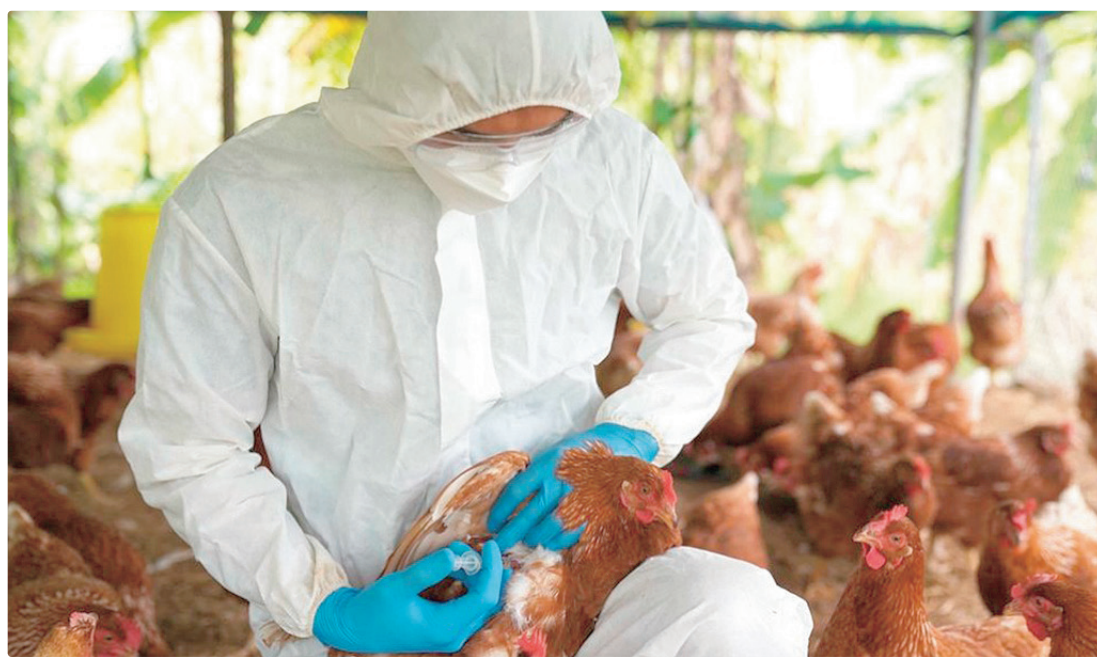
Governadora assinou decreto impondo situação de emergência, para evitar que a Gripe Aviária chegue ao DF

Em 26 de março, o Mapa prorrogou por mais 180 dias o estado de emergência zoossanitária em todo o país devido à circulação do vírus da influenza aviária H5N1.