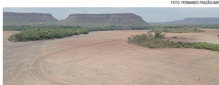
Regra exige checagem de desmatamento por imagens de satélite (Prodes)

A regra havia começado a valer em 1º de abril deste ano, inicialmente para imóveis maiores. Com a mudança aprovada pelo CMN, os novos pra-