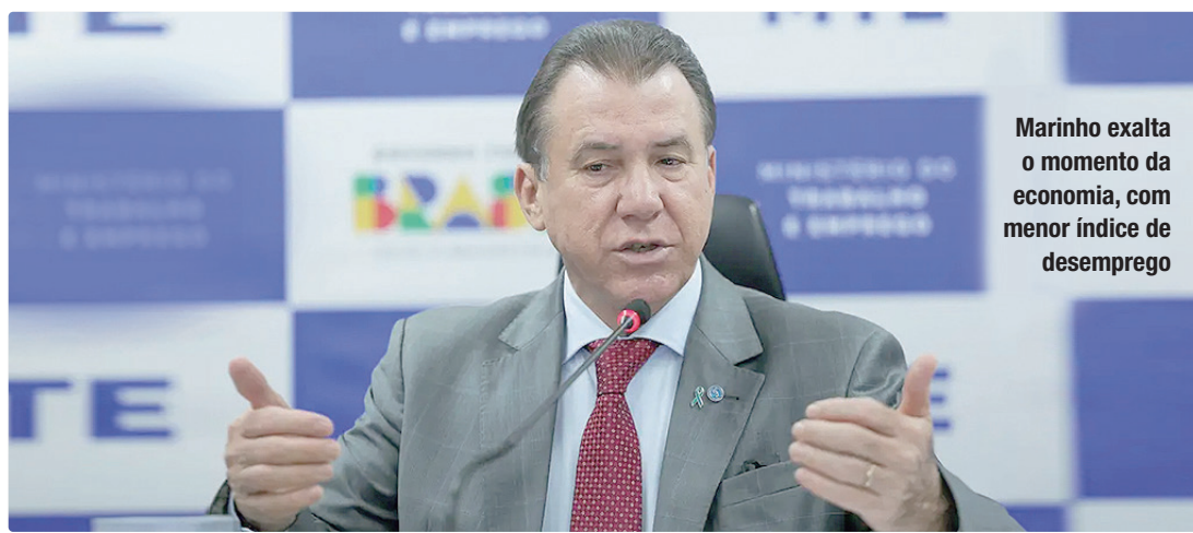
Marinho exalta o momento da economia, com menor índice de desemprego

O principal setor responsável pelo estoque de empregos foi o de Serviços, com 35,695 milhões, uma alta de 7,2% em relação a 2024. Na sequência, vem o Comércio, com cresci-