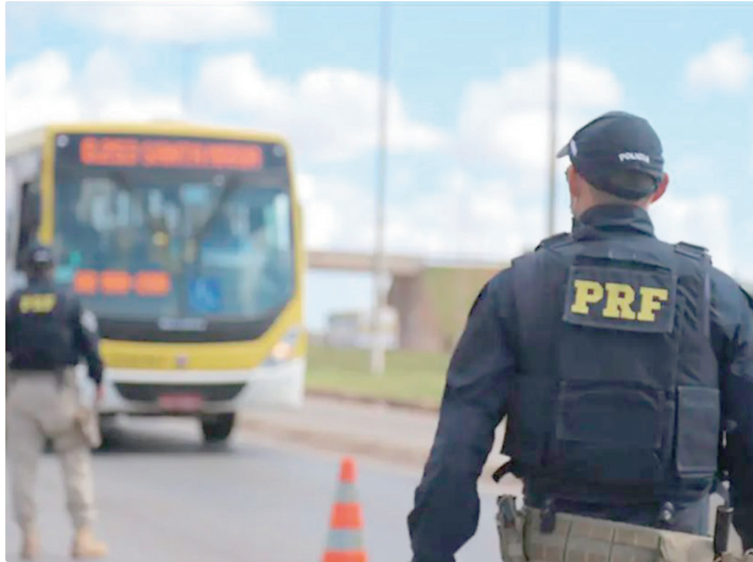
Minas Gerais é o estado que registrou a maior quantidade de sinistros decorrentes de problemas de saúde

Ao analisar especificamente problemas de saúde física e mental causadores de sinistros, percebe-se que o fator tem peso diferente entre os estados brasileiros. Em alguns estados, estas ocorrências superam, em termos proporcionais, os 30% do volume acumulado no período. Exemplo disso são áreas com