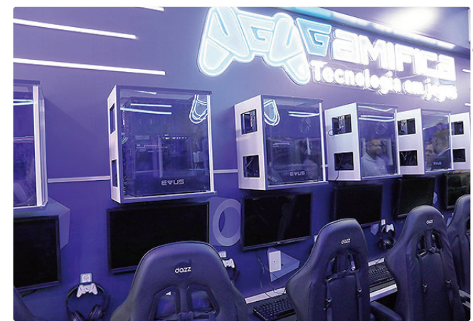
Unidade móvel conta com computadores e estações individuais

As aulas serão realizadas de segunda a sexta-feira, com a entrega dos certificados de conclusão ocorrendo sempre no último dia de curso. Com carga horária de 20 horas e formato híbrido, o curso utiliza a carreta do programa como ambiente de aprendizagem. A unidade móvel é equipada com computadores de alto desempenho, estações individuais e conexão de internet, permitindo a realização de aulas práticas e imersivas para até 20 alunos por turma.