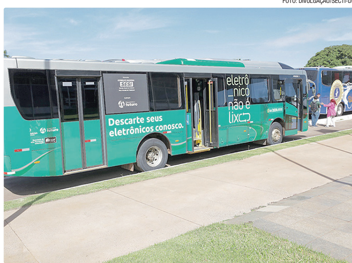
Iniciativa conta com 146 pontos de coleta de computadores e celulares

Com o crescimento acelerado do consumo de equipamentos eletrônicos, o descarte correto desses materiais se tornou um dos principais desafios ambientais da atualidade. Nesse cenário, o Reciclotech atua promovendo a destinação adequada de resíduos eletrônicos, além do reaproveitamento de equipamentos que podem voltar a ser utilizados por instituições e pela população.