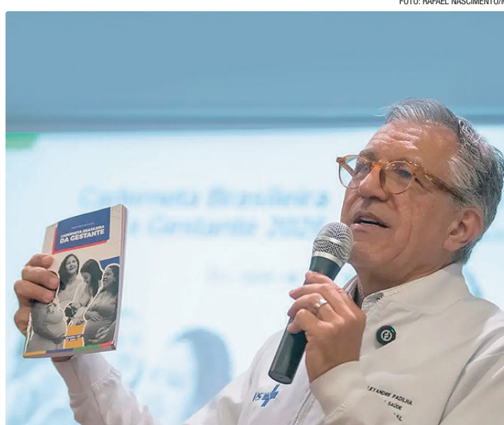
Padilha disse que a atualização inclui mais informações para a gestante

O ministro da Saúde, Alexandre Padilha, explica que a atualização do conteúdo da caderneta inclui informações sobre o cuidado na maternidade e o puerpério, além do plano de parto. “A gestante passa a ter esse instrumento para levar na maternidade, exigir que seja feito [o plano de parto], porque é uma orientação do Ministério da Saúde