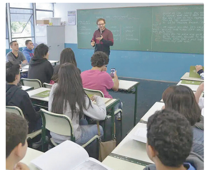
A maior remuneração é para professor de inglês, no Paranoá

Empregadores e empreendedores que desejem ofertar vagas ou utilizar o espaço das agências do trabalhador para as entrevistas podem se cadastrar pessoalmente nas unidades ou pelo e-mail gcv@sedet.df.gov.br . Pode ser utilizado, ainda, o Canal do Empregador, no site da Secretaria de Desenvolvimento Econômico, Trabalho e Renda (Sedet).