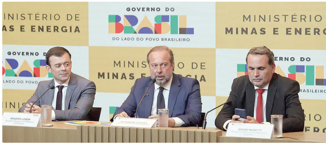
A subvenção de R$ 0,3515 para o diesel entra em vigor em junho; no caso da gasolina, o subsídio será imediato

No caso do diesel, a subvenção de R$ 0,3515 entrará em vigor em junho, quando acabará a redução a zero dos tributos federais. Na prática, o governo vai devolver às refinarias e aos importadores parte dos tributos federais cobrados sobre os combustíveis, como Programa de Integração Social (PIS), Contribuição para o Financiamento da Seguridade Social (Cofins) e