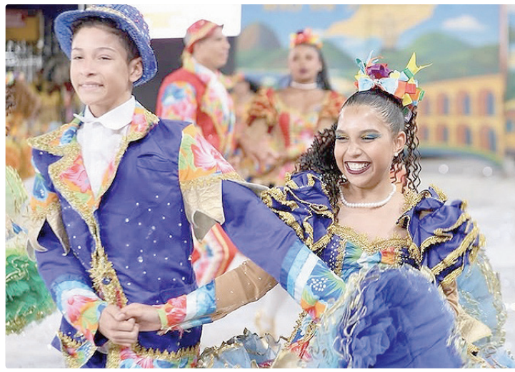
Ceilândia volta a sediar a abertura do Circuito Candangão Junino 2026

A festa será realizada na Praça do Trabalhador, ao lado da Administração Regional de Ceilândia, com entrada gratuita e programação que vai agradar a toda a família. Ao todo, 21 quadrilhas juninas participam da abertura, levando ao público um espetáculo de cores, música, dança e tradição. Além das apresentações, o evento contará com praça de alimentação e estrutura