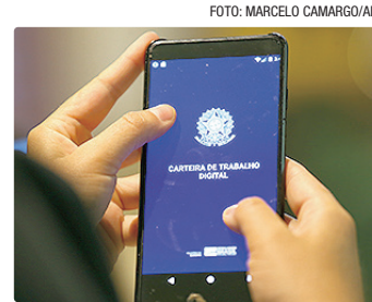
Todos as vagas oferecem benefícios

Todos os postos oferecem benefícios. Para participar dos processos seletivos, basta cadastrar o currículo no aplicativo da Carteira de Trabalho Digital