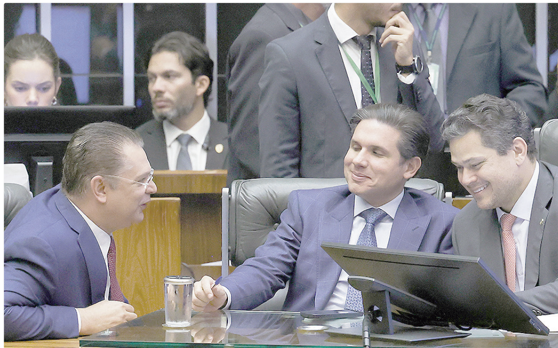
Calendário curto e falta de vontade dos presidentes Motta (Câmara) e Alcolumbre (Senado) inviabilizam abertura

Um deputado do Centrão diz que não é possível pre-