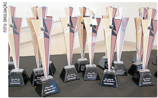
Maior festival de fotografia da América Latina oferece participação gratuita com até cinco fotos sem custo

Outra grande novidade da edição 2026 é o aumento significativo no número de vencedores. O festival passou de 400 para 600 fotografias premiadas, sendo 120 medalhistas e 480 menções honrosas — um acréscimo de 280 menções honrosas em relação à edição anterior. A mudança amplia o reconhecimento aos participantes e fortalece o propósito do BPS de valorizar diferentes olhares e narrativas visuais.