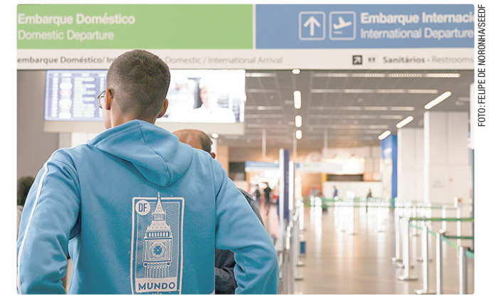
Destinos para este ano são Reino Unido, Espanha, França e Canadá

Após a prova de idiomas, o cronograma prevê a divulgação do resultado preliminar em 2 de junho, com prazo para recurso entre os dias 3 e 5 daquele mês. O resultado definitivo sai em 29 de junho.