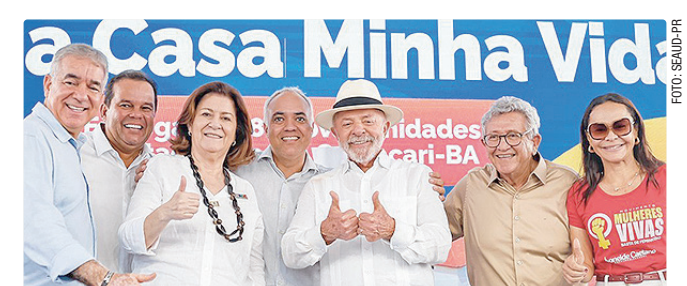
“Pessoas não podem votar em mentira”, afirmou o presidente Lula