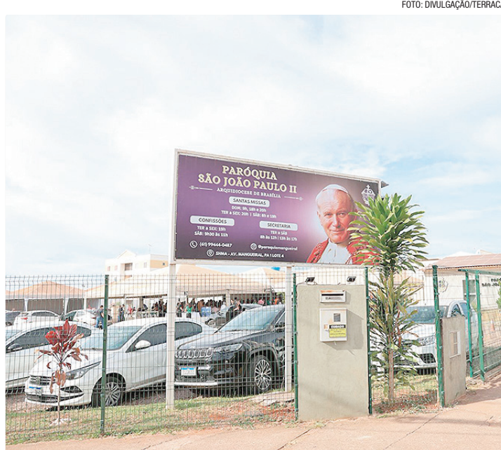
Mais de 600 ocupações religiosas foram reconhecidas pelo GDF, desde 2019