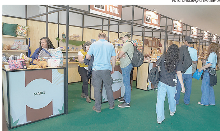
Evento é oportunidade para produtores apresentarem e venderem produtos

Quem visitar o espaço vai encontrar uma vitrine diversificada com o que se produz no campo do DF. Na área de agroindústria, haverá mel, doces, biscoitos, baunilha, geleias, chocolate e panificados artesanais. No artesanato, peças feitas com palha, fibra de