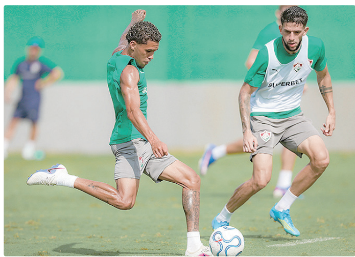
Flu treina sabendo que a situação na competição é bastante complicada

O Bolívar é o segundo colocado, com cinco pontos, e o La Guaira é o terceiro, com três. Já o Independiente Rivadavia é o líder, com 10 pontos e já classificado.