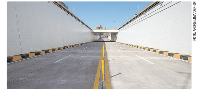
Interrupção do fluxo é essencial para a execução do serviço

Ao todo, o DER-DF conta com 96 câmeras de videomonitoramento. As imagens são monitoradas por agentes de trânsito rodoviário diretamente do Centro de Controle Operacional (CCO) do órgão.