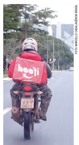
Evento reunirá especialistas para discutir condução segura

O evento é gratuito e integra as ações do Maio Amarelo, que neste ano tem como tema “Enxergar o outro é salvar vidas”. Os interessados podem se inscrever até sexta-feira (22) pelo site www.even3.com.br/seminariomotociclistas-737989/ .