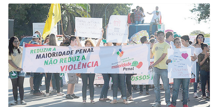
Pais registra 12 mil adolescentes em unidades de internação, diz CNJ