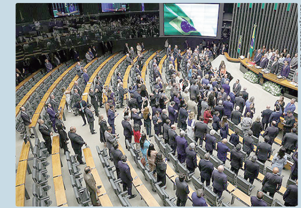
Moraes suspendeu aplicação da lei até julgar ações contrárias

Pelo menos três ações contestam no Supremo a deliberação do Congresso derrubou o veto do presidente Luiz Inácio Lula da Silva ao projeto de lei da dosimetria. As ações foram protocoladas pela Federação PSOL-Rede, Federação PT, PCdoB e PV e a Associação Brasileira de Imprensa (ABI). A expectativa é que as ações sejam julgadas neste mês pela Corte.