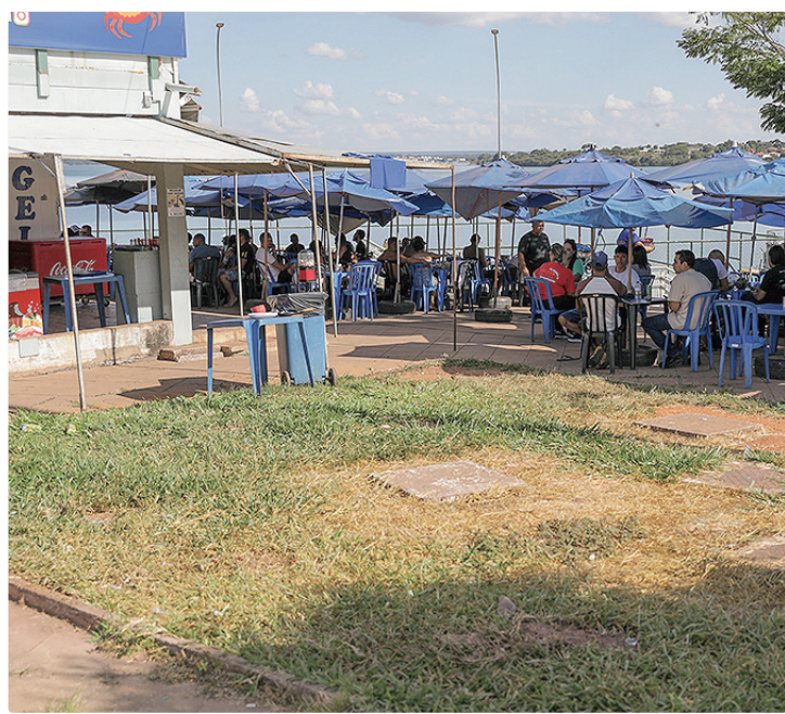
Uso do espaço é muito popular entre moradores do Varjão, Paranoá e Itapoã