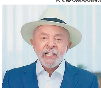
Para Lula, se deixar sem explorar, “Trump acha que é dele e vai lá”

como uma das novas fronteiras de exploração de petróleo e gás no Brasil, com potencial para se tornar um novo “pré-sal”, segundo o Ministério de Minas e Energia (MME).