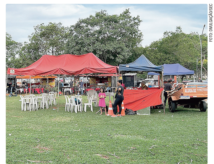
Interessados em licença nos eventos precisam se cadastrar

A divulgação dos nomes contemplados nos dois chamamentos será no dia 22 de maio, no período da tarde, no site da Secretaria de Estado de Governo. As licenças do Favela Sounds serão entregues no dia 28, e a da Solenidade Corpus Christi no dia 3 de junho, no Anexo do Burity, das 9h às 16h, onde serão repassadas orientações sobre o trabalho nos eventos.