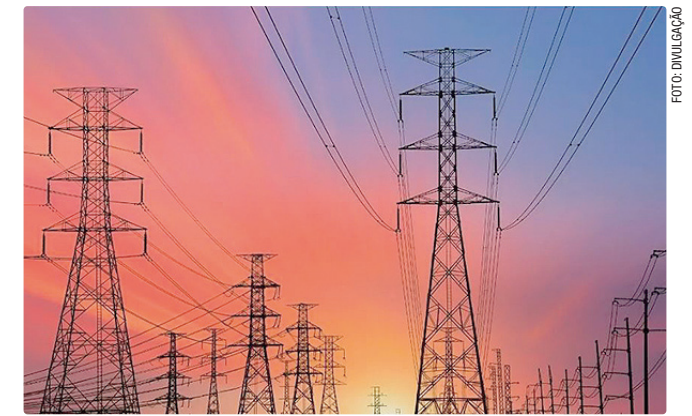
Contas de luz terão desconto de 4,5% em várias regiões do país

Uma lei aprovada recentemente permitiu que as hidrelétricas antecipassem o pagamento de parcelas futuras com desconto de 50%. O dinheiro arrecadado deverá ser usado para reduzir tarifas de energia das áreas atendidas pela Superintendência do Desenvolvimento da Amazônia (Sudam) e pela Superintendência do Desenvolvimento do Nordeste.