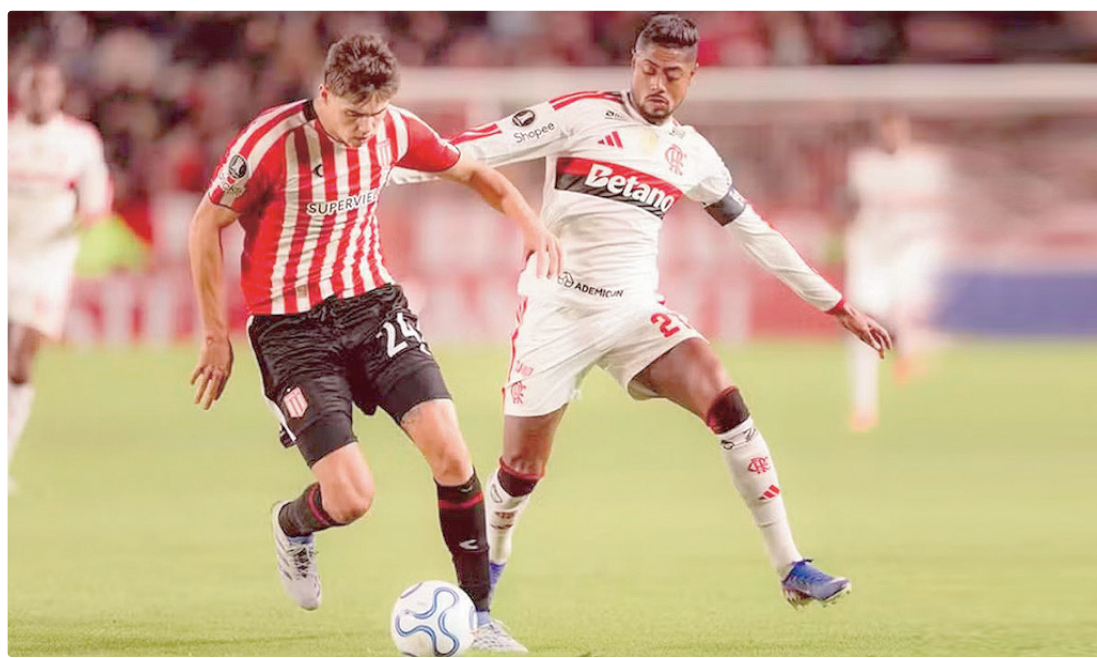
Flamengo entra em campo como time que mais cedeu jogadores à Seleção Brasileira para a Copa do Mundo 2026

Ofensivamente, a Nação rubro-negra marca 2,03 gols por jogo na temporada e, nas últimas dez partidas, acumula 19 gols. Bruno Henrique e