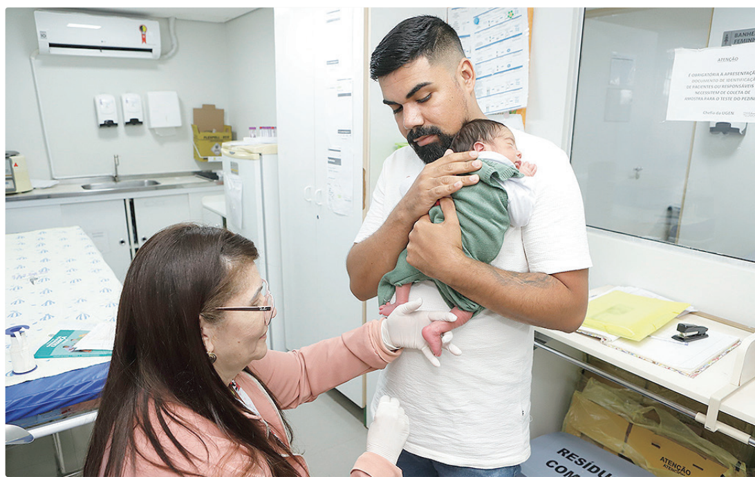
O teste do pezinho é um exame simples, feito a partir de gotas de sangue coletadas do calcanhar do bebê

“Ao identificarmos resultados positivos, conseguimos diagnosticar, intervir e tratar com antecedência”, explica Victor Araújo, responsável téc-