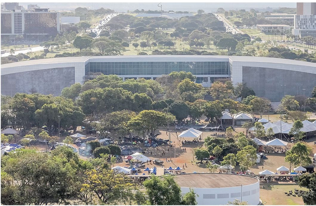
A capital federal se consolida entre os principais destinos brasileiros para congressos e eventos