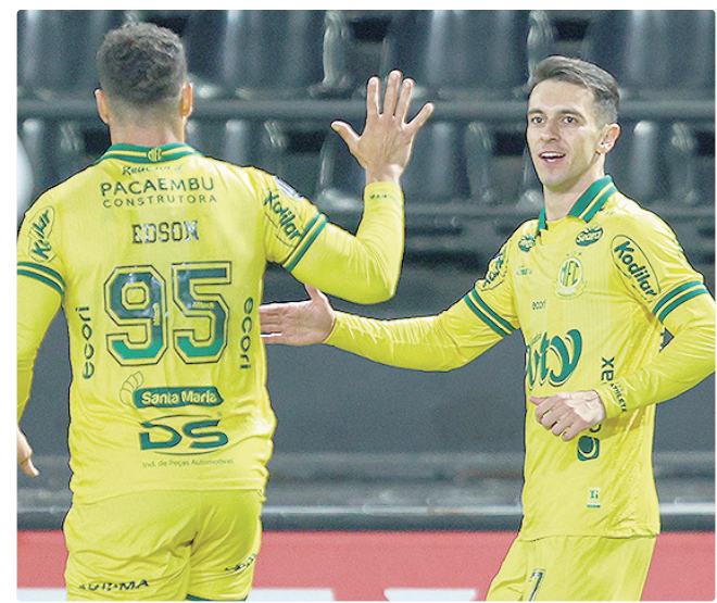
Mirassol conseguiu antecipadamente um feito histórico ao vencer

O terceiro brasileiro a entrar em ação foi o Cruzeiro, que empatou com o Boca Juniors (Argentina) por 1 a 0 no estádio La Bombonera, em Buenos Aires (Argentina). O resultado deixou a Raposa na liderança do Grupo D com oito pontos. A vice-liderança é dos argentinos, que têm sete pontos.