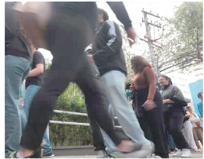
Projeção do MEC é de 70% dos alunos concluintes participando

O ministério informou que já estuda apoio de transporte e deslocamento para aqueles estudantes que precisarem fazer o exame em outras cidades. Com essas medidas, o MEC espera, pelo menos, que 70% dos concluintes das escolas públicas participem do Enem em 2026, consolidando o exame como parte importante da avaliação da educação básica.