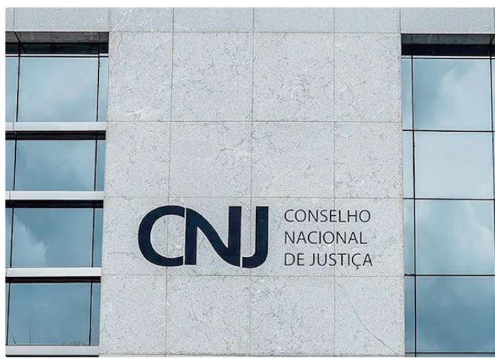
Decisão do CNJ reduz o prazo de execução para duas horas após bloqueio

Além da redução do tempo, o novo sistema aumentou a