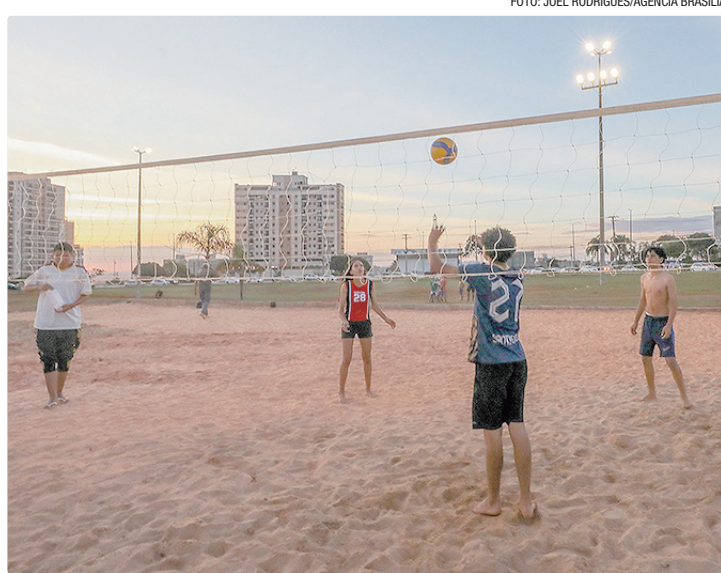
Iluminação com lâmpadas de LED teve investimento de R$ 160 mil

“A nossa população trabalha durante o dia e, muitas vezes, só consegue aproveitar esses espaços no período da