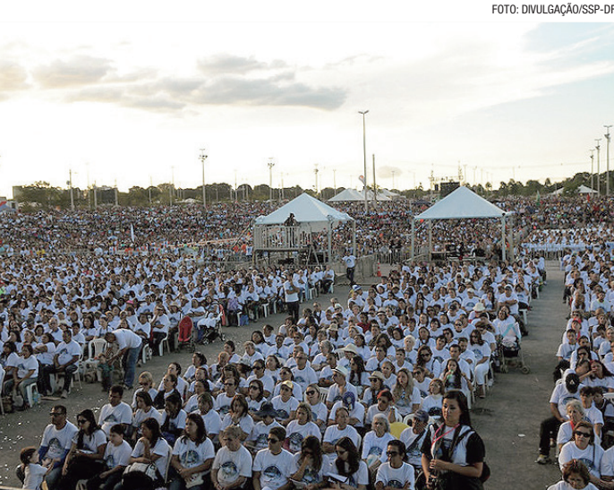
Um protocolo conjunto de segurança tem início nesta sexta-feira

Por isso, elaboramos o planejamento de forma inte-