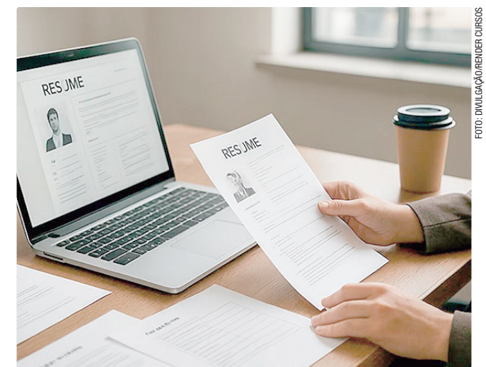
Maior remuneração é para Analista de RH, na Asa Norte: R$ 2,8 mil

Empregadores e empreendedores que desejem ofertar vagas ou utilizar o espaço das agências do trabalhador para as entrevistas podem se cadastrar pessoalmente nas unidades ou pelo e-mail gv@sedet.df.gov.br . Pode ser utilizado, ainda, o Canal do Empregador, no site da Secretaria de Desenvolvimento Econômico, Trabalho e Renda (Sedet).