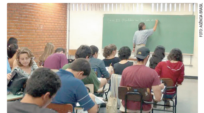
Entre todos os formandos do ano passado, 60% estudaram em EAD

Os resultados mostram que no total foram avaliados 1.127 cursos EAD, sendo 3.420 presenciais e outros 401 com menos de dois alunos e, por isso, estes últimos não tiveram conceito Enade. Entre os 4.547 cursos formação de professores avaliados, 56,8% alcançaram desempenho de menos 60% na prova, nos conceitos 3, 4 e 5, sendo que aproximadamente 31,9% estão classificados com notas mais altas (4 e 5).