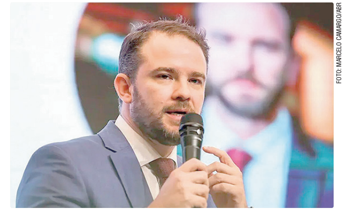
Durigan disse que a renegociação beneficia mais de um milhão