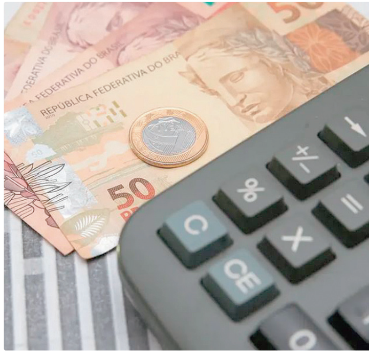
Neste lote, não haverá o pagamento a contribuintes sem prioridade

Receita Federal para tablets e smartphones. O recorde anterior tinha sido registrado no primeiro lote de 2025, que contemplou créditos de R$ 11 bilhões para 6,2 milhões