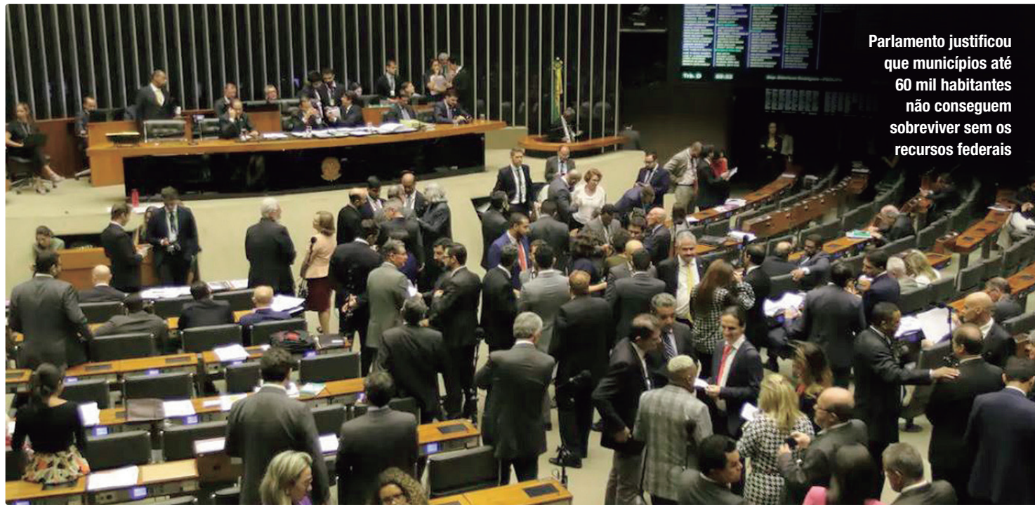
Parlamento justificou que municípios até 60 mil habitantes não conseguem sobreviver sem os recursos federais

Na justificativa do veto, o presidente Lula argumentou que a obrigatoriedade de adimplência fiscal e financeira para a celebração de transferências voluntárias está estabelecida na Lei de Responsabilidade Fiscal (Lei Complementar nº 101/2000), a qual define normas de finanças públicas destinadas à responsabilidade na gestão fiscal, com amparo no