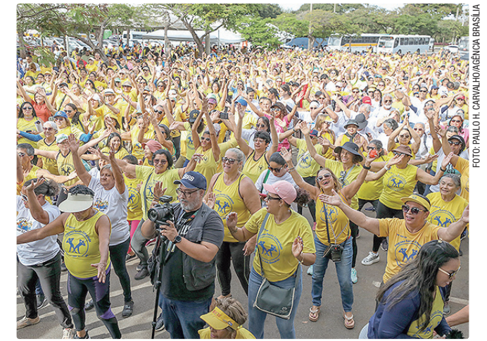
Evento mostrou a força do incentivo às atividades físicas no DF

Criado dentro da rede pública de ensino, o PGinQ incentiva a prática de atividade física como forma de cuidado com a saúde, prevenção de doenças associadas ao sedentarismo, bem-estar e qualidade de vida. As aulas são orientadas por professores de educação física da Secretaria de Educação e ocorrem em unidades escolares ou em espaços públicos próximos às escolas.