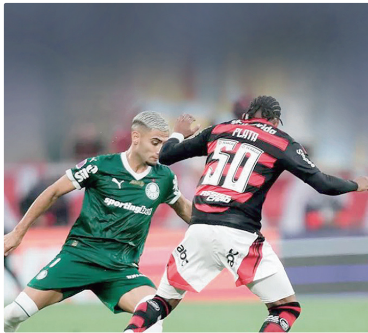
Duelo é considerado como o "Superclássico do Campeonato Brasileiro"

O momento das equipes pende para os cariocas, que venceram o Estudantes-ARG na última quarta-feira (20), pela CONMEBOL Libertadores, e estão garantidos nas oitavas de final da competição.