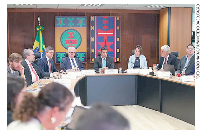
Muitas redes municipais não faziam nenhum processo seletivo