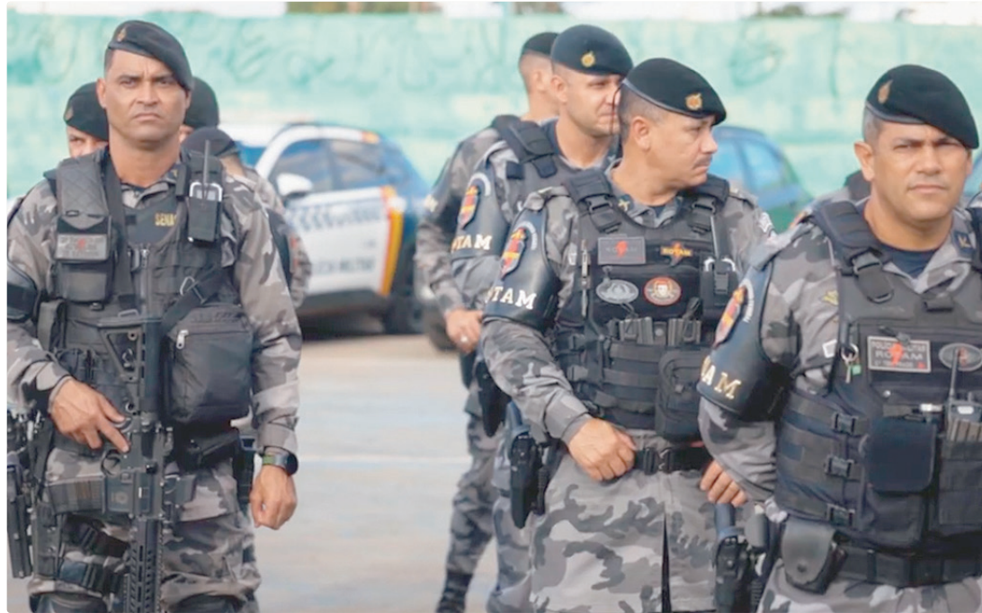
A ação, que atenderá 227 mil moradores, ocorre paralelamente à quarta edição do programa GDF na Sua Porta

A ação será coordenada pelo 11º Batalhão da PMDF, com