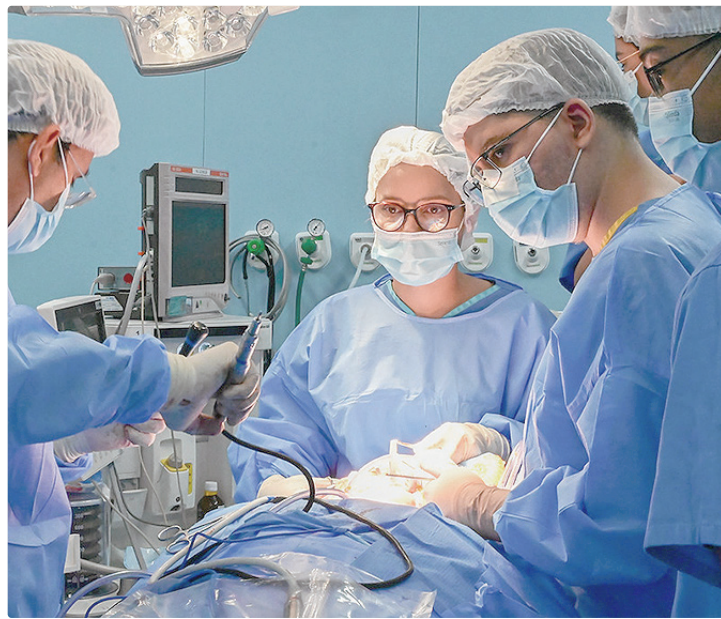
Uso correto de máscaras e roupas deve ser verificado nas salas cirúrgicas

A ação vem sendo reforçada nesta semana pelas equipes do centro cirúrgico do Hospital de Base, unidade administrada pelo Instituto de Gestão Estratégica de Saúde do Distrito Federal (IgesDF), principalmente devido à grande circulação