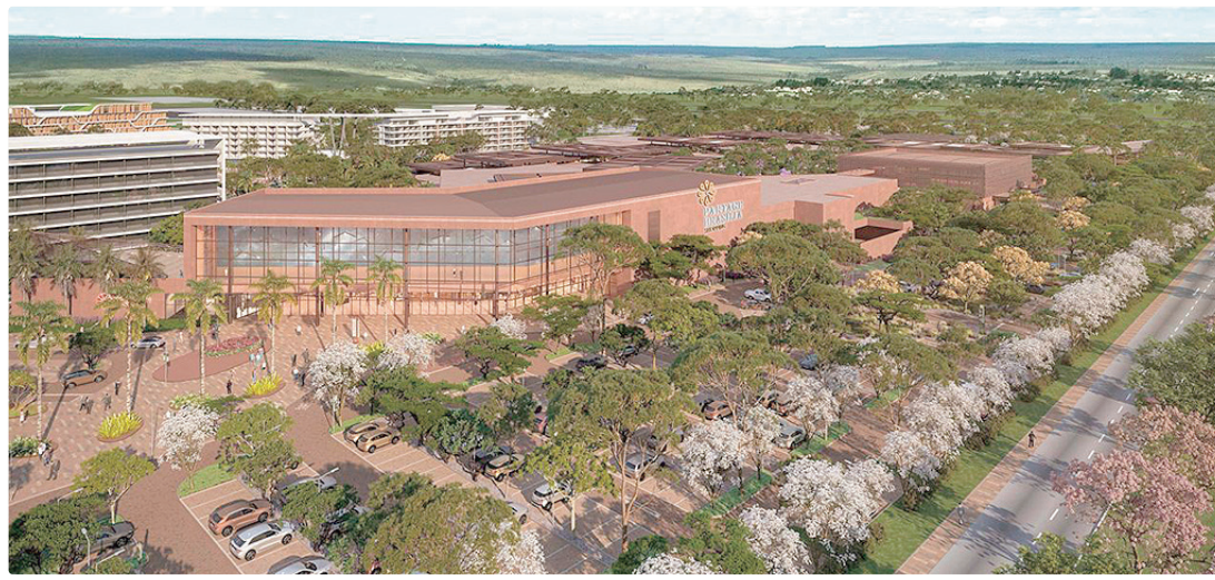
Nova expansão do Aeroporto JK terá 60 mil m² e vai receber investimentos da ordem de R$ 1,1 bilhão

Com mais de 60 mil metros quadrados de área construída, o shopping reunirá cerca de 130 lojas, incluindo sete grandes âncoras, além de academia da rede Cia Athletica, com mais de 3 mil metros quadra-