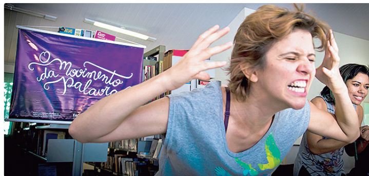
Arte, acessibilidade e pedagogia do corpo se encontram no projeto