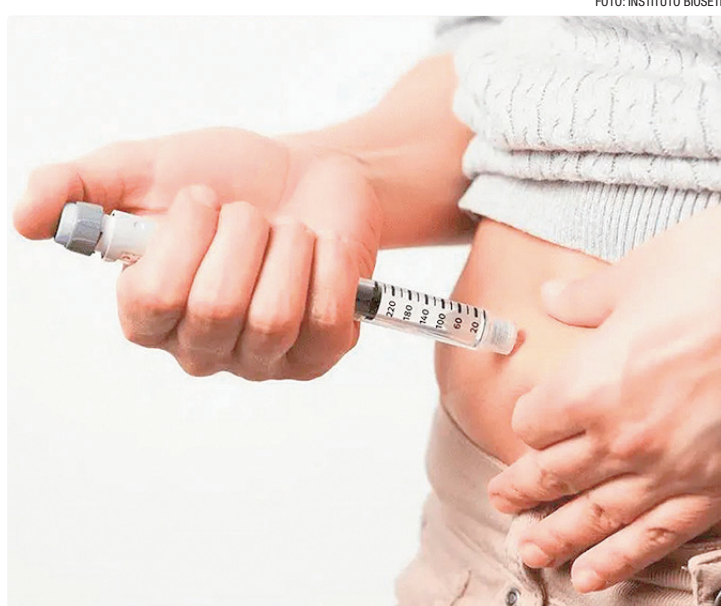
Sete em cada dez pacientes diabéticos dizem que doença afeta bem-estar

Além do Brasil, foram pesquisadas pessoas na Austrália, Áustria, Bélgica, Chile, Croácia, República Tcheca,