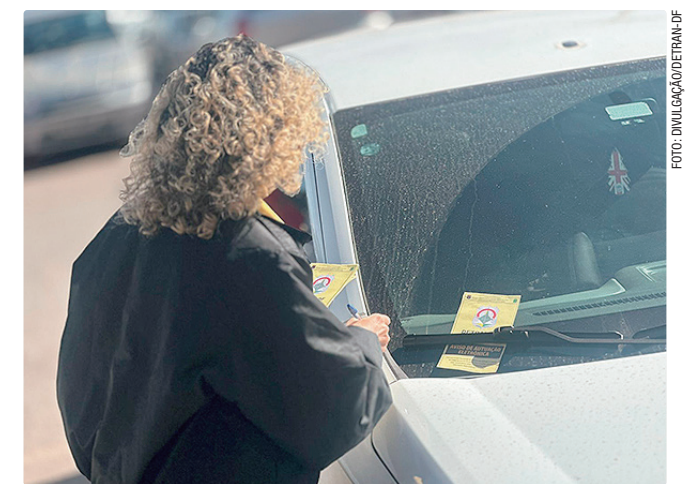
Ao todo, foram registradas 25 autuações por uso irregular de vaga

O uso indevido de vagas reservadas, sem a devida credencial, configura infração gravíssima, conforme o artigo 181, inciso XX, do CTB, sujeita à aplicação de multa de R$ 293,47 e à remoção do veículo.