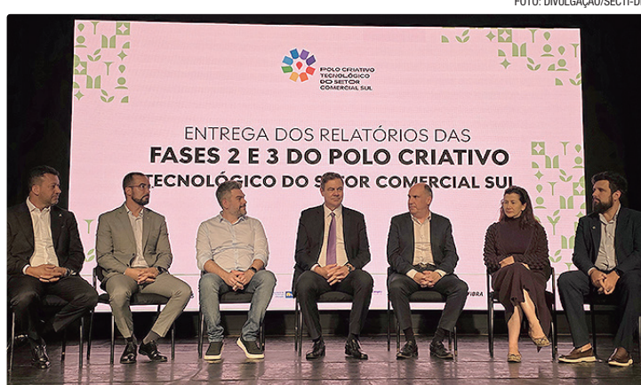
Documentos detalham o plano de implantação do Polo Criativo Tecnológico

Os documentos detalham o plano de implantação do Polo Criativo Tecnológico do SCS