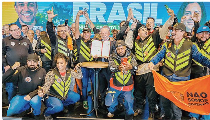
O programa Move Brasil foi lançado pelo presidente Lula em 19 de maio

A iniciativa faz parte do programa Move Brasil, lançado no dia 19 de maio, e os recursos vão ser repassados pelo Ministério da Fazenda ao