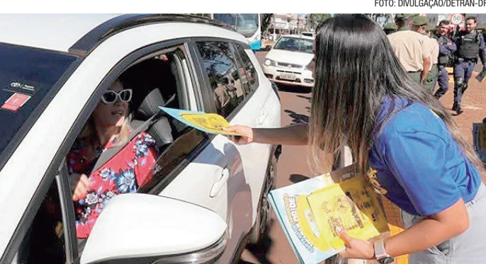
Evento do Detran-DF reunirá familiares, autoridades e especialistas

A programação fará homenagem aos familiares de vítimas de trânsito convidados