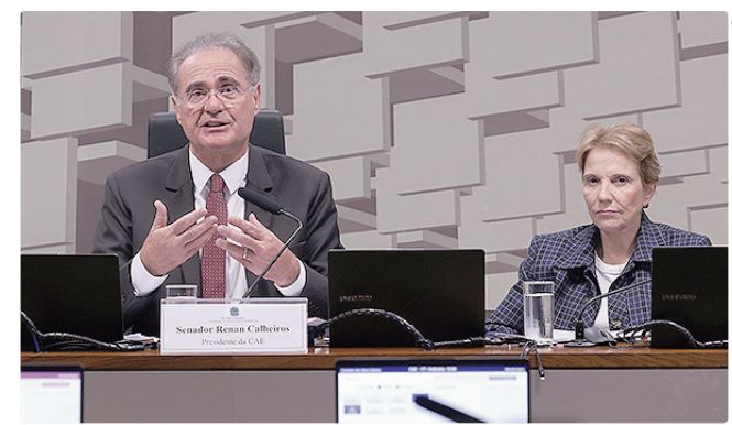
Segundo Calheiros, CAE do Senado retoma discussões nesta quarta

Segundo o líder do governo na Câmara, Paulo Pimenta (PT-RS), o Tesouro Nacional poderá utilizar diferentes fontes de recursos para custear a iniciativa. “O valor vai ser definido a partir do momento que nós definirmos quais são os critérios. Os critérios estão sendo debatidos”, afirmou o deputado. De acordo com Pimenta, ainda não há estimativa oficial do volume total de dívidas que poderá ser renegociado.