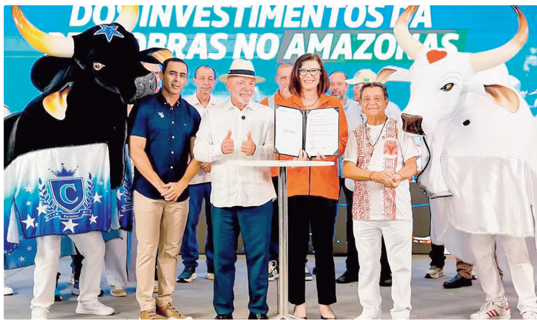
Lula em Manaus: “A Petrobras é a melhor empresa do mundo para fazer prospecção em águas profundas”

Uma nota técnica elaborada por pesquisadores do Centro