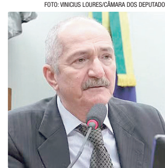
Aldo Rebelo reagiu publicamente à indicação de Joaquim Barbosa

A crise interna começou após a direção do DC indicar o nome do ex-presidente do Supremo Tribunal Federal (STF) Joaquim Barbosa como alternativa para disputar a Presidência da República no lugar de Rebelo, que havia sido anunciado anteriormente como pré-candidato. Rebelo reagiu publicamente à decisão, fazendo uma série de críticas