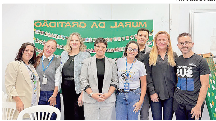
Equipe Ceilândia I conta com 47 enfermeiros e 97 técnicos de enfermagem

Segundo dados do painel epidemiológico do IgesDF, a unidade já soma 44.092 atendimentos neste ano, incluindo 8.732 assistências pediátricas. A média mensal supera os 8 mil atendimentos, reforçando