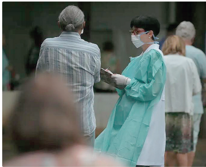
Pesquisa aborda mobilidade, hipertensão, e preocupação com a mulher

Entre os resultados há indicadores que revelam que fatores urbanos, sociais e estruturais têm papel decisivo na qualidade de vida da população idosa, mostrando que envelhecer no Brasil envolve desafios muito além da ausência de doenças. Um dos aspectos diz respeito à percepção do ambiente urbano: 42,7% dos idosos que vivem em áreas urbanas relatam medo de cair por causa de defeitos em calçadas, passeios ou vias públicas próximas de suas casas. O percentual expõe um problema estrutural que afeta direta-