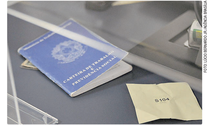
Candidatos devem ir a uma agência ou se cadastrar na CTPS Digital

Empregadores e empreendedores que desejem ofertar vagas ou utilizar o espaço das agências do trabalhador para as entrevistas podem se cadastrar pessoalmente nas unidades ou pelo e-mail gcv@sedet.def.gov.br. Pode ser utilizado, ainda, o Canal do Empregador, no site da Secretaria de Desenvolvimento Econômico, Trabalho e Renda (Sedet).