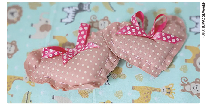
Repasse será automático em caso de atraso na análise do processo