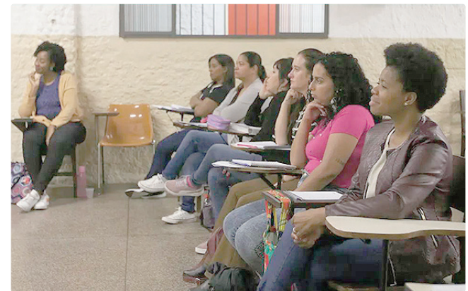
Cursinhos devem atender prioritariamente alunos da rede pública

Cada proposta contemplada receberá até R$ 185 mil. Os valores incluem, entre outras ações, o apoio financeiro para educadores, coordenadores e profissionais de apoio técnico-pedagógico e psicossocial; a aquisição de materiais.