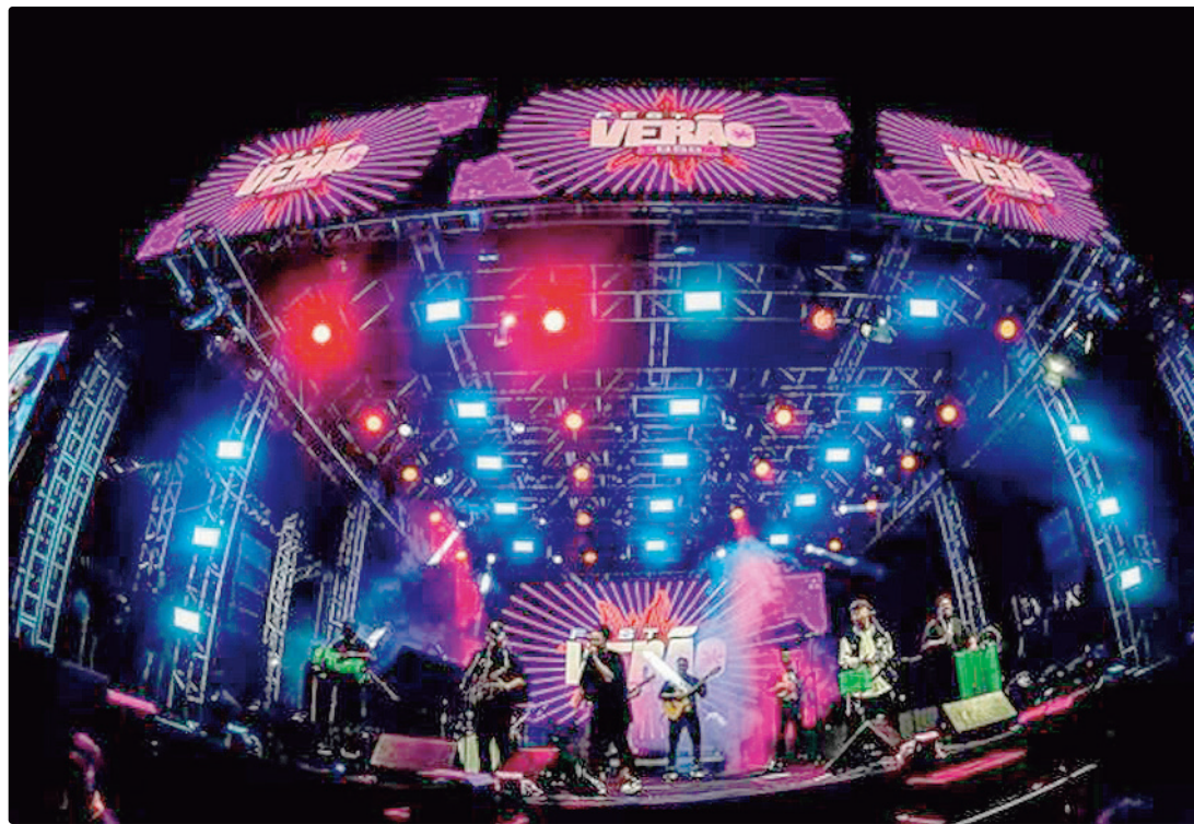
Evento nesta sexta (29) e sábado (30) terá shows nacionais e locais no Estacionamento do Centro Olímpico

“O Fest Verão BSB representa a força da cultura popular como instrumento de encontro, pertencimento e valorização das nossas tradições. Ao