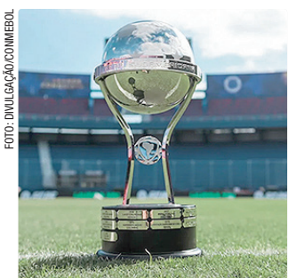
Conmebol sorteará os confrontos das oitavas nesta sexta-feira (29)

Times que ficaram em 2º lugar nos grupos da Sul-Americana: