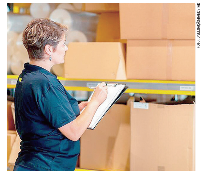
Maior número de vagas é o de estoquista, com 251 oportunidades

Já o cargo que oferece o maior número de vagas é o de estoquista, com 251 oportunidades. O salário oferecido é de R$ 1.800, além de benefícios. Para participar dos processos seletivos, basta cadastrar o currículo no aplicativo da Carteira