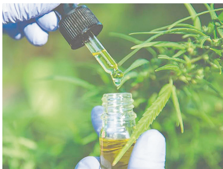
Mulheres de 55 a 65 anos representam 28% dos pacientes usuários

As mulheres mais velhas e empregadas são as principais consumidoras de cannabis medicinal importada no Brasil. Um levantamento inédito divulgado pela Blis Data em homenagem ao Mês das Mães comprova essa realidade entre as brasileiras que têm filhos. A Blis Data possui o maior banco de dados de pacientes em tratamento canábico da América Latina.