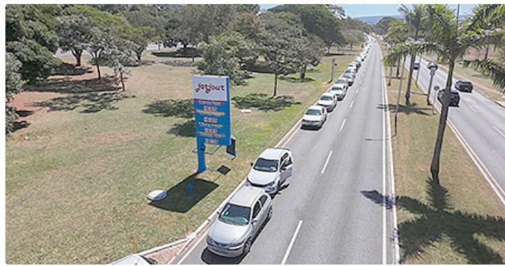
Em 2025, consumidores enfrentaram fila longa no posto Jarjour da Asa Norte

Participam da campanha lojas de rua, centros comerciais, postos de combustíveis, restaurantes e prestadores de serviços que aderiram voluntariamente ao movimento. Cada empresa aplica descontos proporcionais aos tributos incidentes sobre os produtos ou serviços oferecidos, permitindo que os consumidores visualizem, na prática, o impacto