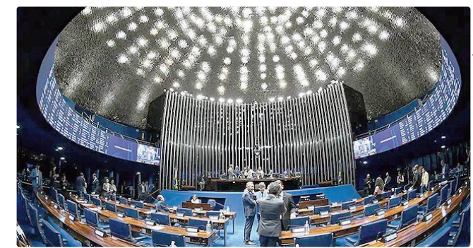
Proposta reduz alíquotas de FGTS e INSS para facilitar contratação

“Essa disposição não diz respeito ao mérito da criação de tal contrato ou à sua necessidade e adequação constitucional e jurídica. Outrossim, trata-se da percepção de que é matéria alheia ao projeto original e que não passou pela adequada discussão no âmbito do Senado Federal”, argumentou.