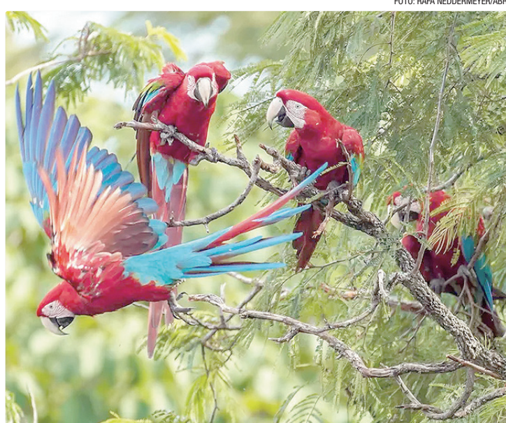
Em abril, turistas estrangeiros injetaram R$ 4,19 bi na economia brasileira

“Nossa atuação na busca por turistas de outros países tem sido intensa. Mais do que movimentar aeroportos, hotéis e res-