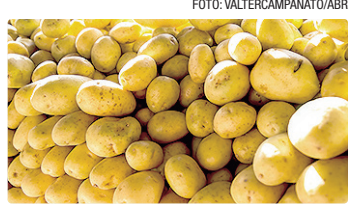
Batata-inglesa teve alta de 26,29%

Com isso, o indicador segue acima do teto da meta de inflação estabelecida pelo Conselho Monetário Nacional. Para 2026, a meta central é de 3%, com limite máximo de 4,5%. Desde o ano passado, o sistema passou a operar em modelo contínuo, no qual o cumprimento da meta é acom-