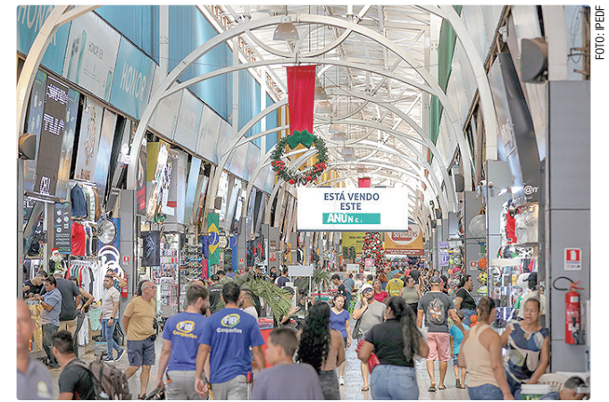
Canal incentiva consumidores a pleitear a garantia de seus direitos