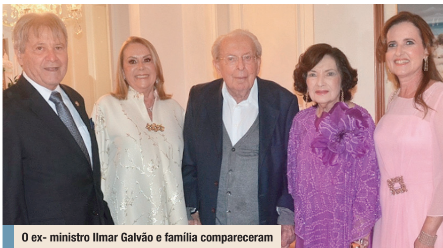
O ex- ministro Ilmar Galvão e família compareceram