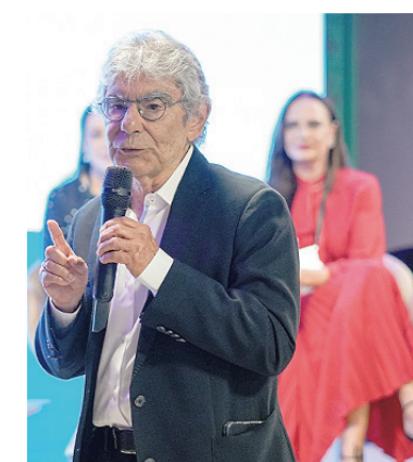
O ex-ministro Ayres Britto saudando a ex-modelo, agora respeitada ativista