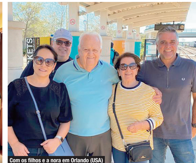
Com os filhos e a nora em Orlando (USA)