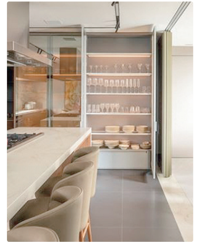
Aproveitando a parede da cozinha, próxima à mesa de jantar na varanda, os arquitetos projetaram uma cristaleira fechada com vidro reflecta

“Esses ambientes ganharam um caráter afetivo dentro das casas, pois são usados em momentos de pausa e encontro”, comentam os arquitetos. “Além de cafeteiras e adegas, podemos complementar o espaço com taças, garrafas, bandejas decorativas e iluminação embutida, que destacam os detalhes e valorizam o conjunto”. O segredo, segundo eles, está na proporção e na integração com o restante do mobiliário, para que o resultado seja elegante e coerente com o estilo da residência.