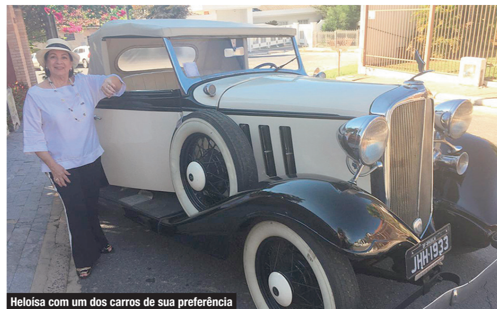
Heloísa com um dos carros de sua preferência