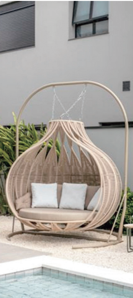
No dormitório (E) a cadeira de balanço se tornou uma gostosa área de leitura. À direita, a cadeira suspensa, perto da piscina, realizou o sonho do morador e virou um pequeno refúgio de lazer