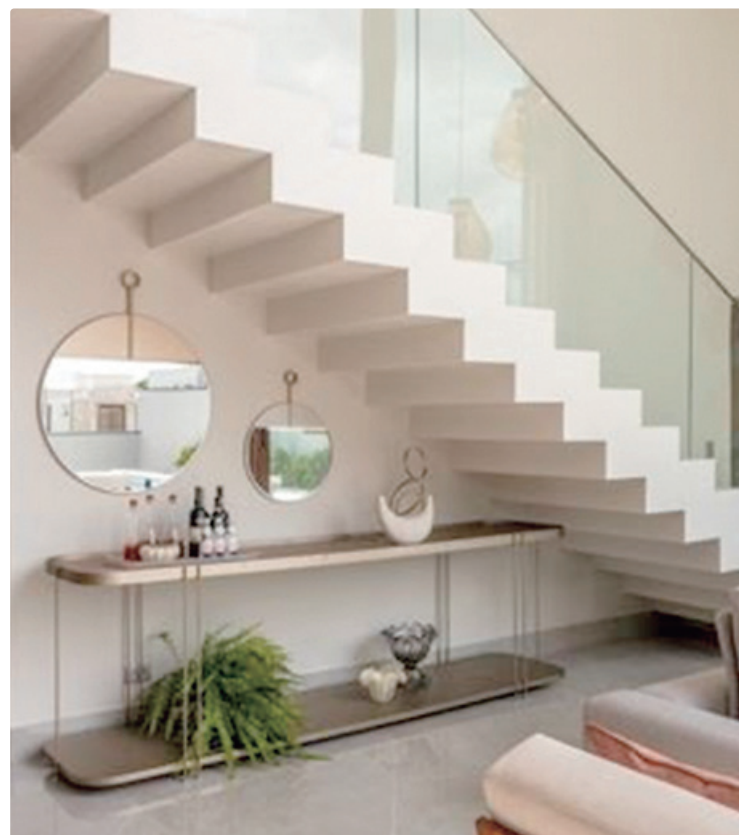
Aparadores sob a escada podem servir de apoio para objetos do dia a dia, como chaves e carteiras, ou integrar a decoração do ambiente

O espaço sob a escada é um dos mais versáteis. Para os profissionais, ele pode ganhar diferentes funções, desde bar, adega até apoio decorativo. “Gosto de propor o uso desse espaço para um bar discreto, com marcenaria sob medida e iluminação pontual, mas também pode receber um banco estofado e almofadas, criando uma área de apoio convidativa, especialmente se houver boa luz natural”, explica. Além da utilidade, os arquitetos lembram que esse tipo de intervenção traz movimento e sofisticação ao layout, criando continuidade visual e conectando pavimentos de forma harmônica.