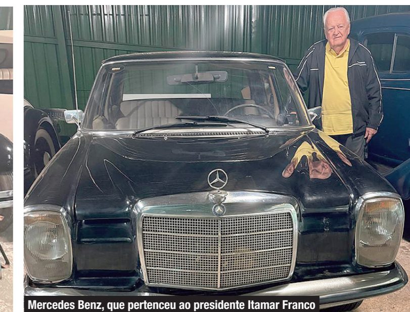
Mercedes Benz, que pertenceu ao presidente Itamar Franco