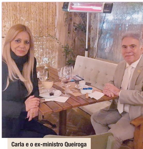
Carla e o ex-ministro Queiroga

O SPAZIO VILLA REGIA , sábado (30), recebe jornalistas e comunicadores para uma prévia exclusiva do L'Amour au Villa Regia, experiência criada para o Dia dos Namorados. Os convidados poderão conhecer a ambientação, o conceito e o menu autoral que será servido no dia 12 de junho.