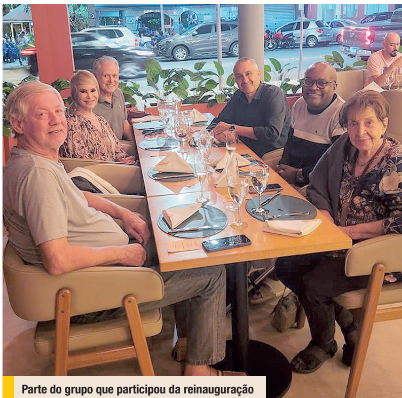
Parte do grupo que participou da reinauguração