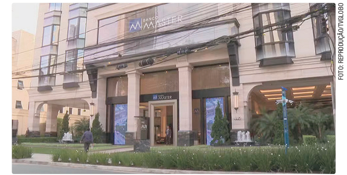
Decisão da Justiça permite que liquidante atue em nome do banco

O documento também cita a existência de apurações sobre o uso de recursos de investidores e depositantes, o que levou à intervenção do Banco Central.