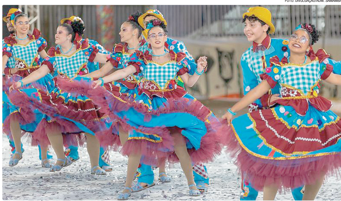
Primeira etapa classificatória vai de sexta (12) a domingo (14), no estacionamento da Castelo Forte, com entrada gratuita

Entre as quadrilhas participantes estão Sanfona Lascada, Si Bobiá a Gente Pimba, Sabugo de Milho, Segue o Fogo, Aquarela Nordestina, Elite do Cerrado, Arcanjos do Cerrado, Flor de Mamulengo, Bambolear, Vira e Mexe, Oxente Vixe, Filhos do Sertão, Papa Chico e Fuzuê.