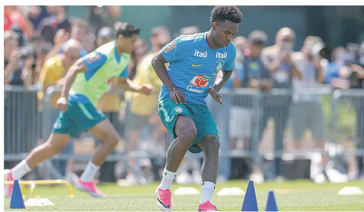
Entre as certezas de quem vai começar jogando está o atacante Vinicius Jr.

Dos 11 que iniciarão a campanha na Copa, muitos estão garantidos: caso não aconteçam lesões ou imprevistos, o goleiro Alisson, os zagueiros Marquinhos e Gabriel Magalhães, os volantes Casemiro e Bruno Guimarães e os atacantes Raphinha e Vinicius Jr. estarão perfilados para ouvir e cantar o Hino