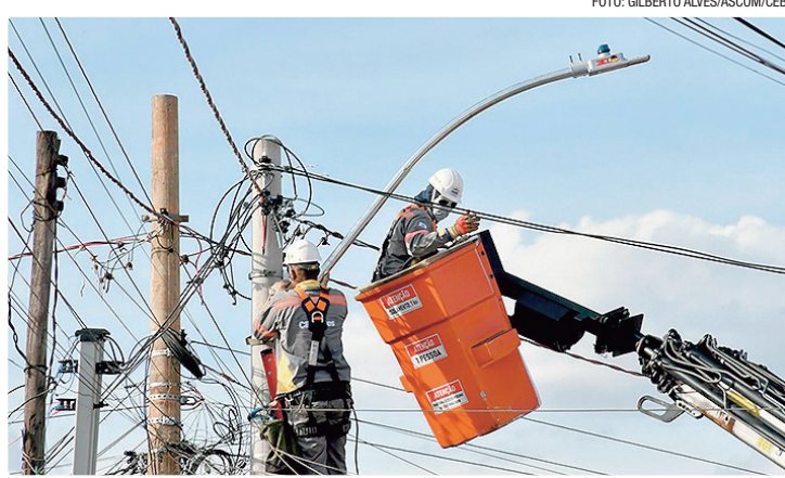
Moradores da região acompanham com expectativa a chegada da iluminação