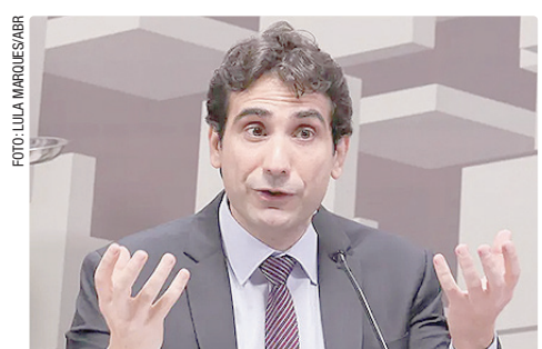
A PEC 65 é defendida pela diretoria do Banco Central, liderada pelo presidente Gabriel Galipolo

A PEC também é defendida pelos bancos privados. Eles entendem que o BC tem a obrigação de regular e fiscalizar. A Associação Brasileira de Bancos (ABBC) e a Federação Brasileira de Bancos (Febraban) têm se manifestado favoravelmente à proposta.