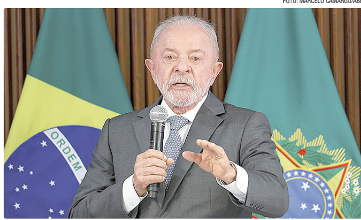
TCU alerta também sobre o acúmulo de recursos ociosos em fundos públicos

Segundo Zymler, a análise que embasou a autorização da garantia federal não demonstrou de forma suficiente a viabilidade econômico-financeira do plano de reestruturação da estatal nem