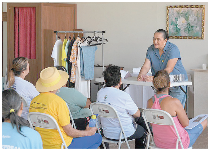
Projeto da Sejus-DF promove autonomia e organização doméstica em todo o DF