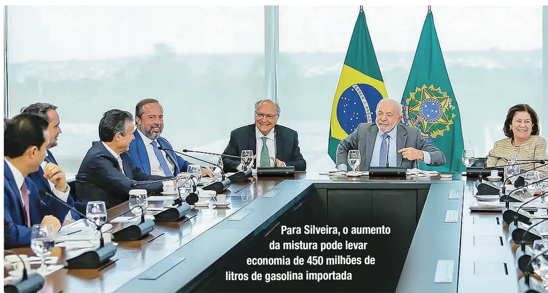
Para Silveira, o aumento da mistura pode levar economia de 450 milhões de litros de gasolina importada

De acordo com o ministro, a iniciativa faz parte da agenda de descarbonização e fortalecimento da segurança energética do país, impulsionada pela Lei Combustível do Futuro, que incentiva a produção e uso de combustíveis sustentáveis. Ele destacou que o aumento da mistura reduzirá a dependência externa do país, estimando