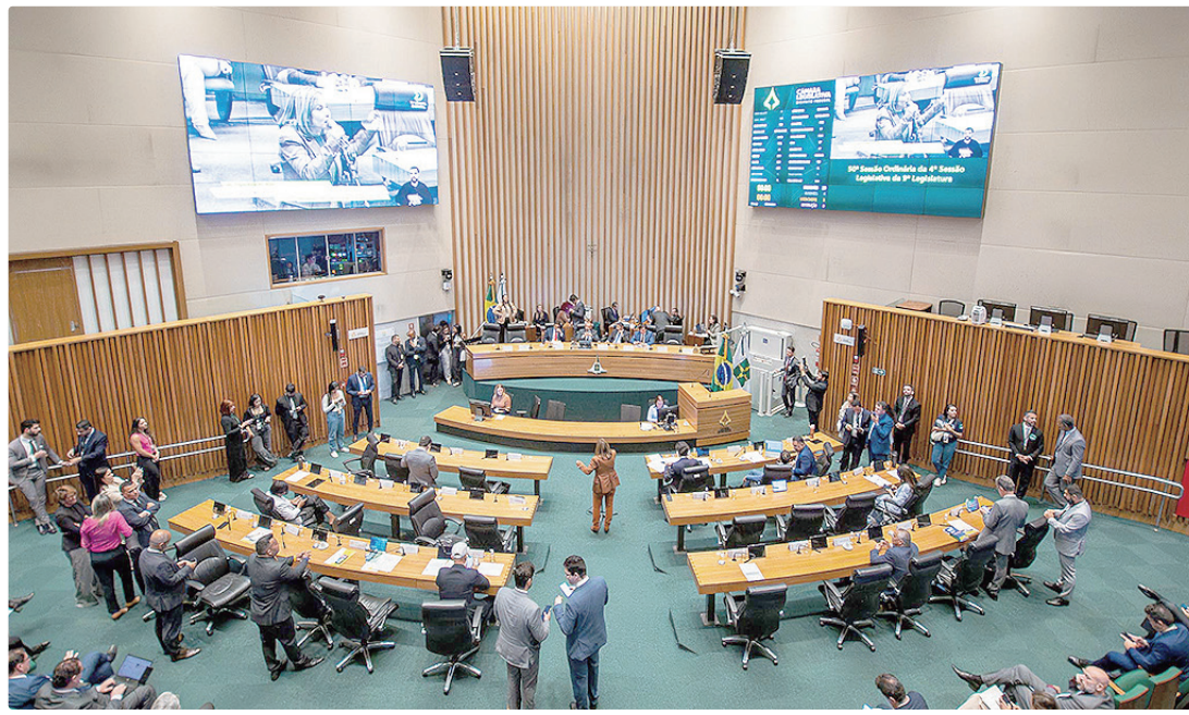
O Governo do DF justifica que a operação faz parte das medidas adotadas para recompor o patrimônio do BRB

O texto do PL aprovado estabelece as contragarantias que o GDF oferece para