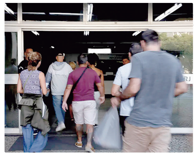
Inscrições para seleção do Sisu+ abrem na próxima semana

Em cada uma delas, o estudante poderá visualizar o curso escolhido, o local de oferta, a instituição de ensino, o turno, o grau, eventuais ações afirmativas próprias da instituição (quando houver) e as modalidades de concorrência nas quais estará inscrito.