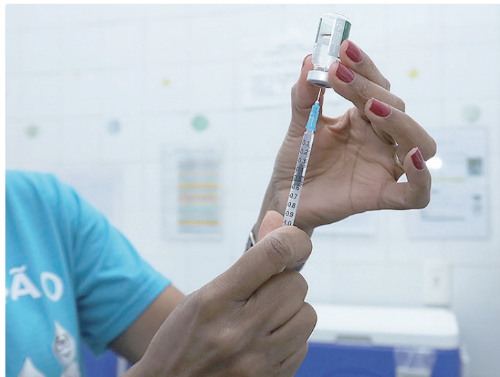
Distrito Federal é a unidade que se destaca por facilitar o acesso às vacinas

e envelhecer com saúde. A vacinação é importante para isso”, afirma a gerente da Rede de Frio Central da Secretaria de Saúde do Distrito Federal (SES-DF). Ela diz que, para fazer frente a esse desafio, servidores têm sido treinados para indicarem a vacina de maneira ampla. “Se uma mãe, um pai, uma avó ou um avô leva uma criança para vacinar, também é importante verificar a situação vacinal do responsável”, esclarece.