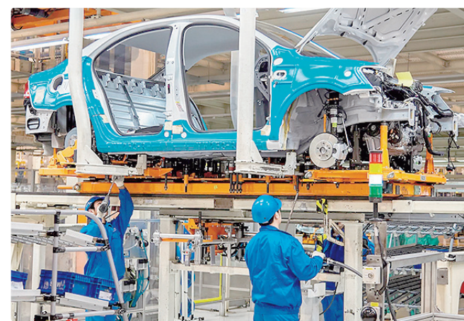
O posto com a remuneração mais alta é o de montador de veículos

Empregadores e empreendedores que desejem ofertar vagas ou utilizar o espaço das agências do trabalhador para as entrevistas podem se cadastrar pessoalmente nas unidades ou pelo e-mail gcv@se . Pode ser utilizado, ainda, o Canal do Empregador, no site da Secretaria de Desenvolvimento Econômico, Trabalho e Renda (Sedet).