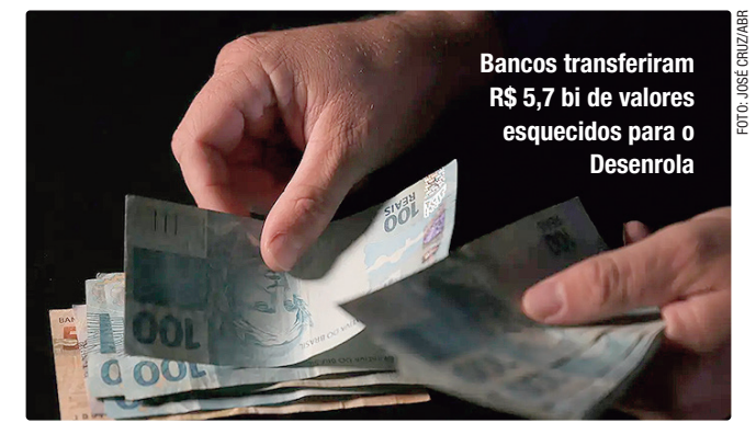
Bancos transferiram R$ 5,7 bi de valores esquecidos para o Desenrola

Com a ferramenta, o cidadão não precisará consultar o sistema periodicamente nem registrar manualmente a solicitação de cada valor que existe em seu nome.