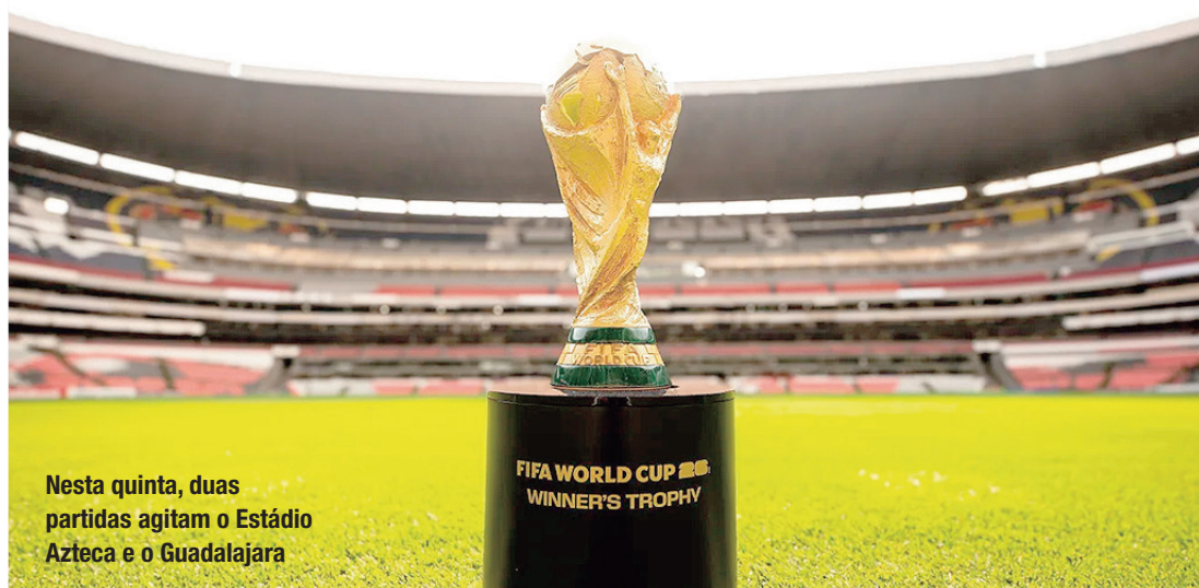
Nesta quinta, duas partidas agitam o Estádio Azteca e o Guadalajara

Shakira e o cantor nigeriano Burna Boy são responsáveis pelo hit "Dai Dai", música oficial da atual edição do torneio. Essa será