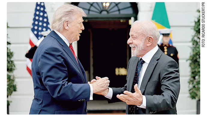
Último encontro entre Trump e Lula foi na Casa Branca, em 7 de maio

O Brasil não faz parte do G7, mas, a exemplo de edições anteriores, Lula foi convidado pelo anfitrião do encontro – neste ano, o presidente da França, Emmanuel Macron. O encontro acontece na próxima semana.