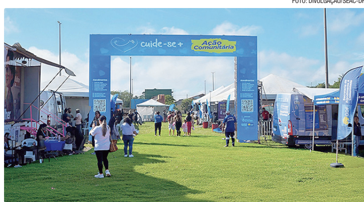
Ação reunirá vários órgãos do GDF, das 9h às 13h, na Praça Central do Inkra 8

A iniciativa tem como objetivo ampliar o acesso da população aos serviços públicos, concentrando em um único espaço atendimentos essenciais nas áreas de saúde, cidadania, assistência social, empregabilidade e orientação jurídica. A população poderá receber vacinas e aferir a pressão arterial com equipes da Secretaria de Saúde (SES-DF), além de obter orientações odontológicas. O Sesc-DF também estará presente com atendimentos e orientações à comunidade.