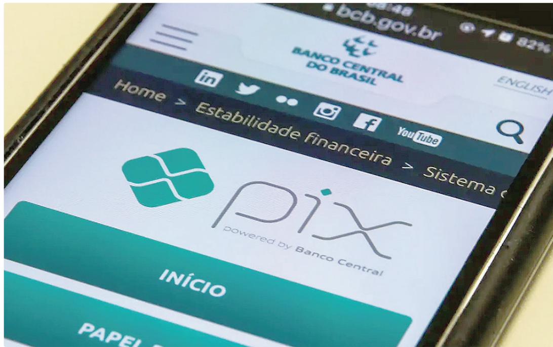
O reconhecimento do PIX pelo Instituto Nacional da Propriedade Industrial deve ocorrer no próximo dia 16, pela RPI

De acordo com o ministério, a publicação com o reconhecimento ocorrerá na próxima (16), na Revista da Propriedade