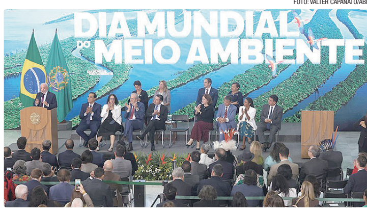
Decretos foram assinados pelo presidente Lula durante evento no Planalto

“Pela primeira vez, a gente está saindo na frente, na luta para combater as possíveis queimadas que virão, porque a perspectiva é de que o El Niño vai ser muito violento, e de que a gente pode ter mais desastres climáticos. Pela primeira vez, nós estamos preparados antecipadamente para enfrentar essa situação”, frisou Lula. Para o presidente, o evento no Palácio