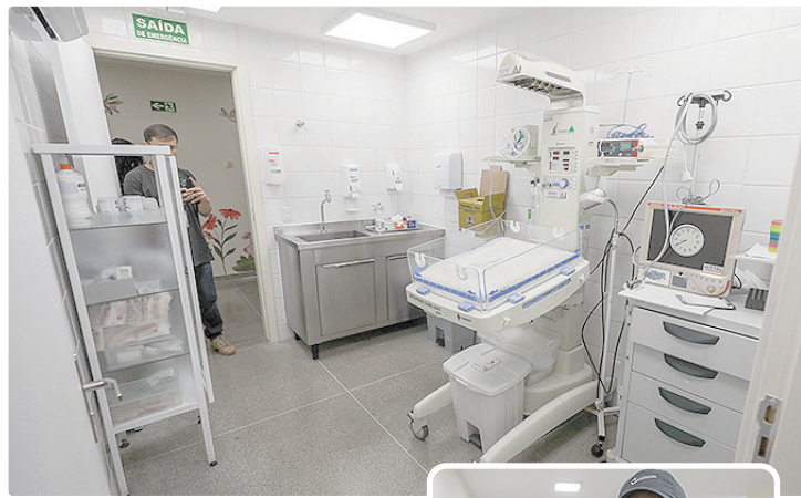
Com a reforma, a unidade passa a oferecer ambiente mais acolhedor

Toda a readequação da Ucin Canguru foi desenhada em conformidade com a Portaria nº 930/2012 do Ministério da Saúde. A nova estrutura física foi planejada para possibilitar e incentivar a permanência da mãe ao lado do recém-nascido integralmente. A garantia desse contato ininter-