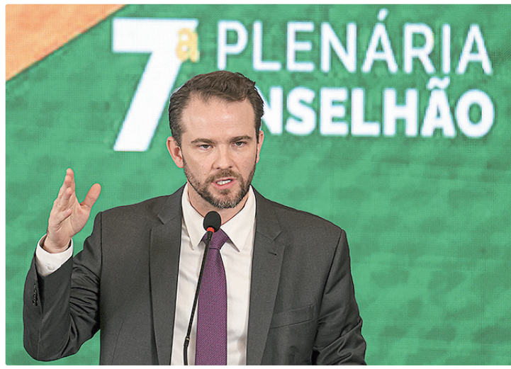
Durigan concentra esforços para frear pacote na Câmara dos Deputados

• Piso de Médicos e Dentistas (PL 1365/22): cerca de R$ 500 bilhões para o governo federal em dez anos, além de impacto adicional para as prefeituras.