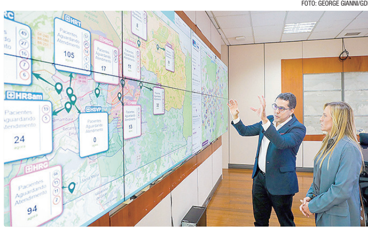
Ferramenta acompanha, em tempo real, dados de consultas e exames

Segundo a chefe do Executivo, a utilização da tecnologia