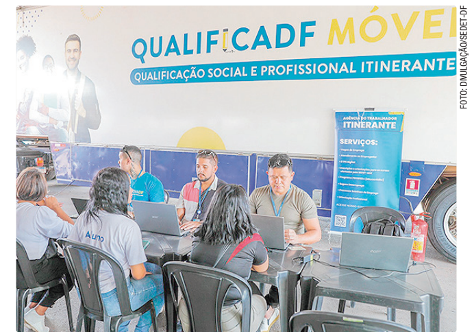
Interessados podem fazer a inscrição até o dia 19 deste mês

Inscrições: https://app.setrab.df.gov.br/ acesso Edital: www.agenciabrasilia.df.gov.br/documents/d/guest/ edital-do-qualificadf-movel-pdf .