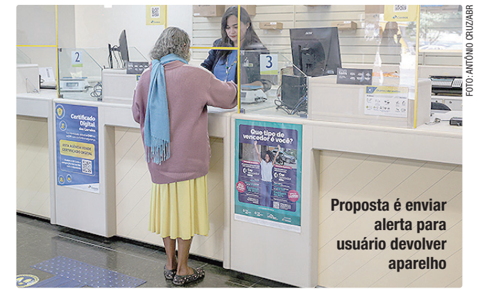
Proposta é enviar alerta para usuário devolver aparelho

O presidente fez críticas à reação do mercado financeiro diante das metas fiscais do governo. “Se a gente tiver um déficit de 0,20% vai cair o mundo.”