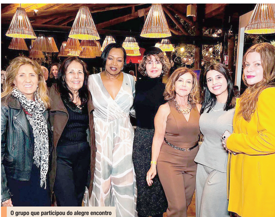
O grupo que participou do alegre encontro