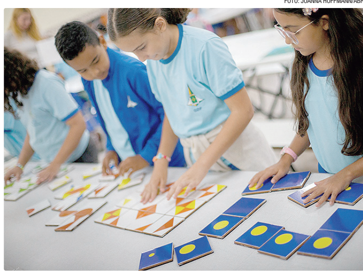
Peças ornamentam 10 bancos em concreto que ficarão no Parque Nacional