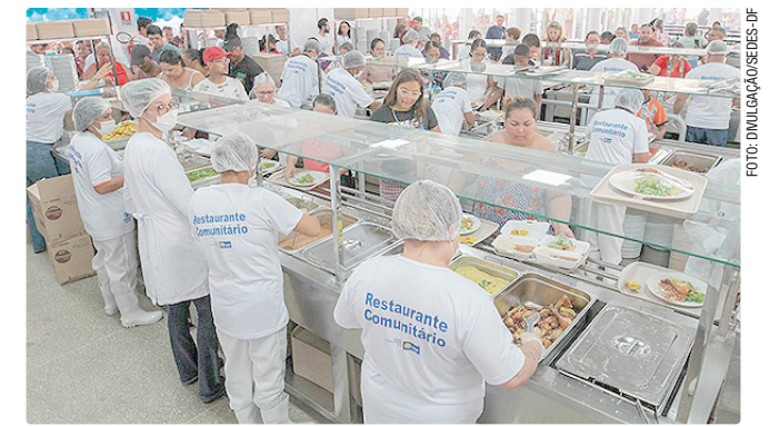
Medida garantirá acesso às refeições durante paralisação dos terceirizados

Dessa forma, não é responsabilidade do Governo do Distrito Federal (GDF) a eventual inadimplência da empresa com o pagamento dos salários e demais obrigações trabalhistas dos funcionários terceirizados. Após relatos de possíveis irregularidades, a Sedes-DF instaurou imediatamente processo administrativo para apurar os fatos e avaliar as medidas cabíveis, incluindo a eventual rescisão contratual.