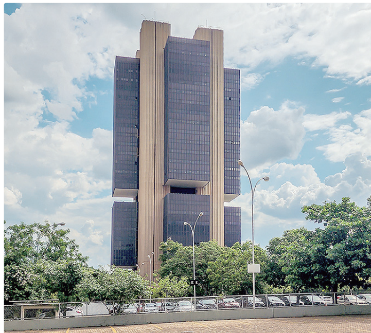
Previsão do mercado para a inflação passou de 5,11% para 5,3% este ano

O Copom faz, nesta semana, nesta terça (16) e quarta (17), nova reunião para decidir sobre a Selic e a previsão do mercado financeiro é que ela seja mantida em 14,5% ao ano neste encontro. Na última reunião, em abril, por unanimidade, o colegiado reduziu a Selic em 0,25 ponto percentual, pela segunda vez seguida, apesar das tensões em torno da guerra no Oriente Médio. A reu-