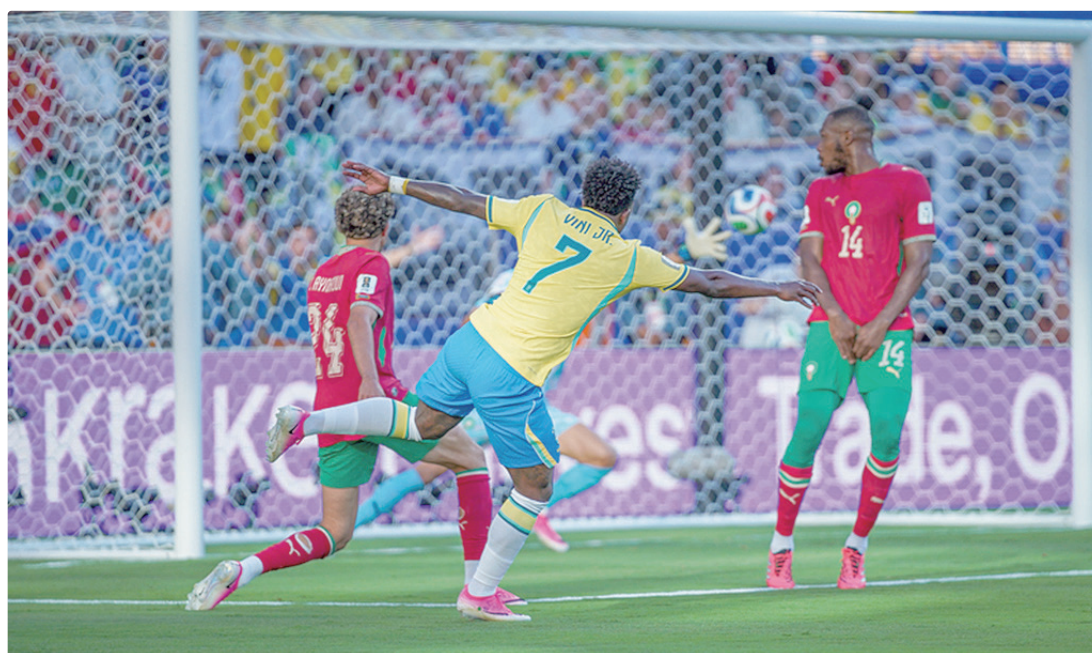
Vini Jr. marcou um gol contra a equipe do Marrocos, mas o Brasil não conseguiu sair da igualdade: 1 x 1

Uma boa e larga vitória sobre o Haiti pode ser crucial para a definição do primeiro colocado da chave. A Escócia, por exemplo, perdeu a chance ao vencer por apenas 1 a 0 no sábado (13).