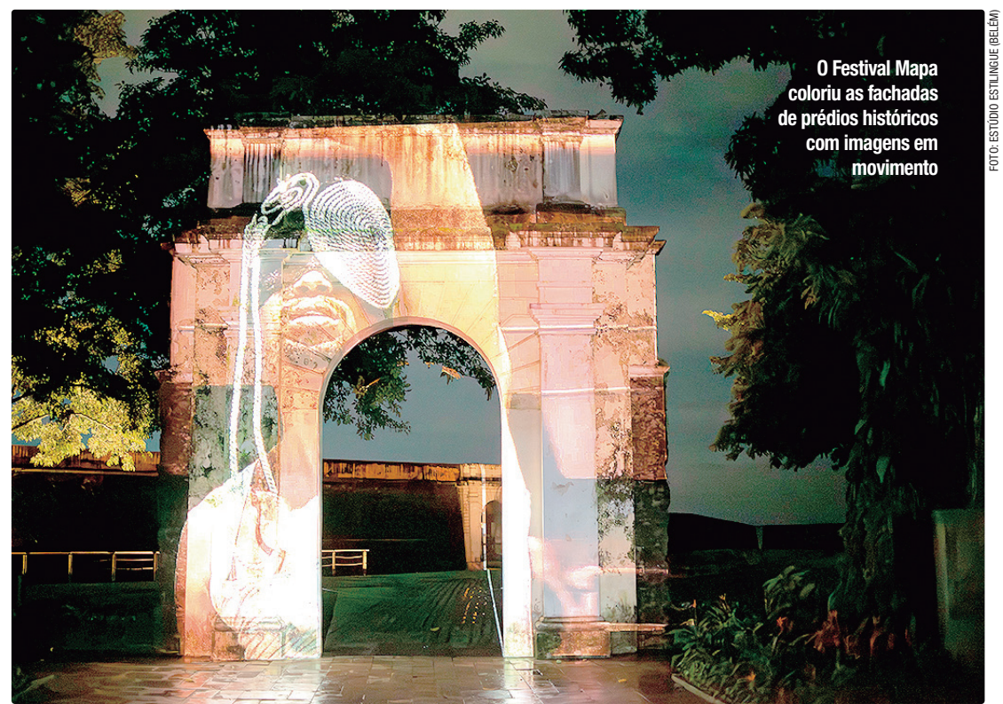
O Festival Mapa coloriu as fachadas de prédios históricos com imagens em movimento

“O Mapa nasceu como um programa curatorial, que entende a videoarte como uma linguagem livre, acessível e descentralizada. Diferente do cinema tradicional, que exige grandes estruturas, orçamentos robustos e múltiplas equipes técnicas, a videoarte expande o campo de expressões. Com um celular na mão e uma ideia