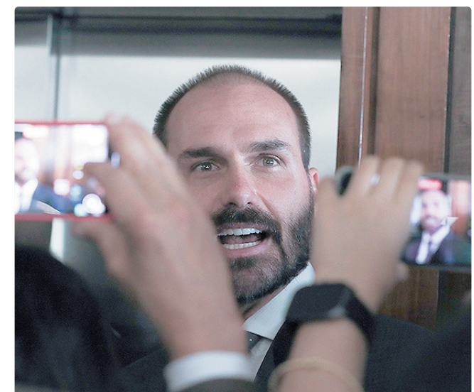
Moraes negou pedido da defesa de Eduardo para adiar sessão

Outro ponto de destaque é a definição de parâmetros mínimos de qualidade para os sistemas de transporte público, incluindo critérios como regularidade, pontualidade, acessibilidade, segurança, conforto e satisfação dos passageiros. O texto também prevê que a remuneração das operadoras possa ser vinculada ao desempenho e à qualidade do serviço prestado.