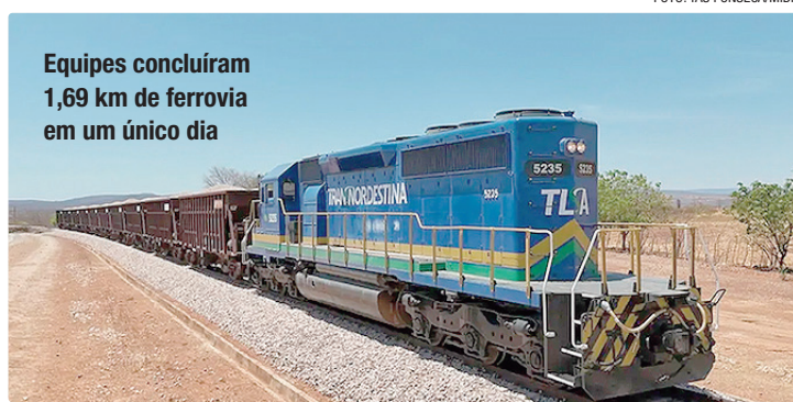
Equipes concluíram 1,69 km de ferrovia em um único dia

Segundo o Ministério da Integração e do Desenvolvimento Regional, a obra já tem mais 100 quilômetros de ferrovia concluída, de um total de mais de 1.200 quilômetros de malha ferroviária. Atualmente,