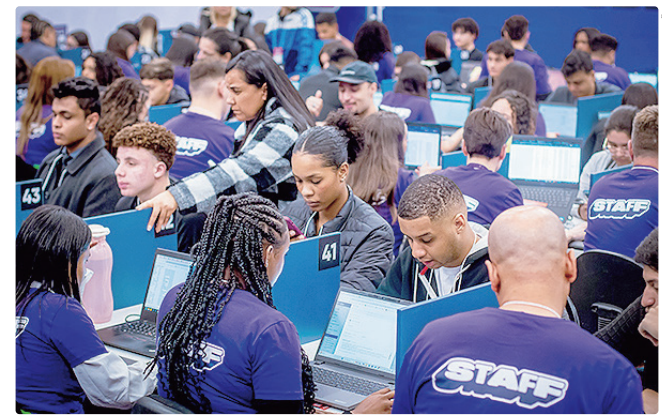
São 492 vagas de estágio e 96 de aprendizagem em diversas áreas

Em âmbito nacional, o Centro de Integração Empresa-Escola – CIEE oferta 6,4 mil vagas nesta semana. As principais áreas contratando são Administração, Educação, Direito e Contabilidade, com maior oferta de vagas nos estados de São Paulo, Distrito Federal, Piauí e Bahia. As inscrições são gratuitas e devem ser realizadas pelo portal www.ciee.org.br ou presencialmente na sede do CIEE-DF, localizada na EQSW 304/504, no Sudoeste.