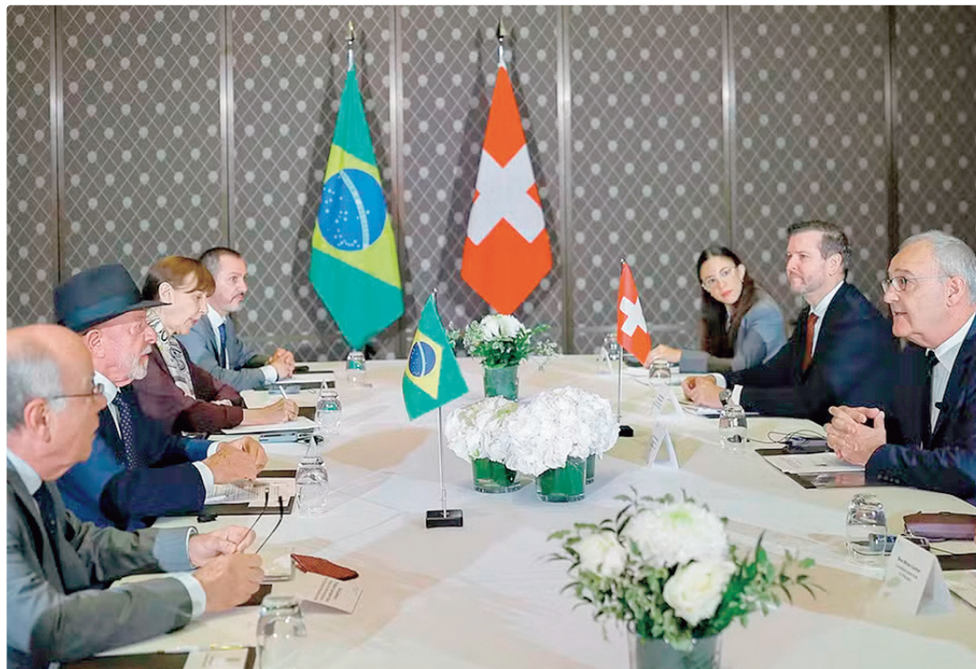
Mesmo sem estar na agenda, governo brasileiro espera conseguir um encontro entre Lula e Donald Trump (EUA)

A proposta altera a Lei Antirracismo para incluir os chamados atos de misoginia, definidos como "a prática, a indução ou a incitação de menosprezo ou discriminação contra a mulher, que promova violência, negue sua