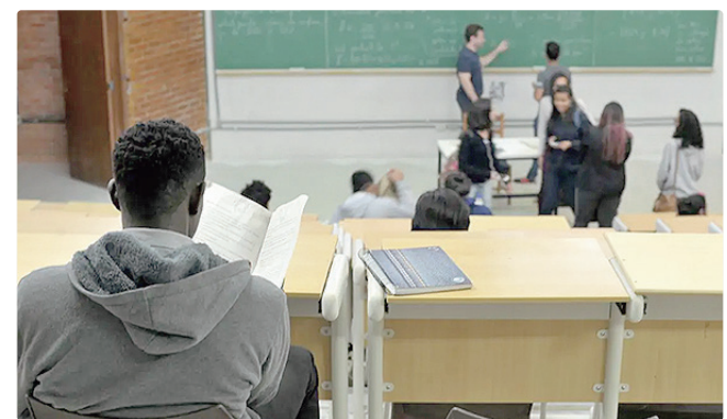
Processo dever ser feito pelo endereço fiesgestao.mec.gov.br

Entre as sanções, está a suspensão da possibilidade de celebrar novos contratos do Fundo de Financiamento Estudantil (Fies) e em outros programas federais, como o Programa Universidade para Todos (Prouni).