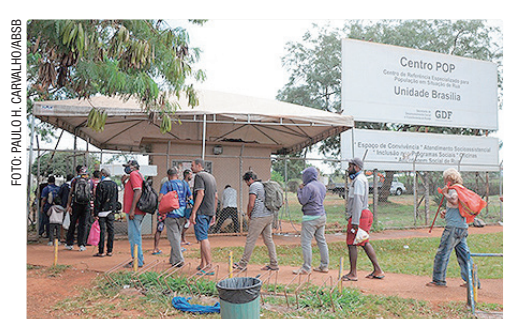
Reunião discutiu cadastro integrado e projeto de acolhimento humanizado com internação involuntária em casos previstos em lei