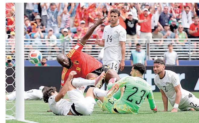
Seleção do Egito segue sem vencer em uma partida de Copa do Mundo

Egito segue sem vitória em Copa do Mundo. Apesar de ser a maior campeã da Copa Africana de Nações, com sete títulos continentais, a seleção comandada por Hossam Hassan agora acumula três empates e cinco derrotas em quatro participações no Mundial - 1934, 1990, 2018 e 2026. Na próxima rodada, a Bélgica encara o Irã, em Los Angeles, no domingo (21). No mesmo dia, em Vancouver (Canadá), o Egito enfrenta a Nova Zelândia.