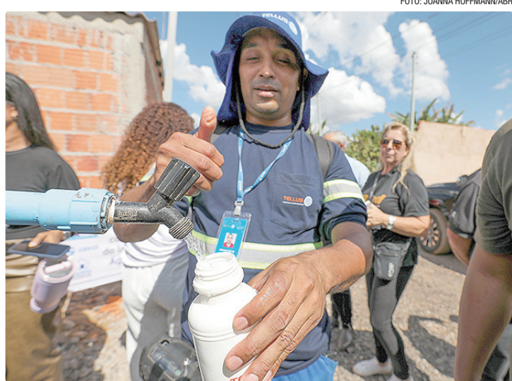
Obra no Terra Nova tem 3,7 km de rede de distribuição e 349 ligações domiciliares

de serviço de toda a iluminação pública aqui do Terra Nova, para vocês chegarem em casa à noite e não ficarem no escuro. Nós queremos trazer para cá também o esgoto, para beneficiar toda essa região. A parte fundiária está sendo tratada pela administração”, anunciou a governadora.