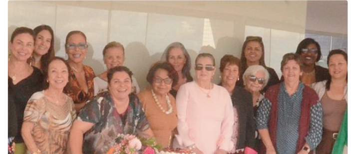
Parte das amigas que compareceram