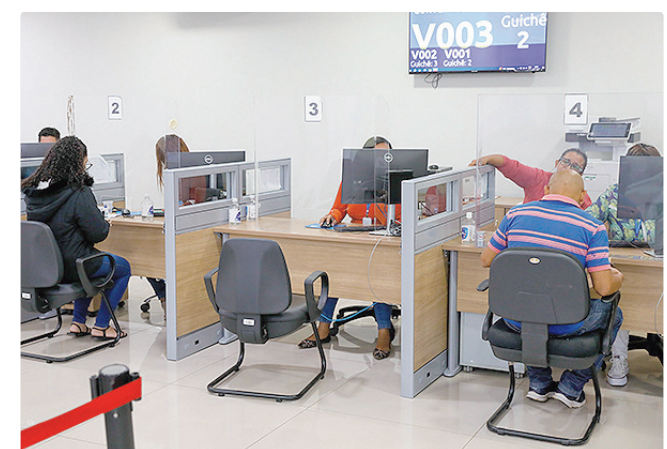
Salários chegam a R$ 6,9 mil, com vagas em diversas áreas e regiões

Empregadores e empreendedores que desejem ofertar vagas ou utilizar o espaço das agências do trabalhador para as entrevistas podem se cadastrar pessoalmente nas unidades ou pelo e-mail gcv@sedet.df.gov.br . Pode ser utilizado, ainda, o Canal do Empregador, no site da Secretaria de Desenvolvimento Econômico, Trabalho e Renda (Sedet).