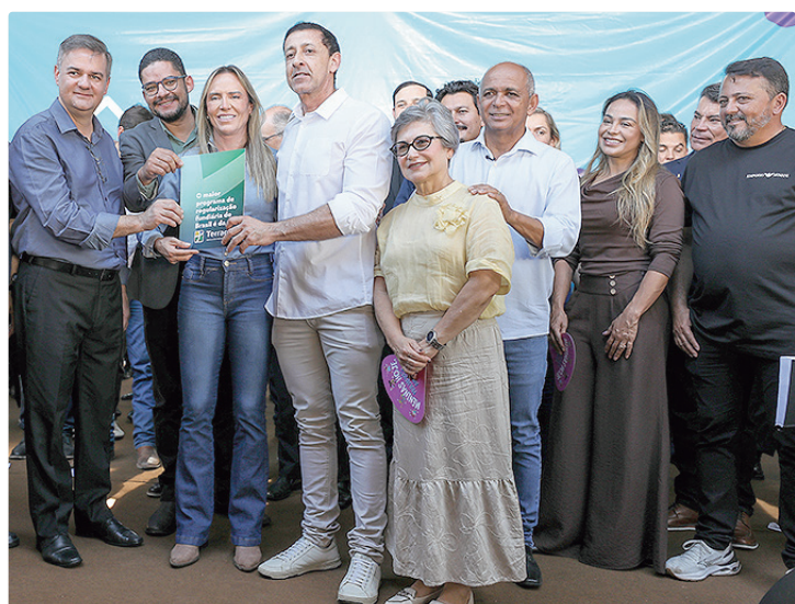
Celina Leão participou da abertura do evento, no Salão de Múltiplas Funções

Em Planaltina, o pacote vai de obras de drenagem, calçadas e recuperação asfáltica a ações de lazer, esporte, iluminação, transporte e saneamento. Entre os serviços previstos estão a instalação de 13 pontos do programa De Cara Nova, dois papa-lixos, dois