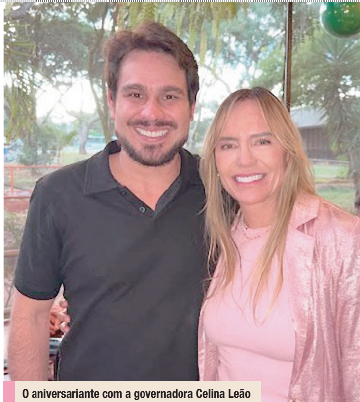
O aniversariante com a governadora Celina Leão

Dia de energia e boas oportunidades! Aproveite para brilhar nos estudos, fechar negócios e aumentar sua rede de contatos com sua inteligência e simpatia. Os contatinhos estão quentinhos e o amor segue de forma harmônica. Mantenha-se aberto às novas conexões e boas surpresas no amor. Cor: CEREJA Palpite: 09, 19, 18.