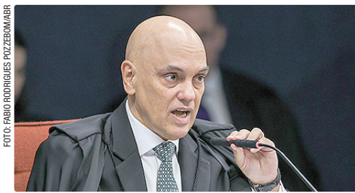
AGU afirma que decisões do STF não podem ser revistas por tribunais estrangeiros

Segundo a AGU, como a ação discute ato jurisdicional praticado por ministro do STF, órgão de cúpula do Poder Judiciário brasileiro, trata-se de ato de soberania estatal. Por isso, o caso estaria protegido pela imunidade de jurisdição, sem que houvesse exceção legal capaz de autorizar a continuidade do processo nos Estados Unidos.