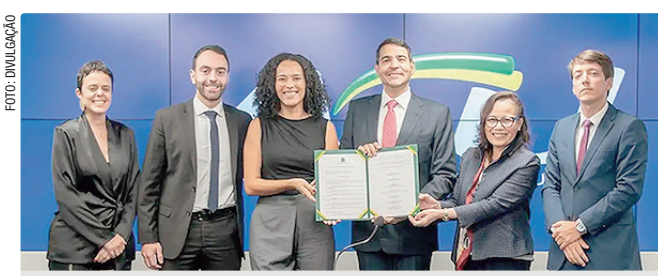
Jorge Messias defendeu acordo como legado contra injustiças

Ao assinar o acordo, o advogado-geral da União, Jorge Messias, defendeu uma “profunda reflexão” sobre o papel das bancas de heteroidentificação. “Ficarão este legado para que injustiças não ocorram mais. O Estado não pode ter compromisso com o erro”, afirmou.