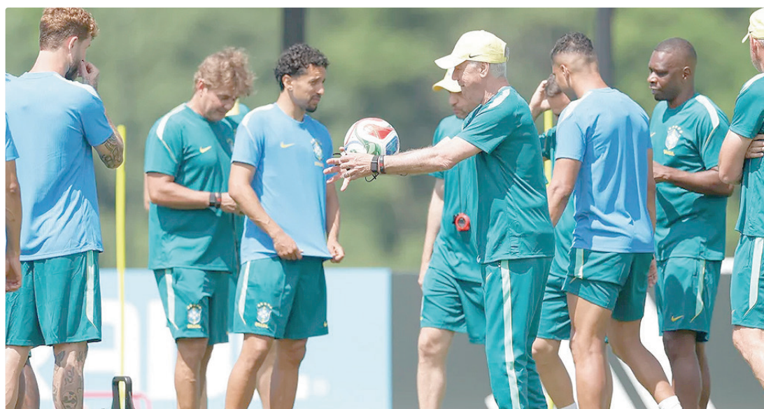
Neymar não treina na segunda e agora é dúvida para o terceiro jogo do Brasil na fase de grupos contra a Escócia

Os jogadores trabalharam na parte interna do centro de tre-