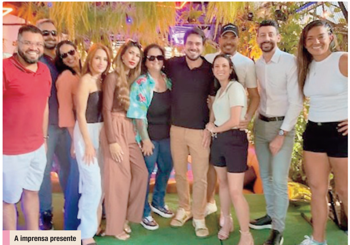
A imprensa presente

O clima descontraído contou com a presença de personalidades da cena social e política da capital. Entre elas a governadora Celina Leão, a atleta Lana Cristina, além de Felipe Pezzoni, vocalista da Banda Eva, e Delão, vocalista do grupo Fica Comigo. O encontro também serviu como esquentado para a tradicional festa Fica Comigo, que desembarca em edição especial no Na Praia Festival, no próximo dia 19 de junho.