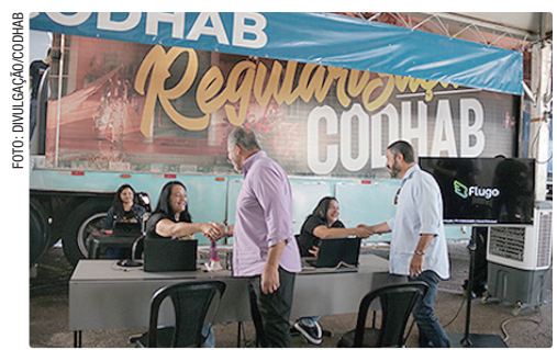
Unidade móvel da Codhab funciona das 9h às 16h, durante a programação, até sexta (19)

Mais informações podem ser obtidas pelos telefones (61) 3214-1874 e (61) 3214-1858.