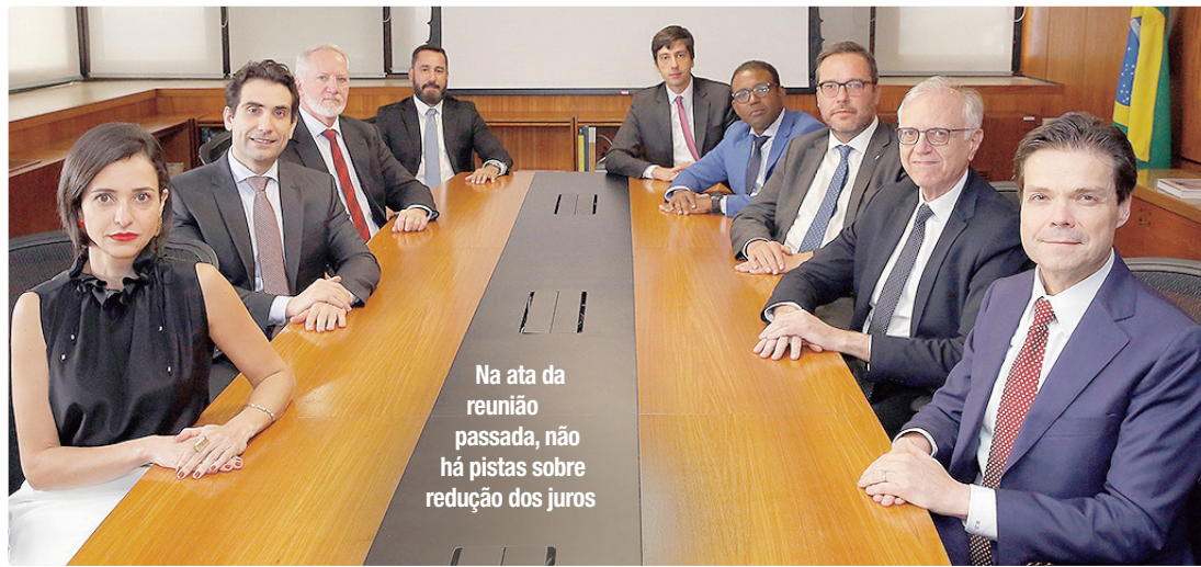
Na ata da reunião passada, não há pistas sobre redução dos juros

A Selic é considerada a principal referência de juros do país, com impacto em financiamentos, empréstimos, investimentos e no crédito para empresas e consumidores. Na ata divulgada, o comitê não deu pistas sobre a evolução dos juros e informou que está monitorando o conflito e os efeitos de um possível prolongamento sobre a inflação,