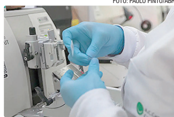
Tratamento servirá a casos agudos em que não cabe quimioterapia

A medida segue recomendação da Comissão Nacional de Incorporação de Tecnologias no Sistema Único de Saúde (Conitec) e está alinhada ao Protocolo Clínico do Ministério da Saúde. O relatório técnico que embasou a decisão ficará disponível para consulta pública no portal da Conitec.