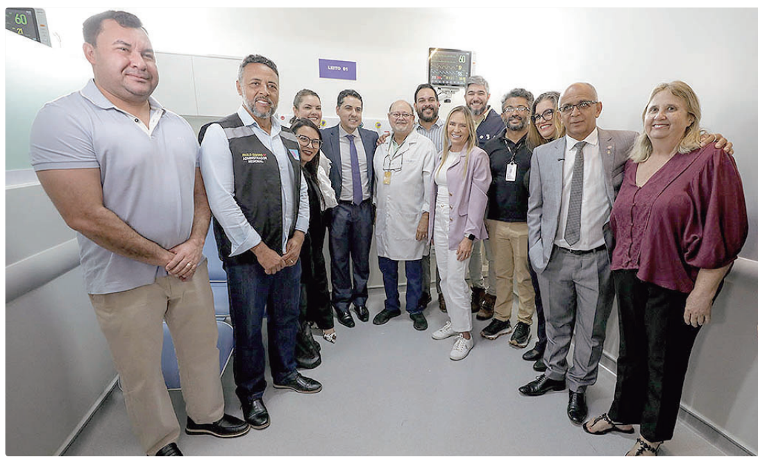
A governadora Celina Leão entregou a ampla reforma nesta terça-feira; obra recebeu investimento de R$ 1,5 milhão

“Estão acontecendo várias reformas de centros de UTI na nossa rede pública de saúde. Obras assim chegam a emocionar. Entregar um espaço adequado como esse, para nossa equipe de saúde, é dar uma condição de trabalho e melhorar o atendimento aos pacientes. É uma estrutura com todos os níveis de suportes. Toda semana nós estamos inaugurando espaços novos, 100% reformados e é com o que tem de mais moderno.