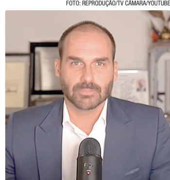
Eduardo responde por coação no curso do processo da trama golpista

Outro fato que ganhou destaque na análise foi a concretização da aplicação da Lei Magnitsky – dispositivo legal voltado a punir acusados de corrupção