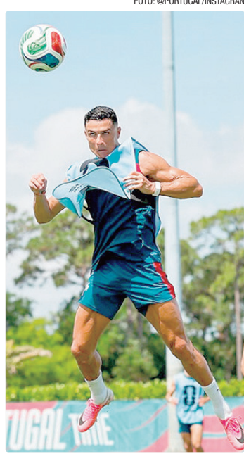
Um dos destaques de Portugal, Cristiano Ronaldo está em sua 6ª copa

Uma outra equipe forte do grupo é a Colômbia, com um