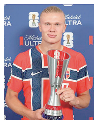
Atacante norueguês Haaland foi eleito o melhor em campo