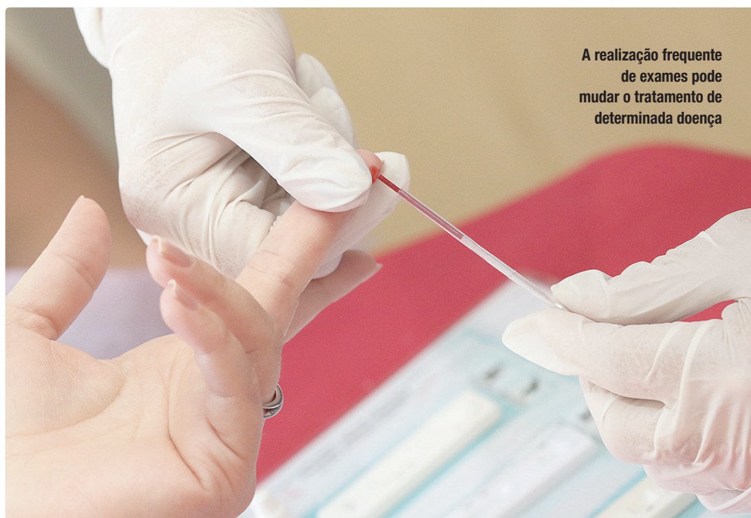
A realização frequente de exames pode mudar o tratamento de determinada doença