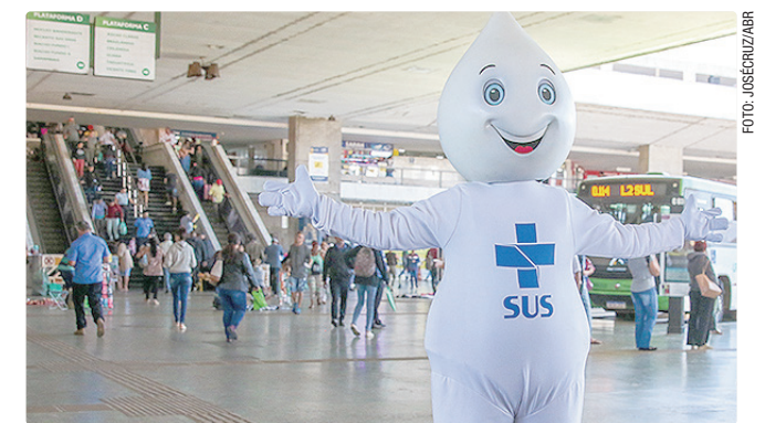
Recuperar a imunização é fortalecer a Atenção Primária à Saúde (APS)

GDF trabalha na assinatura que deve permitir a instalação de 65 empresas no espaço destinado ao setor de inovação. “É uma cidade pronta para receber o valor agregado que a tecnologia traz”, resumiu. “A partir do momento em que a gente abraçar esse setor, Brasília será um dos maiores hubs tecnológicos do mundo”.