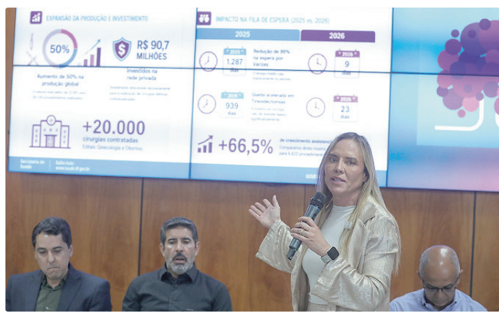
Segundo Celina, os editais são para atacar as filas de cirurgias nas duas áreas

A iniciativa integra a estratégia do GDF de ampliar a capacidade assistencial por meio do programa Opera DF, que acelera a realização de cirurgias