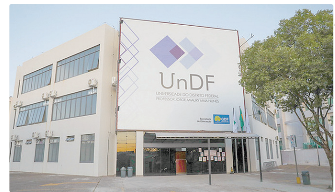
Programa oferece bolsas integrais para estudantes e servidores do GDF

Com o encerramento das inscrições se aproximando, a recomendação é que os candidatos não deixem para a última hora e realizem sua inscrição com antecedência.