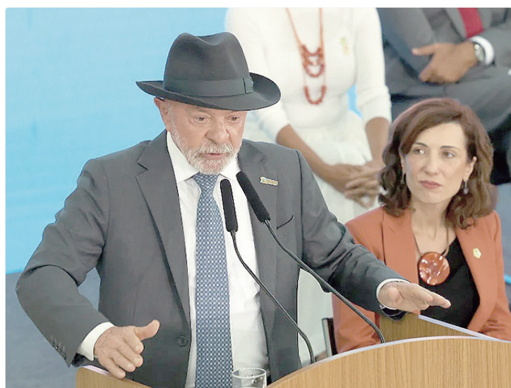
Durante coletiva de imprensa, Lula disse que Trump fala muito e ouve pouco

Lula também falou que Trump fez uma “coisa desafortada” com