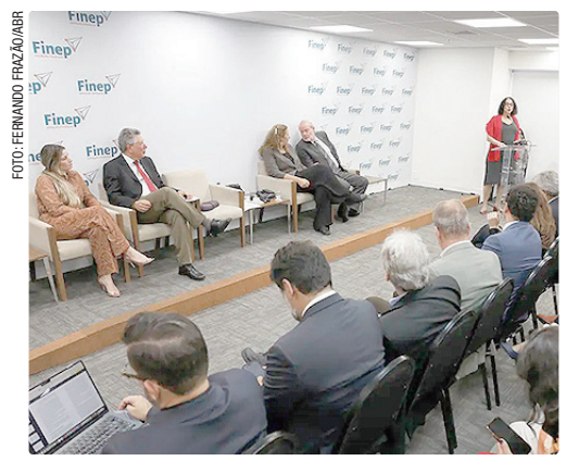
De acordo com a ministra Luciana Santos, pela primeira vez, o programa contempla todas as 27 unidades da federação

O presidente da Finep, Luiz Antônio Elias, explicou o modelo de cooperação com as unidades federativas. “Trabalhamos em conjunto com os agentes estaduais para operacionalizar a subvenção econômica e modernizar o setor produtivo nas diferentes regiões. É no espaço entre produção do conhecimento e sua incorporação à economia e à sociedade que programas como o Tecnova assumem um papel significativo e estratégico”, destacou Elias.