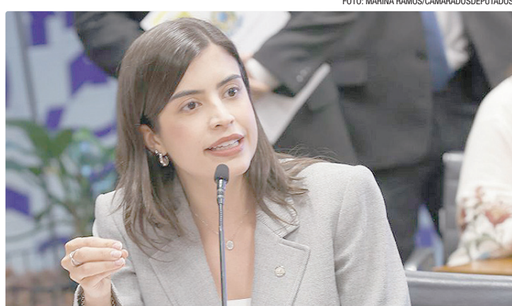
A deputada Tabata Amaral (PSB-SP) é a relatora da proposta na Câmara

Por acordo entre os líderes partidários, a proposta será votada no Plenário da Câmara dos Deputados até o início de julho. A coordenadora do grupo e relatora da proposta, deputada Tabata Amaral (PSB-SP),