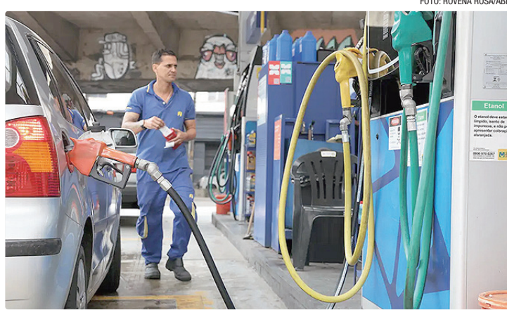
IBGE registrou queda de -6,2% no setor de combustíveis e lubrificantes

Dos oito grupos de atividades pesquisados pelo IBGE, seis apresentaram recuo nas vendas