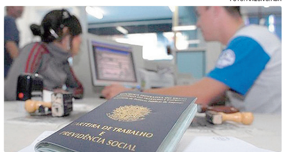
Em 2025, Brasil possuía 46,6 milhões de jovens entre 15 e 29 anos, sendo 17,5% sem trabalhar ou estudar

Ao serem perguntados sobre o principal motivo de abandono escolar ou de nunca terem frequentado a escola, os jovens de 14 a 29 anos indicaram, majoritariamente, a necessidade de trabalhar, mencionada por 43% dos