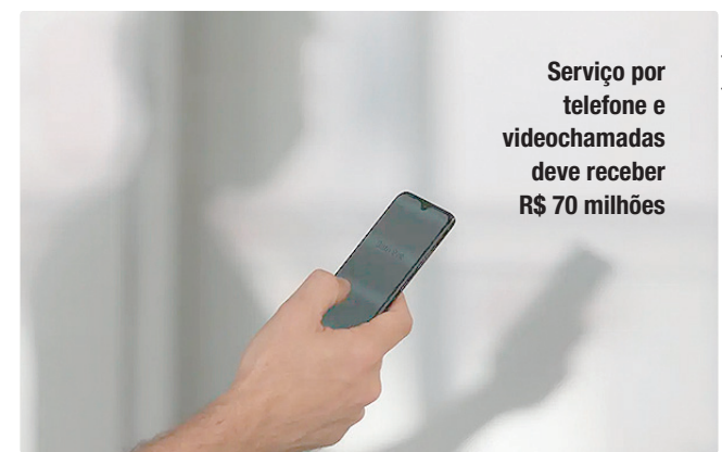
Serviço por telefone e videochamadas deve receber R$ 70 milhões

Parte dos recursos necessários para a execução do plano virá dos R$ 45,7 milhões (em valores não corrigidos) que a pasta recebeu em 2025, a título de destinação social das bets. O total repassado ao Ministério da Saúde no ano passado corresponde a 1% do Produto da Arrecadação de tributos pagos pelas empresas de apostas e por apostadores.