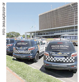
Atualmente, 10 regiões estão há mais de um ano sem homicídio

Considerando apenas o ano de 2026, o resultado é ainda mais expressivo: 14 regiões administrativas seguem sem registros de homicídio: Jardim Botânico; Cruzeiro; Candangolândia; Sudoeste; Lago Sul; Park Way; Guará; Varjão; Riacho Fundo II; Riacho Fundo; SIA; Arniqueira; Lago Norte; Paranoá.