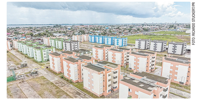
Programa Minha Casa, Minha Vida vai receber cerca de R$ 20 bilhões

Outros órgãos também receberam valores menores, incluindo a Presidência da República, alguns ministérios e autarquias. Para viabilizar parte do crédito, o governo cancelou dotações em diferentes áreas.