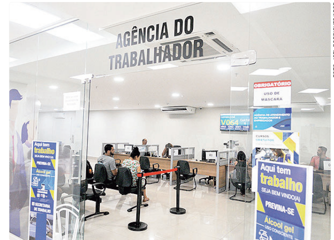
Postos estão localizados em diversas regiões administrativas

Empregadores e empreendedores que desejem ofertar vagas ou utilizar o espaço das agências do trabalhador para as entrevistas podem se cadastrar pessoalmente nas unidades ou pelo e-mail gcvt@sedet.df.gov.br . Pode ser utilizado, ainda, o Canal do Empregador, no site da Secretaria de Desenvolvimento Econômico, Trabalho e Renda (Sedet-DF).