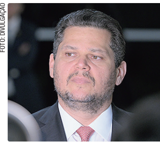
Davi Alcolumbre não esconde que quer manter a PEC travada

O senador Otto Alencar informou que vai priorizar a PEC do fim da escala 6x1, por ter iniciado a tramitação antes da proposta da oposição. Na semana seguinte à aprovação na Câmara, Alcolumbre criticou a pressão para despachar a matéria, sugerindo que ela poderia ser melhorada no Senado e passar por comissões antes do plenário. “Tenho certeza de que, como outros senadores, seria razoável que o Senado pudesse melhorar um texto dessa importância e debater o tema com calma”, defendeu Alcolumbre.