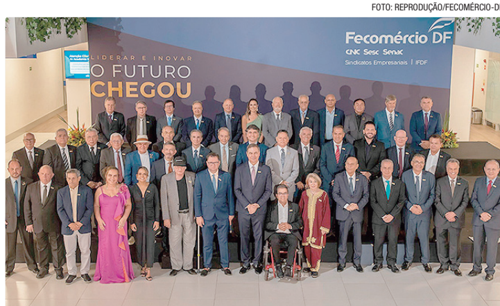
Nova diretoria da Fecomércio-DF tomou posse para mandato até 2030

O inteiro teor do estudo Diagnóstico do Setor Comercial Sul, feito pela Universidade Católica e pela Universidade de Brasília, com parceiros do setor produtivo e do próprio Governo do Distrito Federal (GDF), foi apresentado em reunião nesta semana. “Nós abraçamos o projeto e, agora, a determinação do governo é que seja feito, implementado e que sejam tomados os trâmites burocráticos”, enfatizou a governadora.