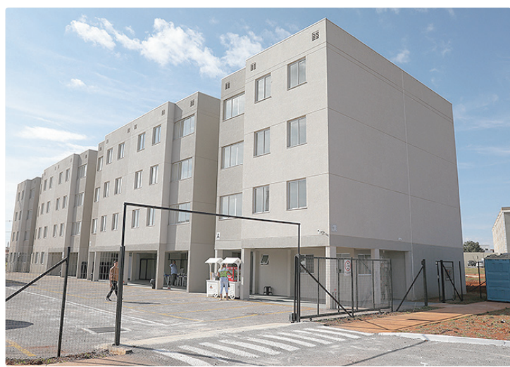
Residencial fica próximo à UBS 5 e ao Centro de Ensino Fundamental Lobo Guará