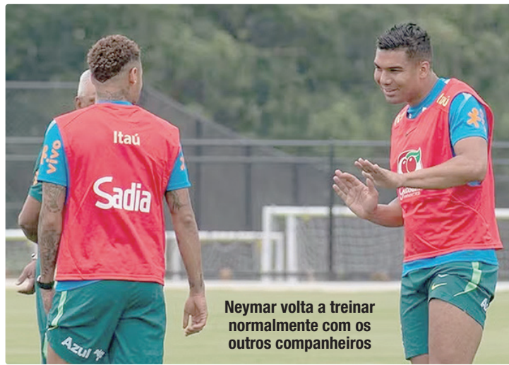
Neymar volta a treinar normalmente com os outros companheiros

O elenco da seleção brasileira foi a campo no início da tarde desta segunda-feira, em Nova Jersey. Comandados por Carlo Ancelotti, 24 jogadores treinaram com foco no jogo contra a Escócia, da próxima quarta, válido pela terceira rodada do Grupo C da Copa do Mundo. O goleiro Alisson foi poupado da atividade por controle de carga e fez apenas trabalhos na academia. Raphinha foi o desfalque. O