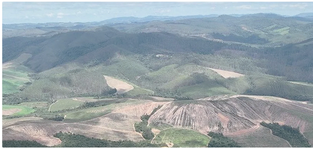
A mineradora australiana de Poços de Caldas é um dos projetos que pode acelerar a colaboração entre UE e Brasil

Sikela avalia que a abordagem europeia é um trunfo por priorizar a sustentabilidade do negócio e o incentivo ao processamento local de terras raras. Isso casa com uma diretriz do governo brasileiro, de produzir e exportar minerais processados, que agreguem tecnologias e valores à cadeia produtiva de um setor nascente no Brasil, que conta com a segunda maior reserva global de tais minerais críticos. “É