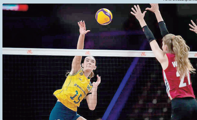
Em partida emocionante, duelo foi decidido apenas no tie-break em Ankara

A equipe comandada por José Roberto Guimarães demonstrou poder de reação, após perder os dois primeiros sets de maneira