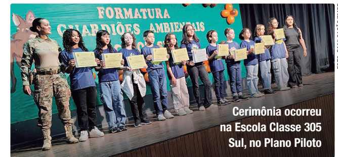
Cerimônia ocorreu na Escola Classe 305 Sul, no Plano Piloto

O Projeto Guardiões Ambientais integra o conjunto de ações preventivas promovidas pelo Prealg nas instituições de ensino fundamental do Distrito Federal. Alinhado aos princípios da Lei nº 9.605/1998 (Lei de Crimes Ambientais), o programa atua diretamente na segurança pública por meio da prevenção primária, com foco estratégico no combate à criação irregular e ao tráfico de animais silvestres. Desde a sua implementação, o Prealg já formou mais de 14 mil guardiões ambientais e impactou cerca de 700 mil pessoas.