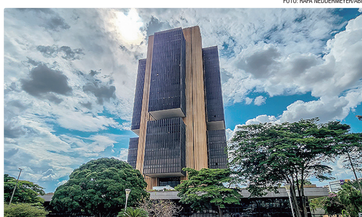
Projeções são divulgadas toda segunda-feira pelo Banco Central

Os economistas também passaram a projetar somente mais um corte de juros em 2026, para 14% ao ano, na reunião do Comitê de Política Monetária (Copom) de agosto. As expectativas fazem parte do “Boletim Focus”, divulgado nesta segunda-feira (22) pelo Banco Cen-