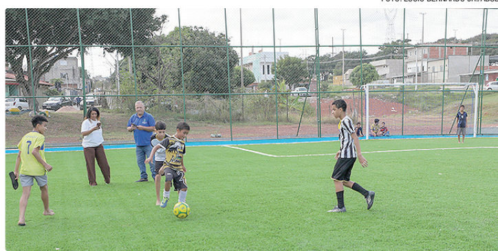
Os campos estão de cara nova para ampliar conforto e segurança aos usuários

reforma teve investimento de R$ 1,97 milhão, proveniente de emenda parlamentar do deputado distrital Daniel de Castro. A obra incluiu a substituição completa do gramado sintético e o reforço estrutural dos alambrados. Além disso, para melhorar o acesso e a durabilidade do equipamento, foram construídas novas calçadas e implantado um sistema de drenagem de águas pluviais.