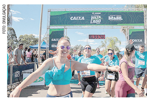
Uma das corridas mais tradicionais do DF acontece no dia 5 de julho e reunirá atletas de todo o país em percursos de até 100 km