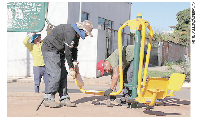
Estão sendo instalados 27 novos equipamentos de PECs

Para a Diretoria de Obras, o orçamento inicial previsto é de R$ 1.991.836 para a revitalização das calçadas dos conjuntos habitacionais Caub I e Caub II. No Caub I, o primeiro trecho foi concluído com a finalização da concretagem do passeio público, incluindo o polimento superficial e o corte das juntas de dilatação.