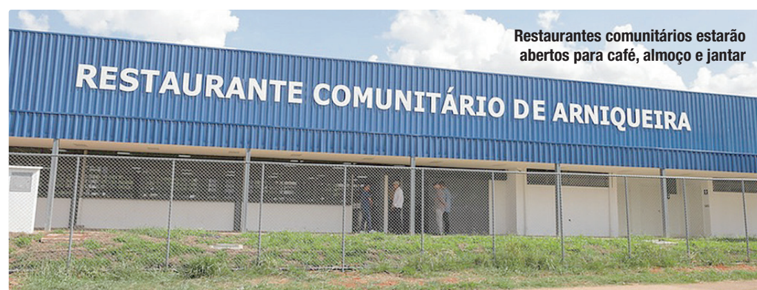
Restaurantes comunitários estarão abertos para café, almoço e jantar

Os espaços administrados pela Secretaria de Cultura e Economia Criativa (Secec-DF), como bibliotecas, museus, centros culturais, o Cine Brasília e o Teatro Nacional Claudio Santoro, estarão fechados na segunda-feira. O Jardim Zoológico de Brasília e o Jardim Botânico também não abrirão para visitação. Já os parques ecológicos administrados pelo Brasília Ambiental funcionarão normalmente, nos horários habituais de cada unidade.