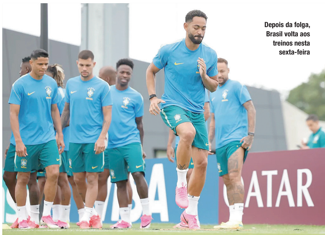
Depois da folga, Brasil volta aos treinos nesta sexta-feira

Já o Japão assegurou a classificação ao empatar com a Suécia na última rodada do Grupo F. A seleção japonesa terminou na segunda posição da chave, atrás da Holanda, e agora terá pela frente o Brasil na abertura da fase eliminatória. Caso