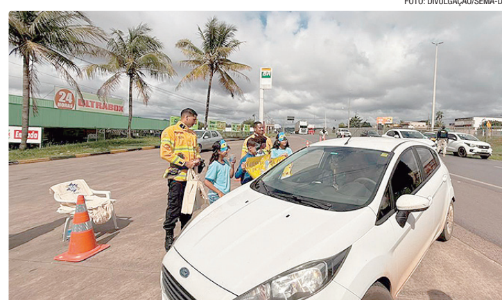
Os alunos atuam como multiplicadores de informações na comunidade

Durante a operação, os veículos que trafegarem pelo local