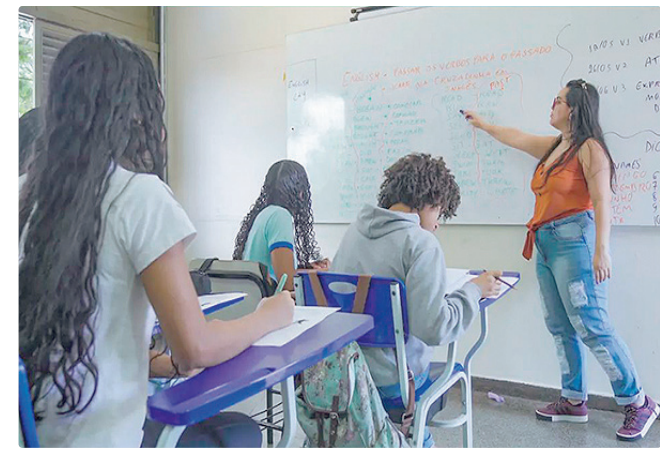
MEC atribui resultados de 2025 à combinação de políticas públicas

Os dados também indicam que mais estudantes têm conseguido permanecer no ensino médio. Entre 2022 e 2025, a taxa de não retorno ao ensino médio caiu 28%, o que significa que mais jovens permaneceram em sala de aula de um ano letivo para outro. O Inep estima que se o indicador permanecesse no nível de 2022, o Brasil teria, quase 250 mil estudantes a menos no ensino médio.