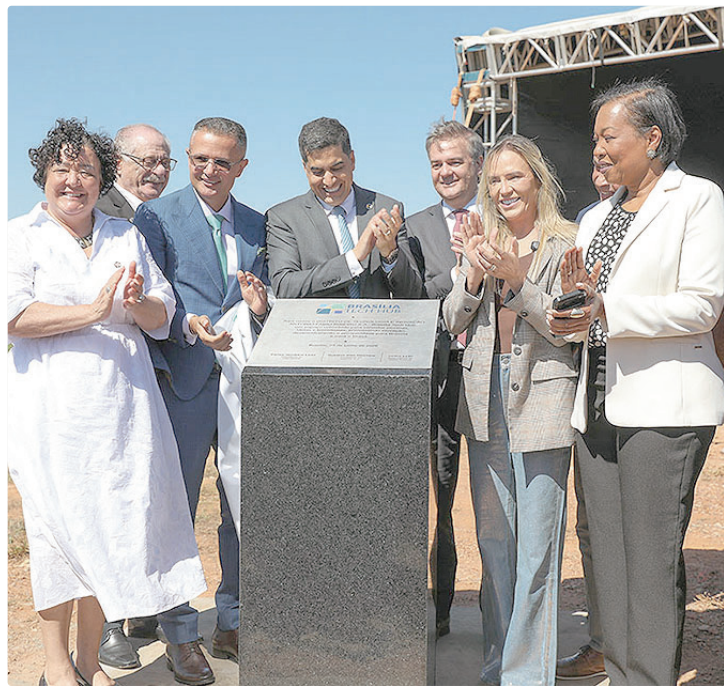
Para Celina, o local será o grande centro de tecnologia da América Latina

Durante a solenidade, a governadora Celina Leão anunciou que o local será o grande centro de tecnologia e inovação da América Latina dentro de anos. “Não há outra cidade que tenha vocação, logística, água e energia como nós podemos disponibilizar para o setor”, declarou.