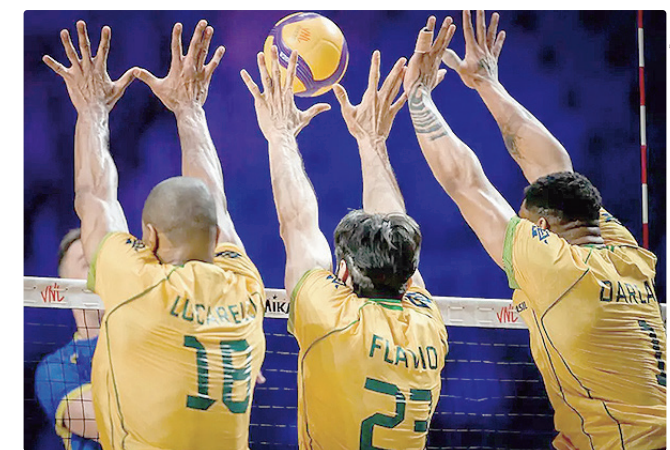
Após sequência invicta em Brasília, seleção vem de revés para Ucrânia

Campeão em 2021, o Brasil tenta se igualar à França, Rússia e Polônia, ganhadora no ano passado, como um dos maiores vencedores da Liga das Nações. Em 2025, a seleção de Bernardinho conquistou a medalha de bronze.