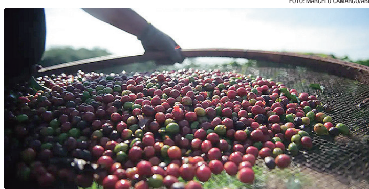
Mais da metade das exportações brasileiras de café são para a Europa

liza que pouco mais da metade (51,2%) da produção do café brasileiro teve como destino a União Europeia (UE), em 2024, e prevê quais impactos da política de con-