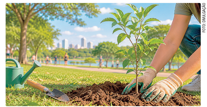
Plantio das mudas será no estacionamento 5 do Parque da Cidade