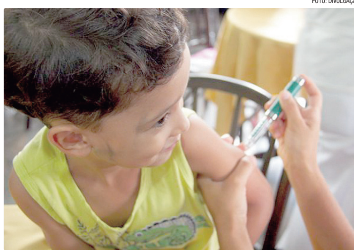
Diferencial do HCB é atender os pacientes de forma individualizada

“O diferencial do HCB é ter uma equipe multidisciplinar. O paciente passa por diferentes áreas: endocrinologia, psicologia, enfermagem e técnico de enferma-