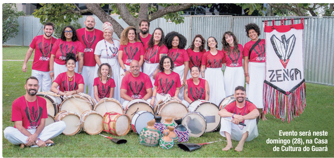
Evento será neste domingo (28), na Casa de Cultura do Guarã

“Para quem tá descobrindo a cultura popular afro-brasileira, digo que esse mergulho [por meio da oficina] é incrível, pois nada mais obrigatório para o cidadão brasileiro que estudar sua ancestralidade e entender um pouco