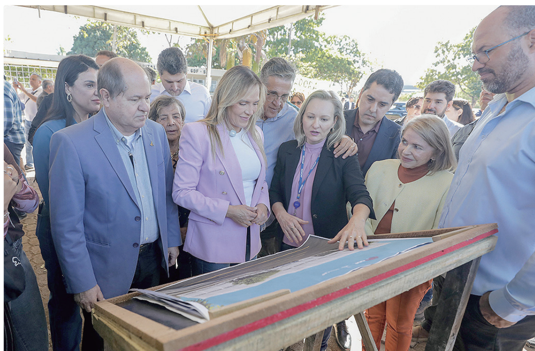
A governadora Celina Leão assinou a ordem de serviço de lançamento do edital de licitação para a construção da área

Emocionada, a governadora relembrou a história familiar e a própria trajetória em defesa das doenças raras. “O recurso para essa grande obra eu coloquei ainda quando era deputada federal. E é uma obra para que a gente tenha um lugar onde todas essas famílias se encontrem, um lugar onde todas sejam acolhidas. Nós temos os melhores profissionais dessa área, são eles que dividem o luto com as famílias, mas com a esperança de fazer algo diferente. Isso aqui para