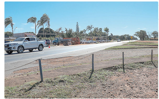
Ordem de serviço prevê pavimentação de 1,5 km da Rua Rural 1

O presidente do Brasília Ambiental, Gutemberg Gomes, explicou que a análise para a autorização de obras considera os impactos ambientais em todo o DF. Segundo ele, no caso do Vista Bela, a intervenção é de baixo impacto ambiental, o que permitiu a licença. “Não faz sentido segurar uma autorização ambiental quando isso acaba prejudicando a sociedade. Aqui, trata-se de uma melhoria”.