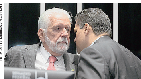
Alcolcumbre rompeu relações com Jaques Wagner; voltaram a se falar, mas a articulação ficou comprometida

Na liderança do governo no Congresso, o senador Randolfe Rodrigues (PT-AP) fica justamente no meio do caminho da rusga entre Lula e Alcolcumbre. Aliado do presidente do Senado, Randolfe é candidato a reeleição ao Senado e, segundo interlocutores, depende mais de Alcolcumbre do que de Lula para se manter na Casa. Por isso, o parlamentar tem se dedicado mais à política no estado do que no Congresso.