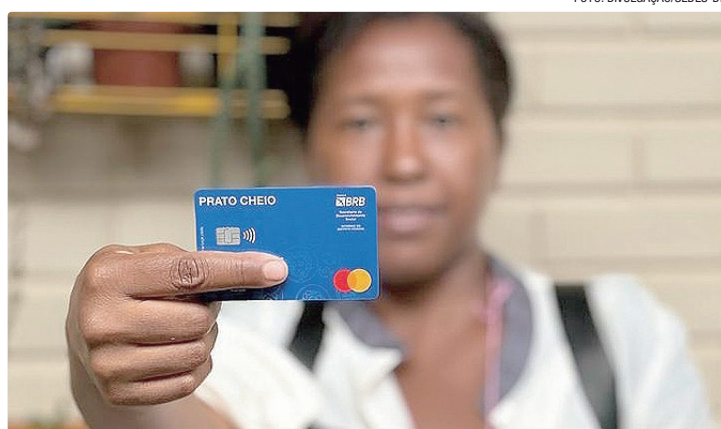
Os novos beneficiários têm até dois meses para retirar o cartão no BRB

Para verificar se foi contemplado, o local para retirada do novo cartão, ou se voltou a participar do programa Prato Cheio, o beneficiário deve acessar o site do GDF Social. As pessoas que estão retor-