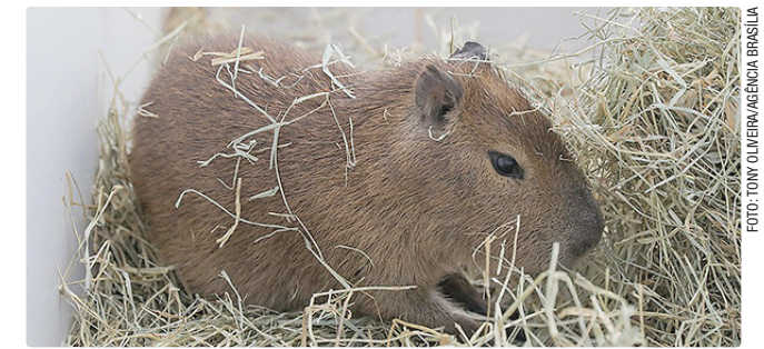
Territorialidade das capivaras é escudo natural para a população

Os dados indicam que a territorialidade das capivaras tem sido uma barreira ímpar, servindo como cordão sanitário natural para toda a população humana do DF. O estudo teve início em 2025 e se estende até 2027. “A expectativa é que ao final tenhamos protocolos prontos para trabalhar com as capivaras, que tenhamos subsídios para a adoção de políticas públicas que ensejem um convívio harmônico entre a população humana e os indivíduos da fauna silvestre”, ressaltou.