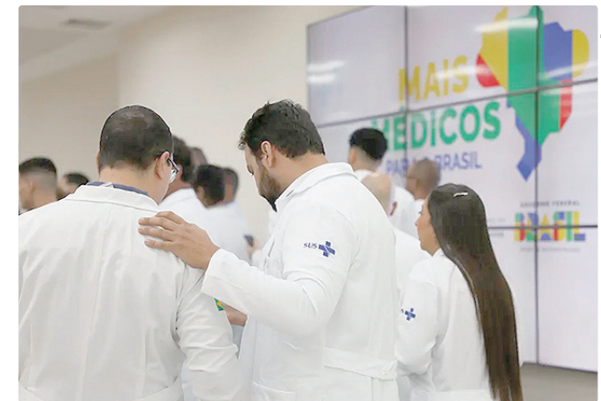
Candidatos têm até o dia 6 de julho pagar a taxa de inscrição