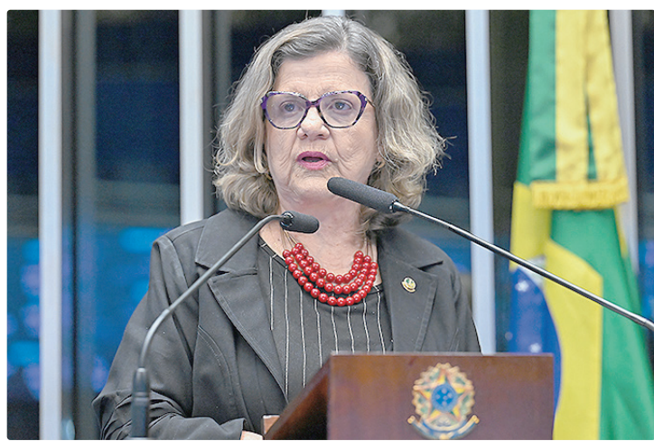
Senadora Teresa Leitaõ foi indicada por Lula para substituir Jaques Wagner

“Atuarei para fortalecer a articulação entre o Palácio do Planalto, a base aliada e os parlamentares, especialmente os líderes e o presidente do Senado, Davi Alcolcumbre, contribuindo para a construção de consensos e para o avanço das pautas de interesse do governo e do povo brasileiro, como o fim da escala 6x1, a PEC da Segu-