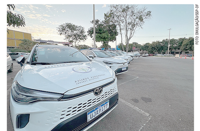
Viaturas passam a integrar a frota da Subsecretaria de Operações

“A incorporação dessas novas viaturas amplia a capacidade operacional da subsecretaria responsável pelas ações integradas da Secretaria de Segurança Pública, garantindo mais agilidade, mobilidade e eficiência no planejamento e na coordenação das operações. O reforço da frota dará suporte ao monitoramento de grandes eventos, às ações integradas de preservação da ordem pública e às operações realizadas em conjunto com as forças de segurança e demais órgãos do GDF. É um investimento que fortalece a atuação do Estado.