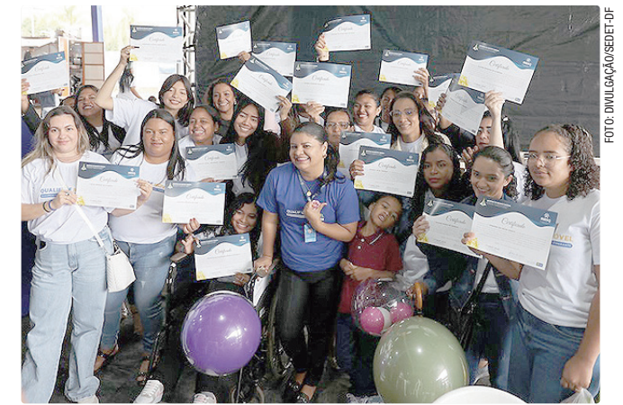
Formação oferecida aproxima comunidade do mercado de trabalho

O QualificaDF Móvel tem como objetivo ampliar o acesso à capacitação profissional gratuita, aproximando a formação das comunidades e facilitando o ingresso da população no mercado de trabalho ou o desenvolvimento de novos empreendimentos. As aulas são realizadas em salas adaptadas nas próprias unidades móveis, proporcionando estrutura adequada para o aprendizado sem que os alunos precisem se deslocar para outras regiões.