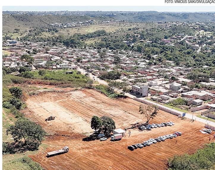
Investimento no Hospital Regional de São Sebastião é de R$ 165,9 milhões

A governadora destacou que o fortalecimento da saúde pública é uma das prioridades da atual gestão. “Sabemos que a população sempre apresenta