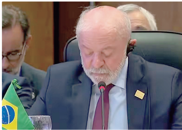
Lula pediu um minuto de silêncio em homenagem às vítimas de terremotos

O presidente do Brasil comentou os 35 anos do Mercosul, afirmando que a criação do bloco foi uma resposta ao pas-