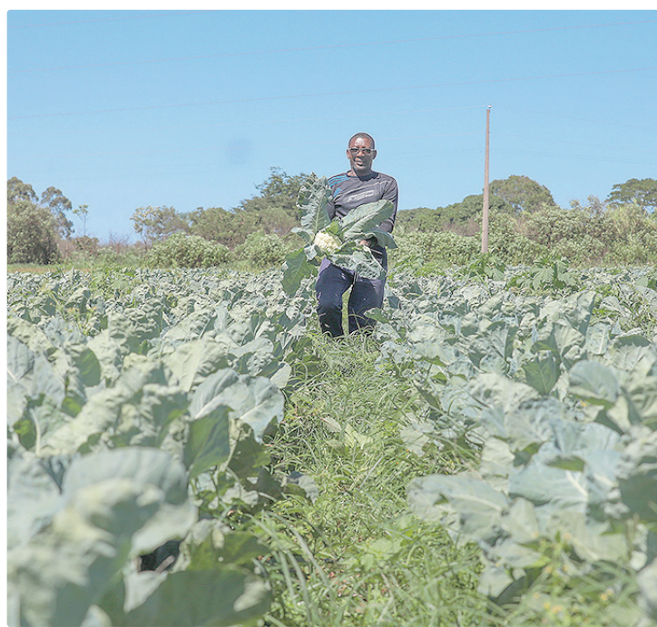
Produção de hortaliças: campo segue como pilar da economia do DF

Elaborado pela Emater-DF, o relatório consolida informações levantadas diretamente nas propriedades rurais pelos extensionistas da empresa, que são repassadas à Gerência de Desenvolvimento Econômico (Gedec) e calculados com base nos preços médios de comercialização apurados pela Gerência de Comercialização e Organização Rural (Gecor). O resultado oferece um retrato detalhado da riqueza gerada