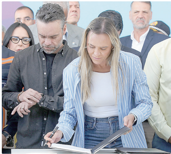
Celina Leão anunciou investimento de R$ 12,3 milhões para os serviços

A governadora disse que “esta edição é muito especial. Essa cidade é uma cidade que cresce muito e precisa do olhar do Estado, nas áreas de captação de águas fluviais, de esgoto, de iluminação pública, de asfalto. E nós vamos chegar com todo esse serviço de zeladoria. O GDF Na Sua Porta já é um sucesso onde a gente passa. A satisfação da população é de 80% a 90% porque a gente cuida de tudo – inauguramos campos sintéticos, colocamos água, melhoramos a questão do asfalto, podamos árvores, retiramos os lixões da cidade. É um sucesso!”, celebrou a governadora.