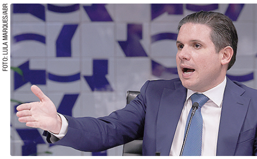
Lula pediu agilidade a Hugo Motta, presidente da Câmara, que reconheceu a importância da medida

“Esse conjunto de medidas foi construído para remover obstáculos, ampliar oportunidades e dar condições para que milhões de empreendedores possam crescer, contratar e prosperar”.