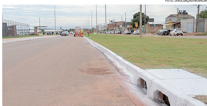
Ações no Paranoá incluíram a construção e a recuperação de meios-fios

No Itapoã, primeira cidade a receber o programa, foi con-