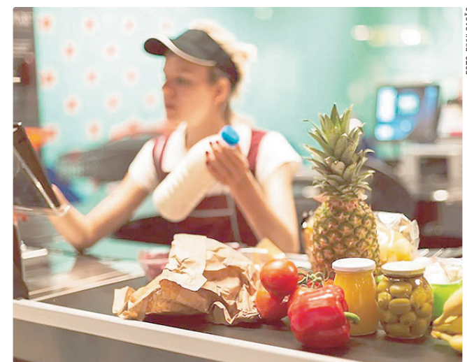
Operador de caixa tem 147 oportunidades e salário de R$ 1,7 mil

Empregadores e empreendedores que desejem ofertar vagas ou utilizar o espaço das agências do trabalhador para as entrevistas podem se cadastrar pessoalmente nas unidades ou pelo e-mail gcv@sedet.df.gov.br . Pode ser utilizado, ainda, o Canal do Empregador, no site da Secretaria de Desenvolvimento Econômico, Trabalho e Renda (Sedet-DF).