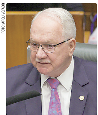
Comissão terá seis meses para mapear parcelas remuneratórias

Ao anunciar a criação do grupo, no início deste mês, Fachin afirmou que a ausência de revisões periódicas e de entendimentos uniformes sobre a remuneração da magistratura nos últimos anos contribuiu para a formação de “realidades distintas”, resultando em desigualdades, insegurança jurídica e falta de transparência.