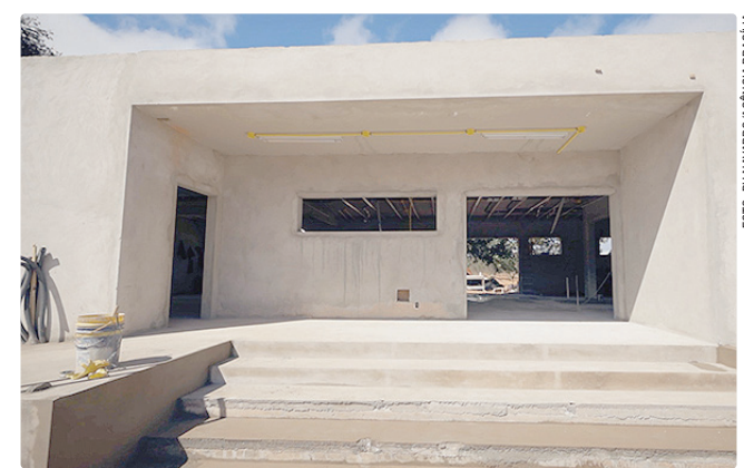
Nova UBS terá salas de vacinação, de medicação e de acolhimento

Unidade foi projetada para operar como sede fixa de uma equipe de saúde da família completa, composta por médico generalista, enfermeiro, técnicos de enfermagem e agentes comunitários de saúde.