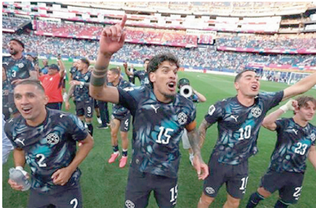
Com vitória, nos pênaltis, sobre a Alemanha, Paraguai conhecerá seu adversário hoje, após jogo entre França x Suécia

Com a marcação do Paraguai em cima, o empate só veio no segundo tempo. Aos 54 minutos, Kai Havertz, de cabeça, igualou o placar em Boston. Ele recebeu a bola de fora da área de Florian Wirtz. Apesar de ter perdido