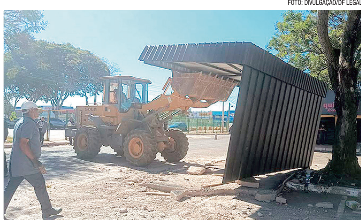
Contêineres tinham uma base de concreto e ocupavam a área de 8 vagas

A situação foi denunciada pelos próprios comerciantes da área, que acionaram a administração regional. Constatada a falta de licença, a administra-