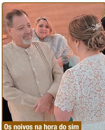
Os noivos na hora do sim