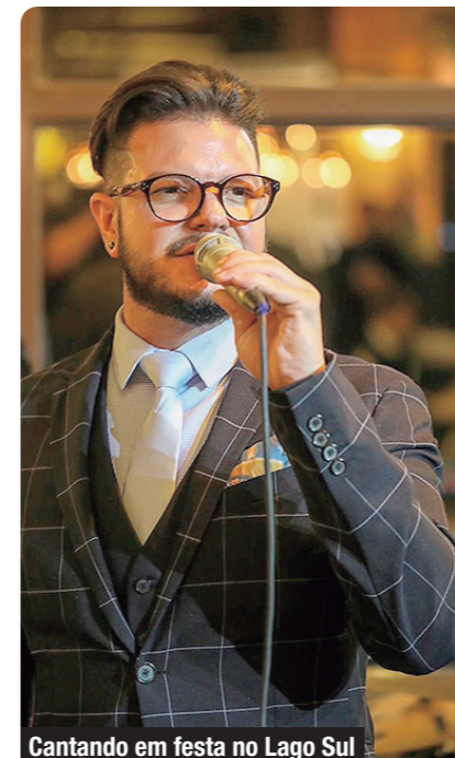
Cantando em festa no Lago Sul