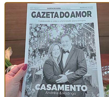
Jornal feito pelo noivo para o casamento