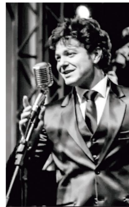
Em uma de suas primeiras apresentações