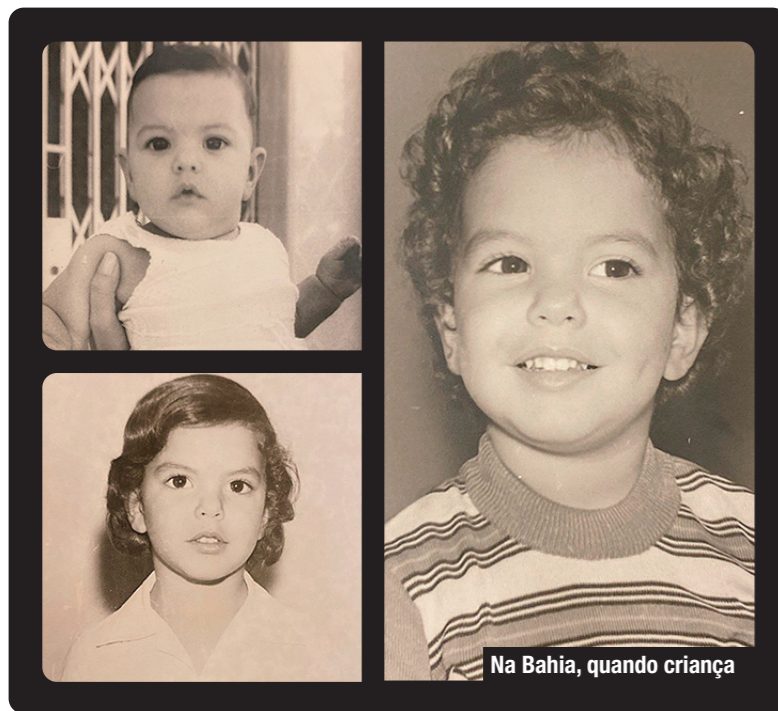
Na Bahia, quando criança

outros caminhos. Por ser também encantado com o universo da moda desde jovem, adora seguir as tendências e estar sempre renovando seu guarda-roupa. "Gosto de garimpar meu guarda-roupa, de procurar roupas antigas, peças de coleções e juntar com algo mais trend", diz. O que não impede que, no meio de tanta diversidade, o nosso Frank Sinatra faça três vezes por semana academia assistida pelo seu personal trainer. O que lhe garante tanta disposição.