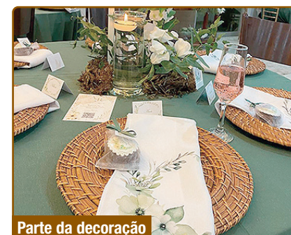
Parte da decoração