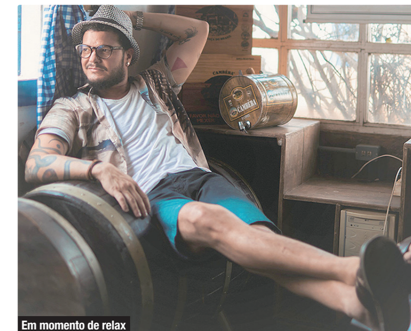
Em momento de relax

Quanto a ser uma pessoa de fé, ele mesmo explica, que assim se considera, "desde que não seja uma fé religiosa, mas existencial,