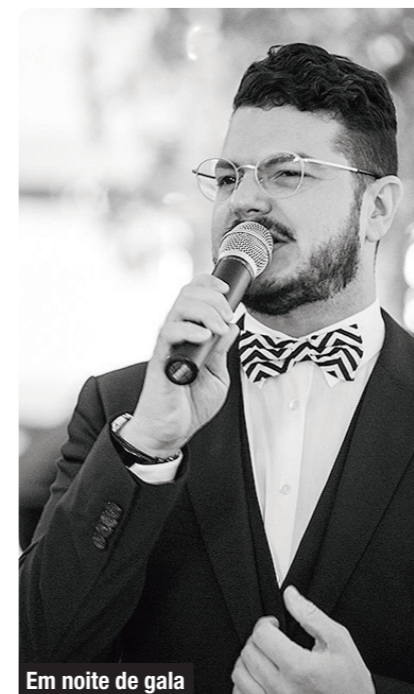
Em noite de gala