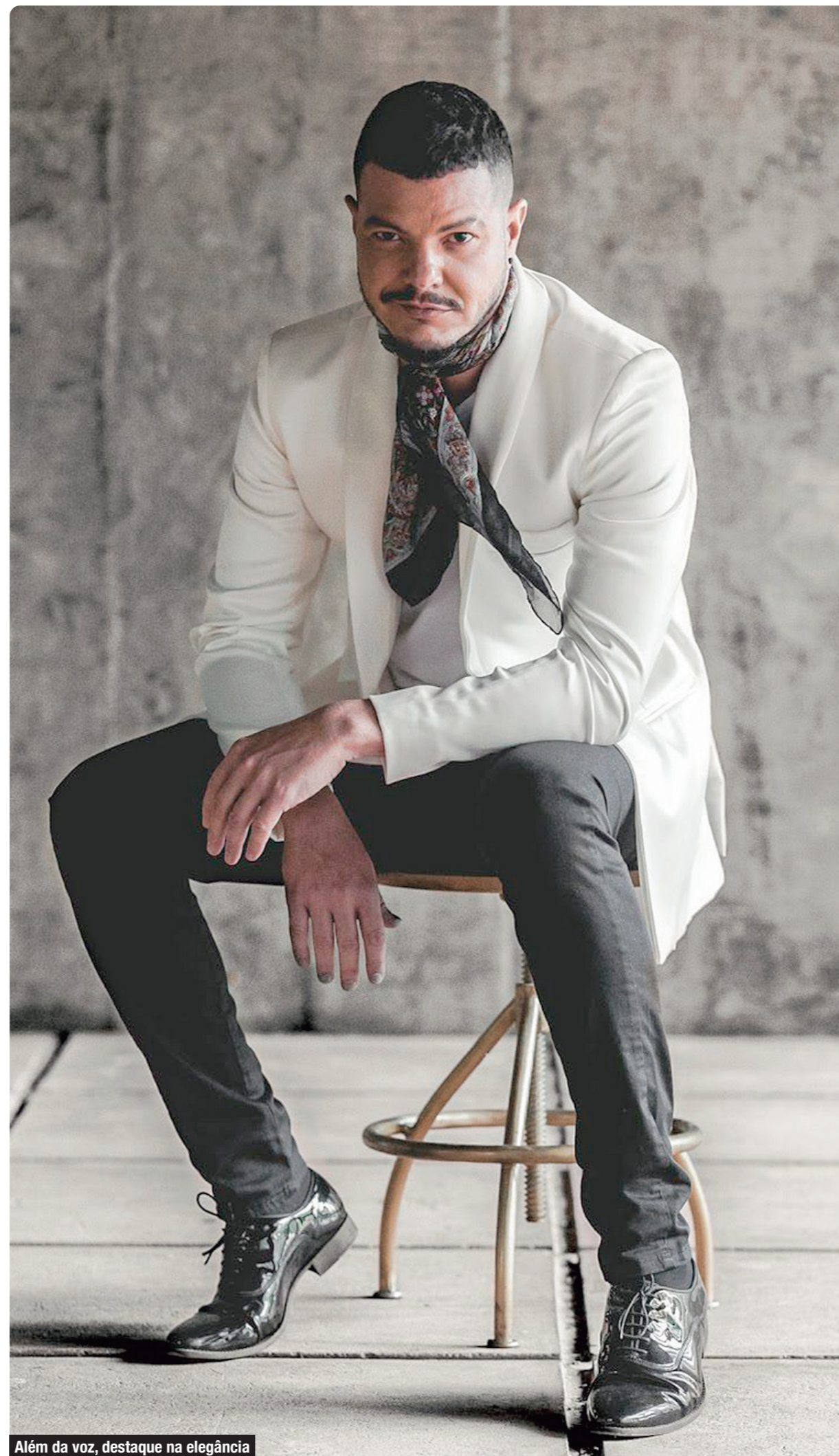
Além da voz, destaque na elegância

Sua participação no primeiro reality show do país, o programa "Fama", da Rede Globo, em 2002, o projetou para o cenário nacional. Em 2005, ele lançou seu primeiro álbum "Quintal do Meu Mundo", com aplaudidos shows no Rio de Janeiro e em Brasília, mostrando sua versatilidade e paixão pela música. Assim estava consolidada a carreira do cantor, cuja classificação de voz é de tenor, mas por ter facilidade de alcançar tons mais graves é de um baritenor. Ou seja, tenor com alcance para barítono.