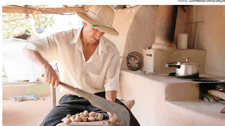
Transformar renda a partir da floresta em pé é um grande desafio