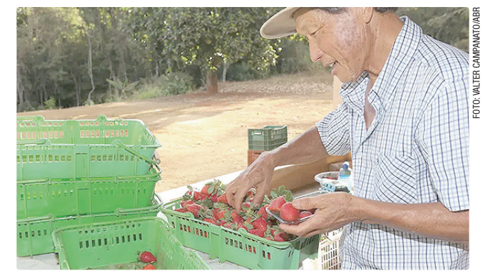
Editais incentivam instituições e empresas a apresentarem projetos