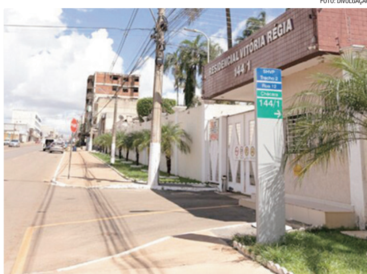
Decreto contempla área de 537,7 mil metros quadrados, com 560 lotes

O projeto contempla uma área de 537.708,53 metros quadrados (53,77 hectares), onde estão previstos 560 lotes, dos quais 431 são destinados ao uso residencial unifamiliar. Ao todo, o parcelamento comporta 2.535 unidades habitacionais, com capacidade estimada para 6.794 moradores.