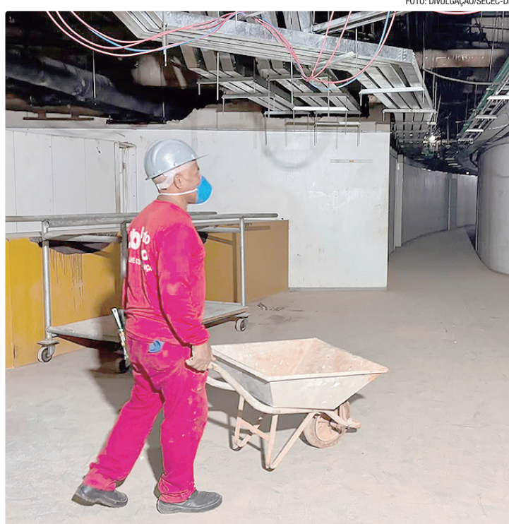
Serviços compreendem uma série de melhorias e adequações da estrutura

Com investimento de R$ 268,3 milhões, a segunda etapa da obra contempla a restauração da Sala Villa-Lobos e de seu foyer, dos camarins, da Sala Alberto Nepomuceno e do Espaço Cultural Dercy Gonçalves. Os serviços são executados pela Porto Belo Engenharia, vencedora da licitação e responsável também pela primeira etapa da