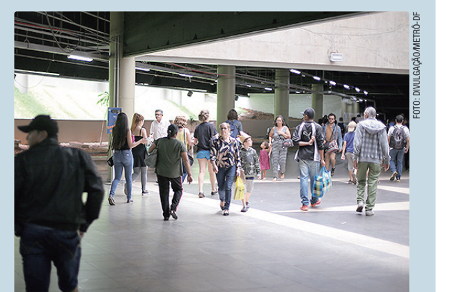
A iniciativa no Metrô integra a Campanha do Agasalho deste ano

O Metrô-DF contou com a mobilização da equipe do Posto de Achados e Perdidos (Pcoap) da companhia que irá disponibilizar agasalhos e outras peças de inverno, esquecidas nas estações e que estão aptas para doação, tanto pelo estado de conservação como pelo tempo de permanência excedido no Pcoap. A iniciativa também conta com a participação solidária dos colaboradores, que contribuíram com a doação de agasalhos e de peças de inverno.