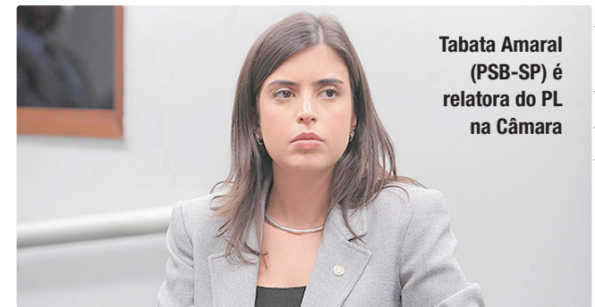
Tabata Amaral (PSB-SP) é relatora do PL na Câmara

A relatora do projeto será a deputada Tabata Amaral (PSB-SP). Ela já era responsável por um grupo de trabalho sobre o tema e vinha articulando para que o projeto fosse votado nesta semana na Câmara.