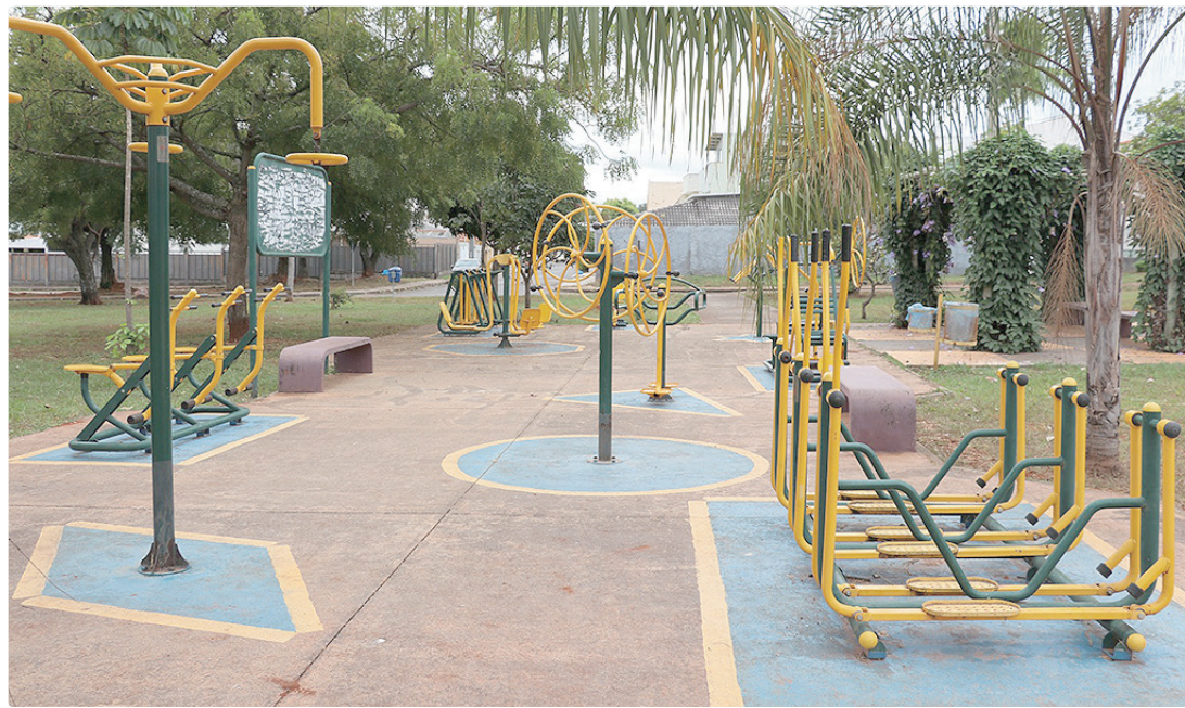
Objetivo da Novacap é instalar e revitalizar PECs, ampliando o acesso da população à prática de atividades físicas

A segunda frente cuida da gestão de fornecimento dos aparelhos de PEC e de sua manutenção contínua, realizada com mão de obra própria