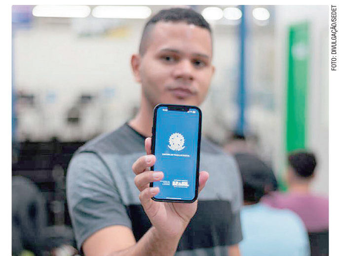
Para participar, basta se cadastrar no aplicativo Carteira Digital

Para participar dos processos seletivos, basta cadastrar o