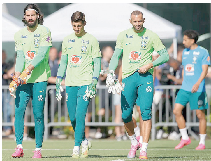
Preocupação passa por formação para o próximo jogo e o calor extremo de 38°

Embora Paquetá esteja praticamente fora da Copa por conta