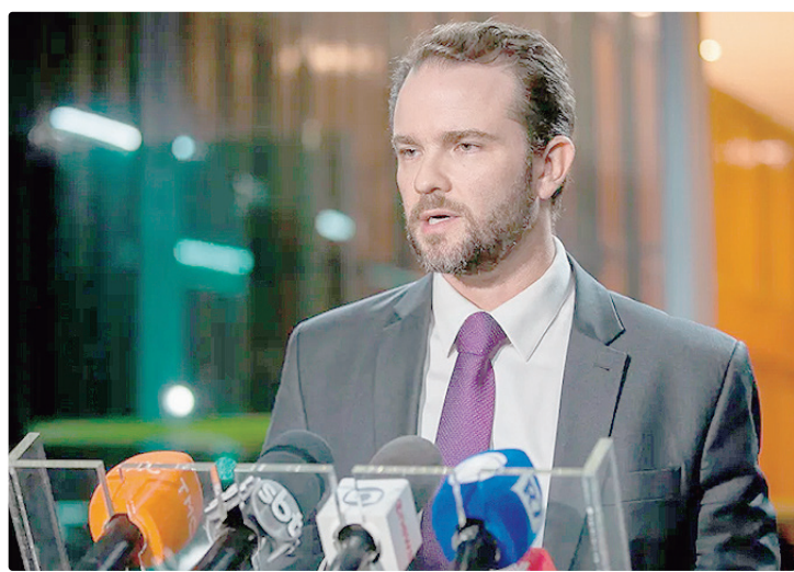
Durigan: “O receio é que haja uma interferência na soberania brasileira”

“Quem tem que cuidar de segurança pública no Brasil são os brasileiros, é a polícia brasileira, são os investigadores brasileiros, é o Coaf, a Receita Federal, são as nossas instituições