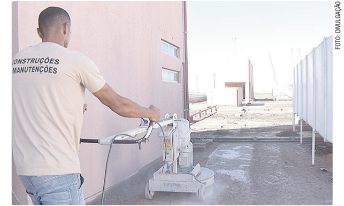
Do lado de fora, as equipes trabalham na infraestrutura de rede

A ocupação será feita de forma gradual. A SODF será o primeiro órgão a se instalar no Centro Administrativo. Em seguida, está prevista a transferência da Governadoria, da Casa Civil e da Casa Militar. Outros órgãos do GDF, como Secretaria de Desenvolvimento Urbano e Habitação (Seduh), Secretaria de Transporte e Mobilidade (Semob) e DF Legal, também elaboram estudos para futuras mudanças.