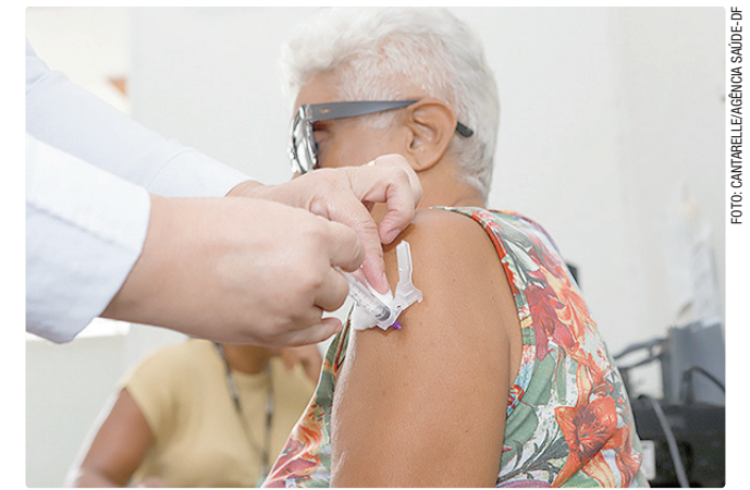
Análise comparou 520 mil vacinados com 2 milhões sem vacina

A Sociedade Brasileira de Imunizações recomenda que a vacina seja tomada por todos os idosos acima de 70 anos, e pelas pessoas entre 60 e 70 anos que tenham algum fator de risco.