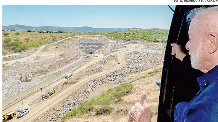
Obra inaugurada por Lula conecta as águas do rio na Paraíba ao oeste potiguar

“De 1846 a 2005, nunca deixaram fazer essa obra. Mas também nunca se importaram com a quantidade de mães, pais e crianças que saíam da sua terra natal, iam tentar a sorte em São Paulo,