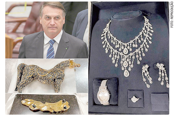
Joias sairão da Caixa, em Brasília, para a Alfândega do Aeroporto de SP

O sigilo do processo havia sido levantado por Moraes em julho de 2024, após a Polícia Federal concluir as investigações e entregar os relatórios finais. Com a nova decisão, o ministro determinou que a Superintendência da Receita Federal e a Polícia Federal em São Paulo sejam notificadas para operacionalizar a transferência dos bens.