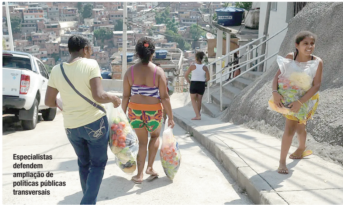
Especialistas defendem ampliação de políticas públicas transversais