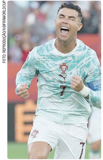
Perisic, CR7 (foto) e Gonçalo Ramos marcaram para Portugal

Agora, os suíços aguardam a definição do seu próximo adversário no torneio, que sairá do duelo entre Colômbia e Gana. Em uma possível disputa de quartas, o time do técnico Murat Yakin poderá ter pela frente a Argentina, atual campeã mundial.