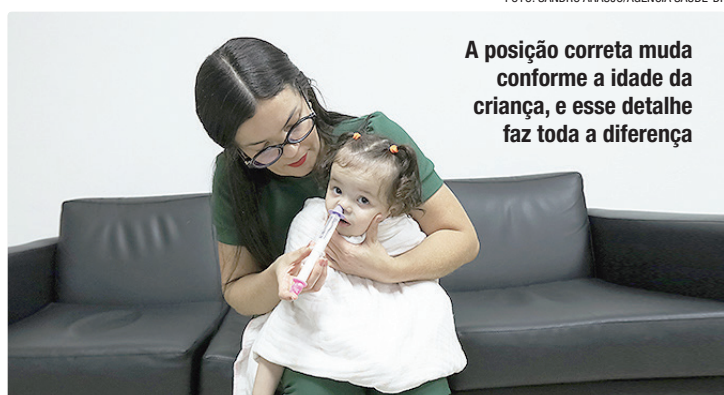
A posição correta muda conforme a idade da criança, e esse detalhe faz toda a diferença

“A lavagem nasal é uma das principais medidas para higienização e desobstrução das vias aéreas superiores, evitando assim