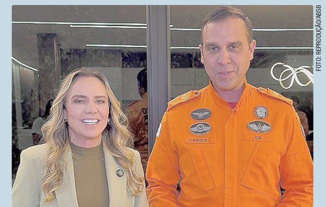
Celina homologou 2.829 candidatos, ampliando o banco de aprovados

A ampliação da validade do concurso permite ao GDF manter um cadastro ativo de aprovados por mais tempo, facilitando a reposição gradual do concurso público e o fortalecimento operacional do Corpo de Bombeiros. A medida é considerada estratégica para o planejamento de médio e longo prazo da corporação, especialmente diante da crescente demanda por serviços de emergência, salvamento, resgate e prevenção no Distrito Federal.