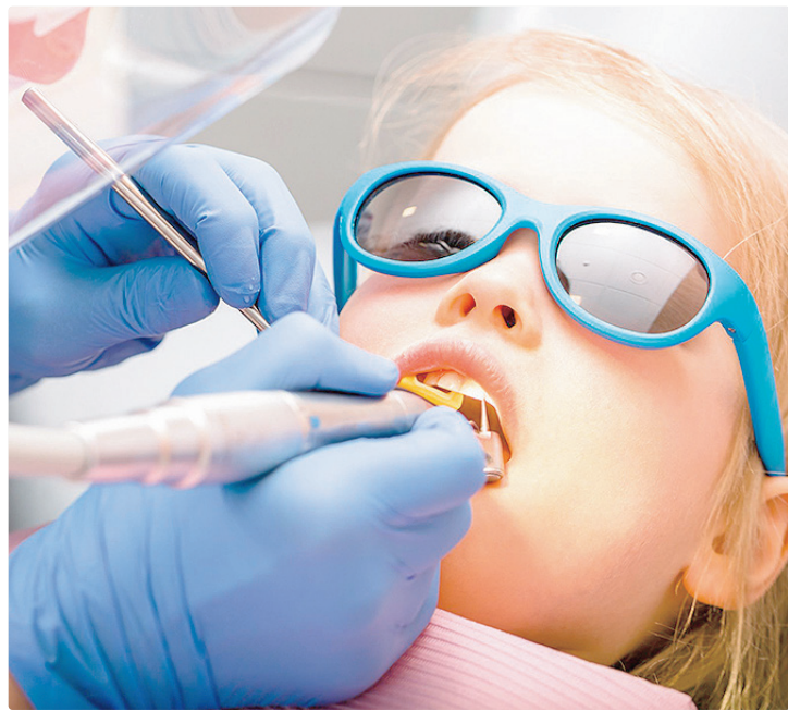
Campanha foca, principalmente, em crianças entre 6 e 14 anos de idade

Ela foi criada em 2019 e rapidamente ganhou alcance: em 2026, a iniciativa foi oficialmente reconhecida por lei federal como campanha de conscientização sobre a realização do exame ortodôntico anual em crianças de 6 a 12 anos. O movimento também passou a ganhar espaço nas escolas a partir de 2020, impulsionado por ações educativas, programas de prevenção e iniciativas legislativas voltadas à saúde bucal infantil. No Distrito Federal, por exemplo, uma lei sancionada, também em 2020, passou a prever avaliações ortodônticas anuais