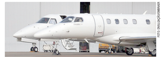
Embraer alcança projeção de 6% de aumento anual em entregas